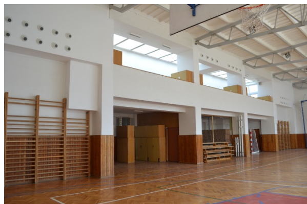
Vzduchotechnika s chladicí jednotkou v tělocvičně