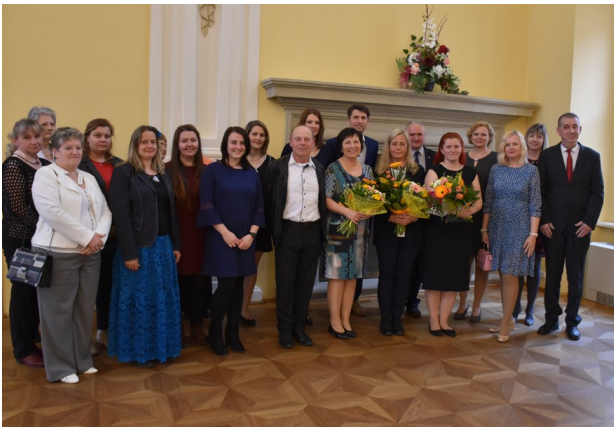
Den učitelů - ocenění