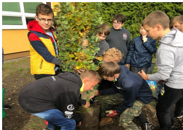
Strom pilířem života – projektové dny pro 6. a 7. ročník