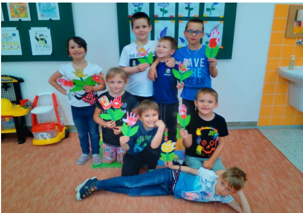
Den matek v přípravné třídě