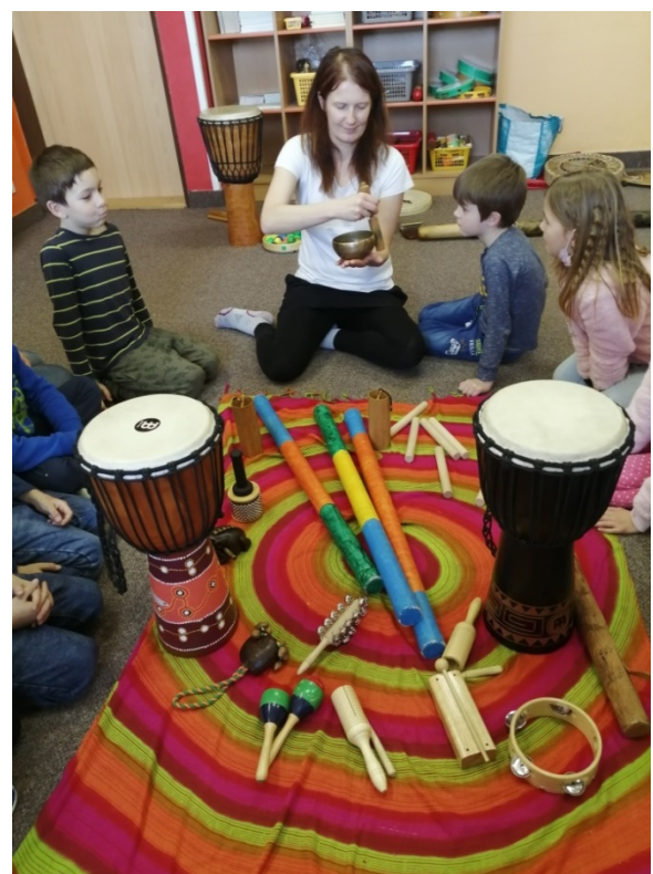
Muzikoterapie – školní družina