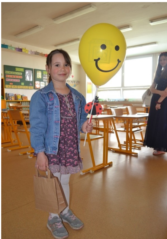
Zápis do 1. ročníku