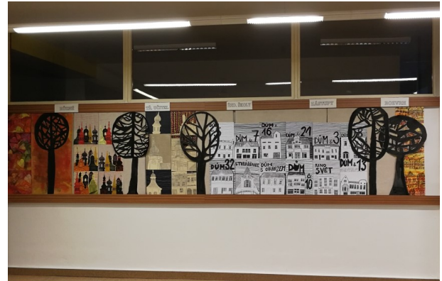
Výzdoba sborovny - volby