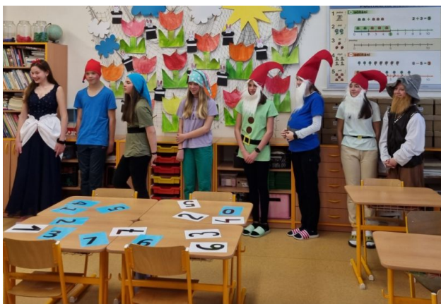
Pohádkový zápis do 1. ročník