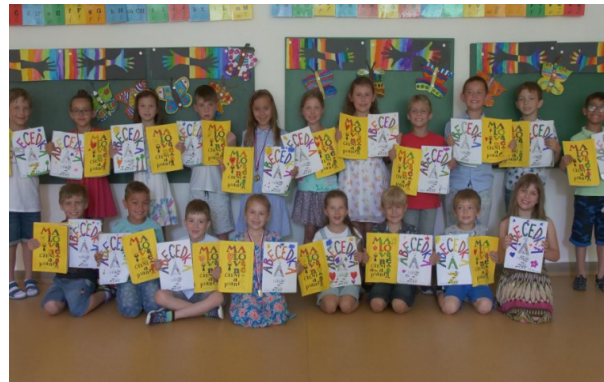
Prvňáčci si vyrobili knížky – „Abecedka od A(čka) do Z(zetka)“ a „Malované čtení a psaní“