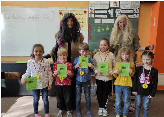
Recitační soutěž 1. stupeň