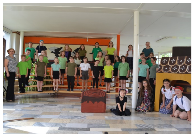
Hudební pohádka pro nejmenší