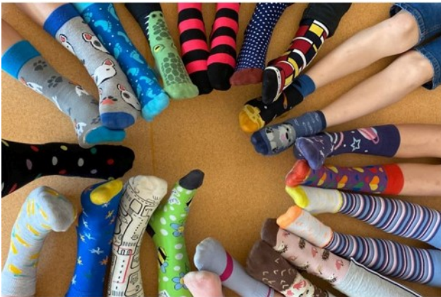
Den bláznivých ponožek