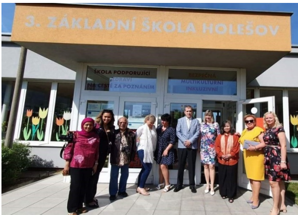
Návštěva velvyslankyně Indonésie