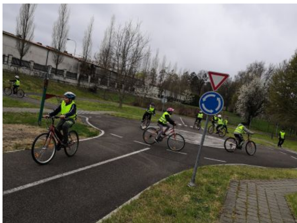
Dopravní hřiště Kroměříž 4. ročník