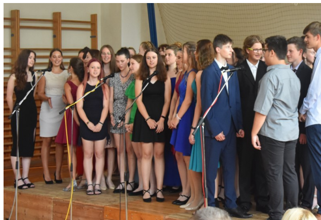
Rozloučení s devátáky