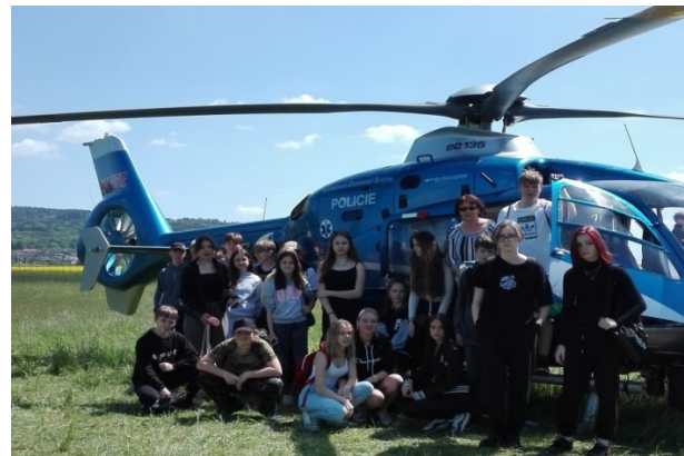
Den s policií