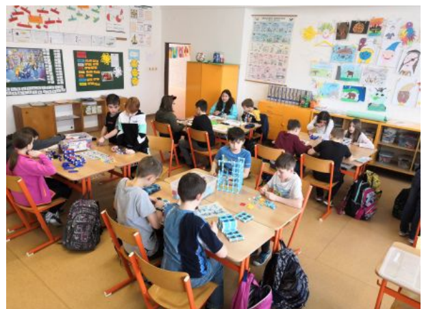
Práce ve skupinách