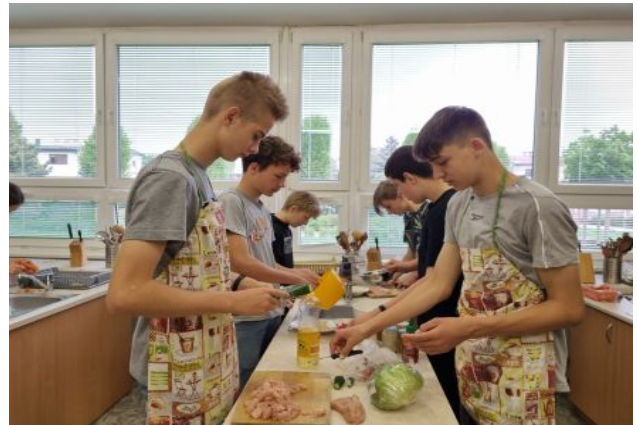
Vaření nás baví