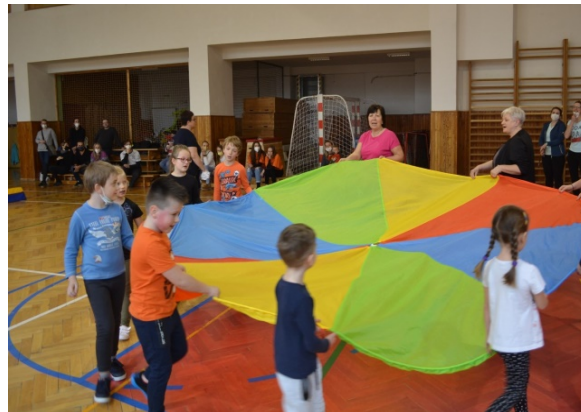
Předškolákovo sportovní odpoledne