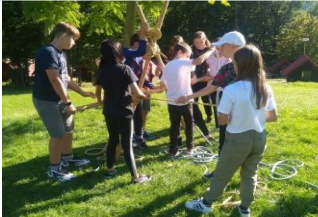
Adaptační kurzy – Rusava