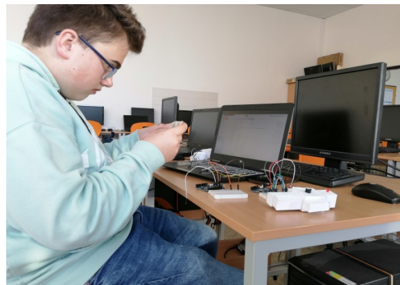
Kroužek logiky a robotiky