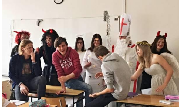
Soutěž a podnikaj