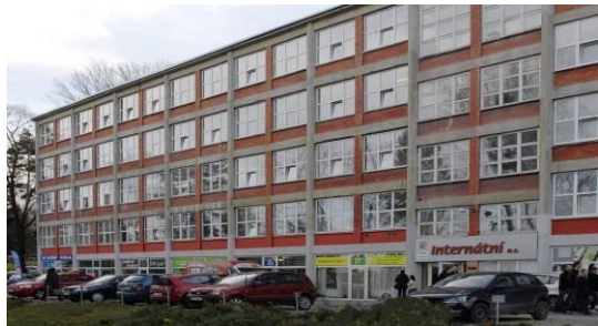
odl.pracoviště: nám. T.G. Masaryka 2433, 760 01 Zlín

Škola zahájila činnost v roce 1992 ve Zlíně, v roce 1993 byla zahájena výuka žáků v samostatně zřízené škole v Kroměříži. V roce 2001 došlo ke sloučení obou škol.