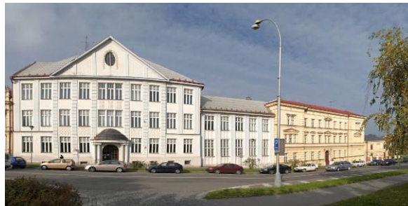
Tovačovského 337, 767 01 Kroměříž