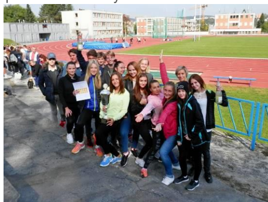
Sportovně turistický kurz – Rusava