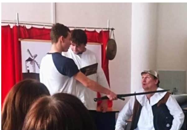
Divadélko na školách