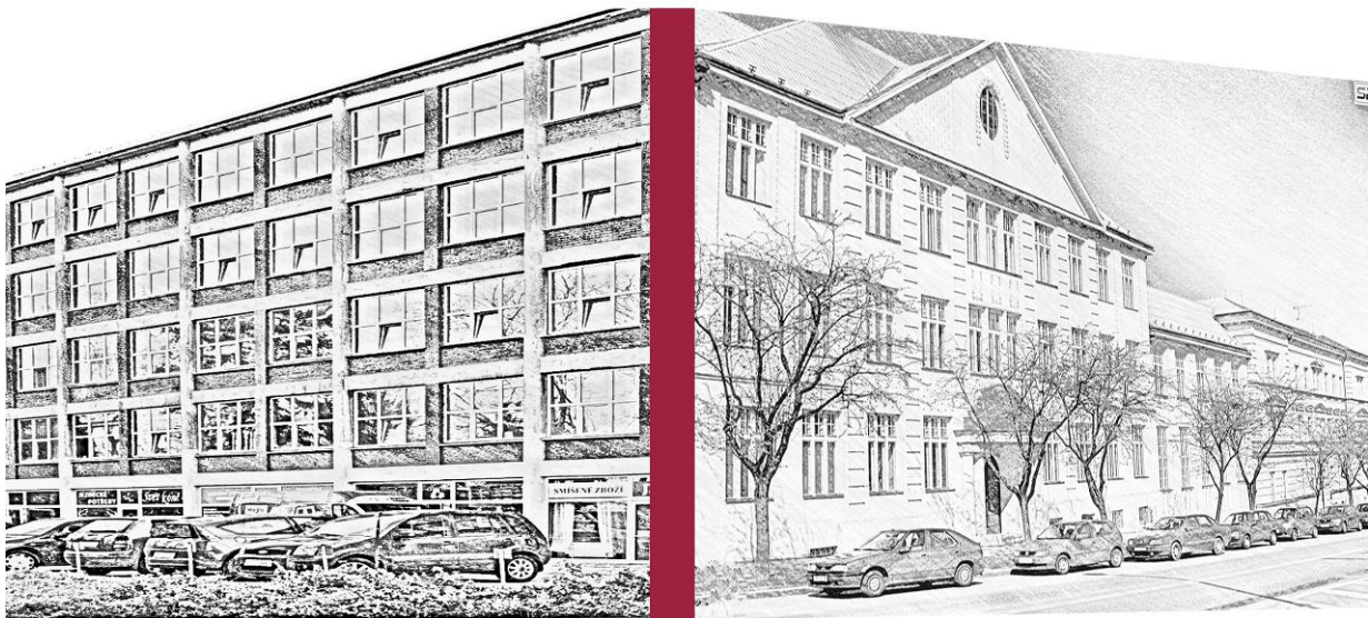
Střední škola podnikatelská a Vyšší odborná škola, s.r.o.