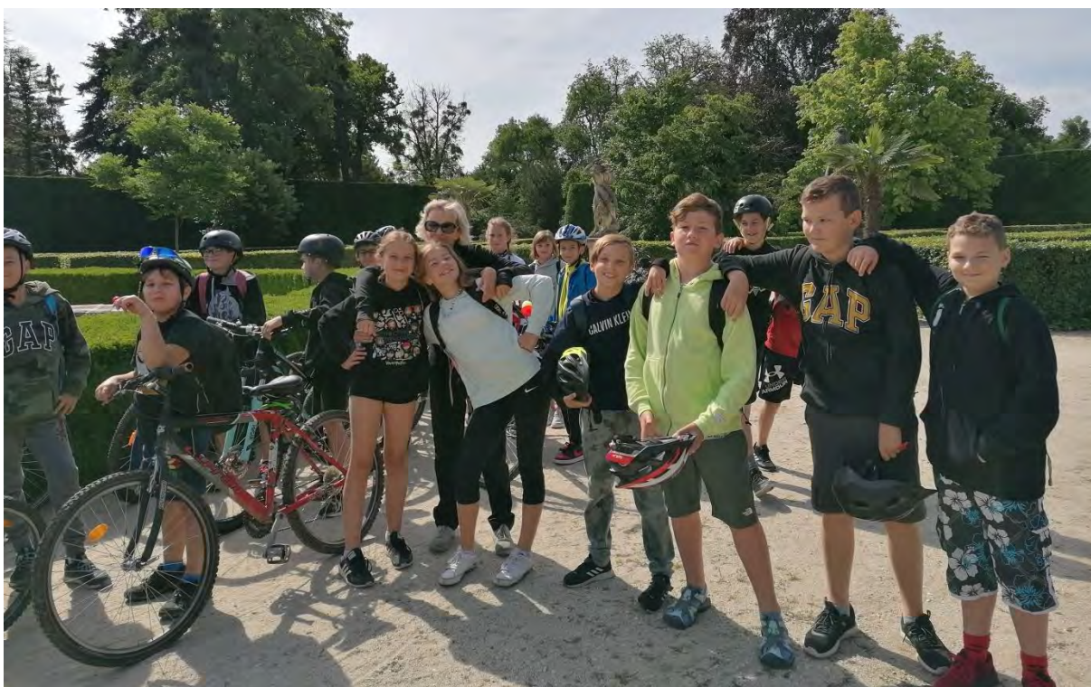
Zpracovala: Mgr. Světlana Čumalová

Dne 14. 6. 2022 jeli žáci pátých tříd v rámci hodin tělesné výchovy na cyklistický výlet. Kančí oborou se dostali na Janův hrad. Zde byla první zastávka na malé občerstvení. Následně se žáci přesunuli přes město Lednice ke chrámu Tří Grácií a k Hubertovu chrámu. Cesta zpět byla opět spojená se zastávkou na malé občerstvení. Výlet se vydařil, po celý den svítilo sluníčko, všichni přijeli spokojeně zpět do školy.