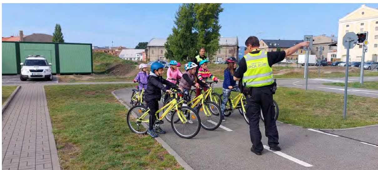
Zpracovala: Mgr. Šárka Helešicová