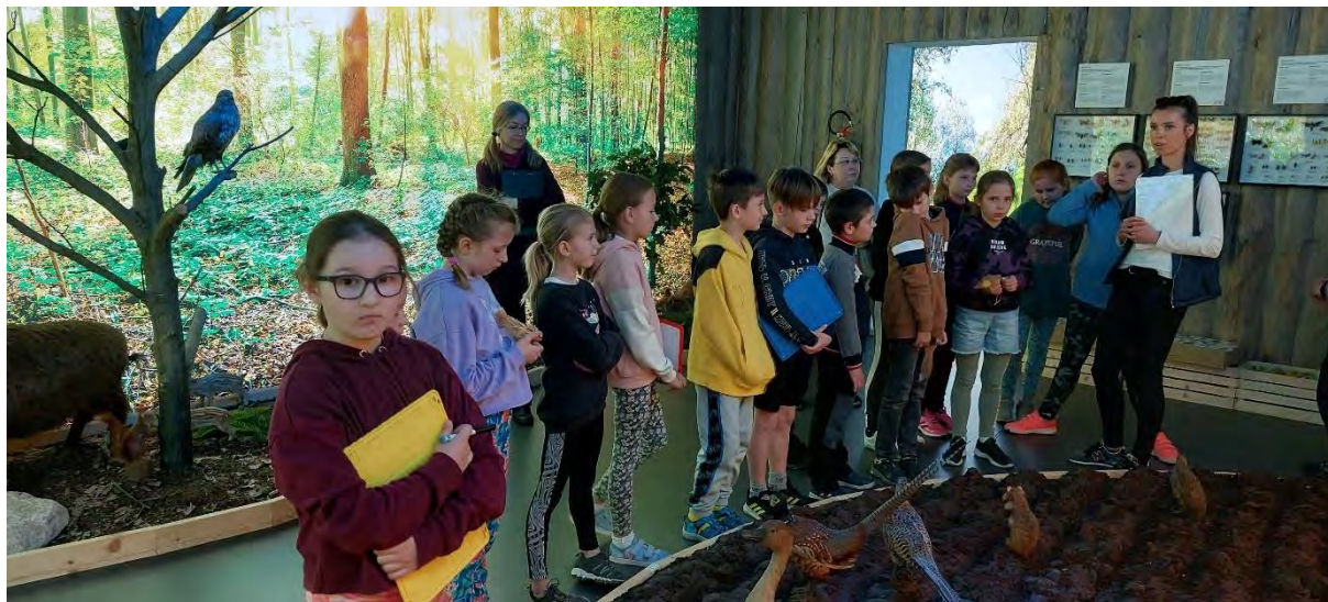
Zpracovala: Mgr. Šárka Helešicová

Dne 3. května se žáci 3. B vydali autobusem do Valtic. V Národním zemědělském muzeu byl pro ně připraven program na téma krajinou LVA. Žáci postupně zrakem i sluchem objevovali krásu okolní přírody dělenou na jednotlivé biotopy, zaměřili se na typické rostliny i živočichy žijící v daných lokalitách. Se zaujetím poslouchali jejich zvuky a zpěv. Na pracovních listech odpovídali na otázky k tématu, vybírali správné odpovědi ze života rostlin a živočichů. Vyzdobili si na památku suvenýr ve tvaru ryby dle načerpaných poznatků o jejich zbarvení. V závěru vyzkoušeli na vlastní kůži bosou nohou chodník z různorodých přírodních materiálů.