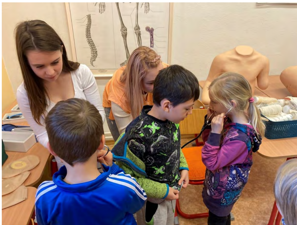
Zpracovala: Mgr. Michaela Hromková

Odcházel jsme nadšení, plni dojmů a nových zážitků a budeme se těšit na další spolupráci.