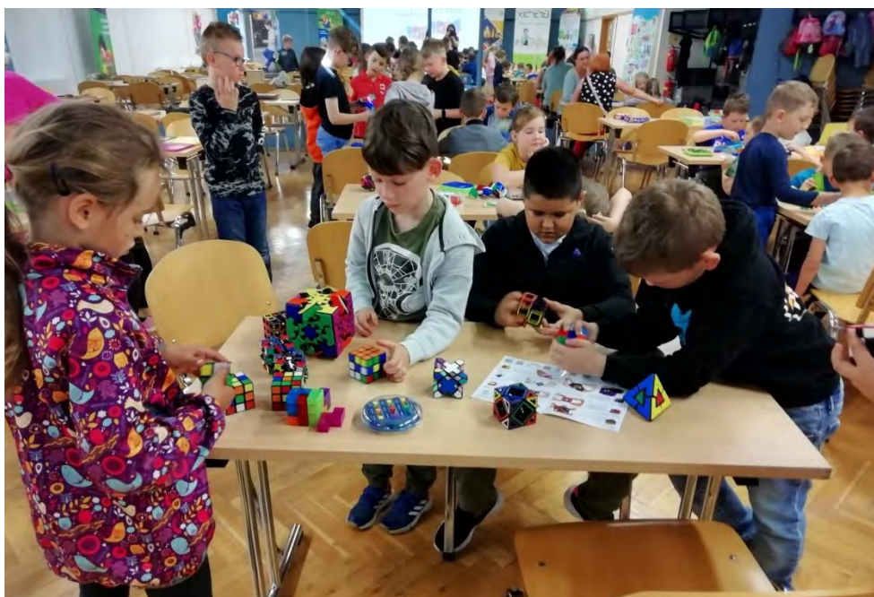
Zpracovala: Mgr. Michaela Hromková

Protože bylo možné vše si vyzkoušet, užili jsme si 2 hodiny plné zábavy.