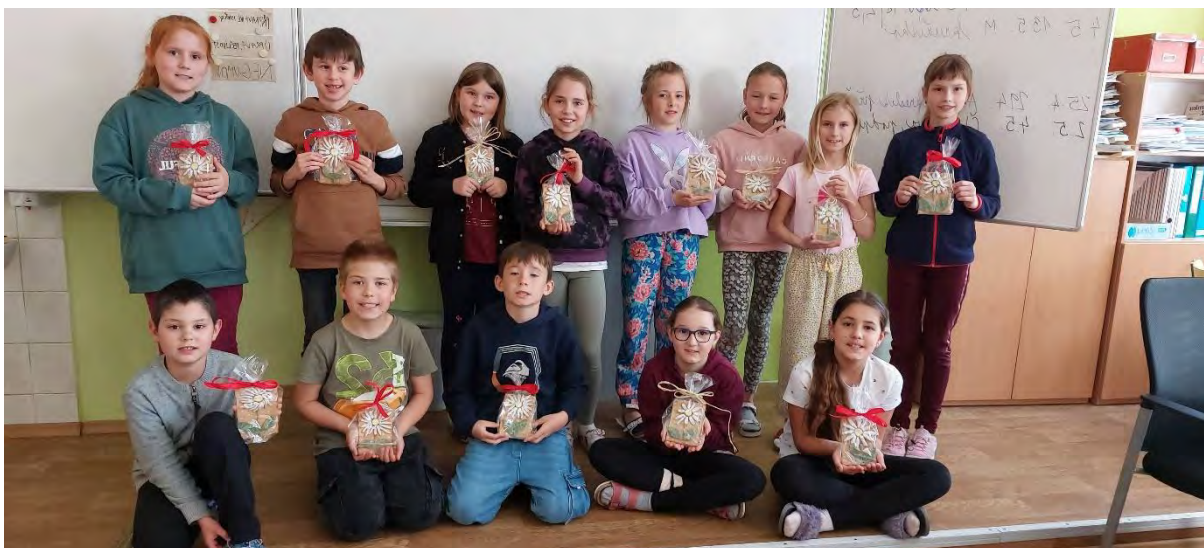
Zpracovala: Mgr. Šárka Helešicová