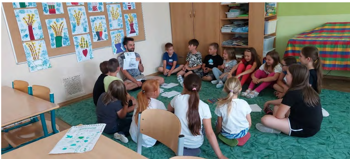
Zpracovala: Mgr. Šárka Helešicová

Cílem programu bylo vysvětlit dětem pravidla bezpečného užívání internetu a dalších sociálních sítí a upozornit je na rizika spojená s jejich užíváním.