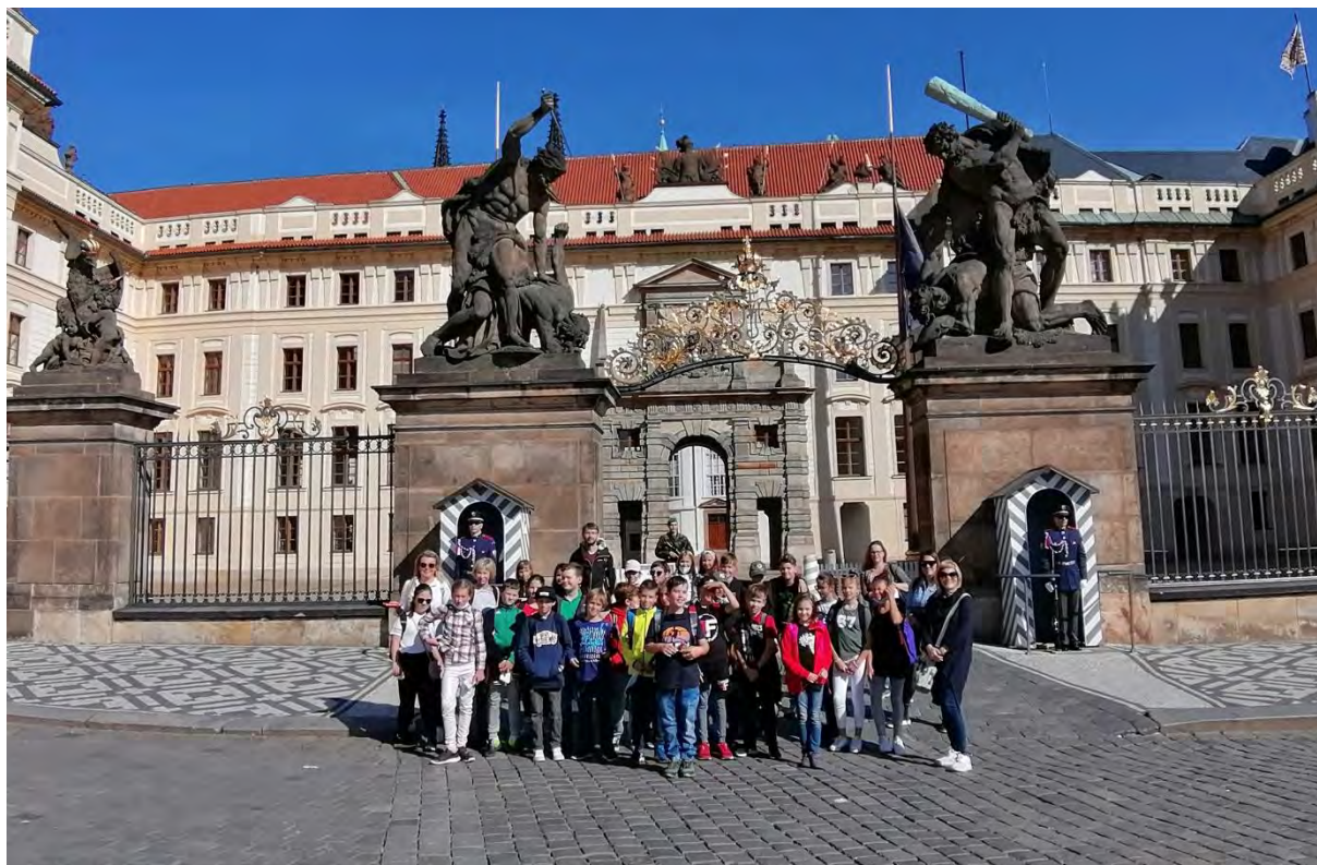
Zpracovala: Mgr. Světlana Čumalová

Dne 1. 10. 2021 jeli žáci pátých tříd na školní výlet do hlavního města Prahy. Zde navštívili spoustu památek, jako Pražský hrad, Karlův most či Staroměstské náměstí s orlojem. Počasí nám přálo, bylo slunečno, děti si program pořádně užily.