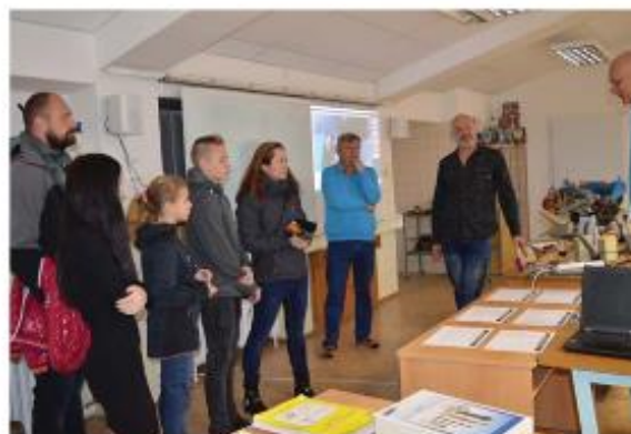
Zpravodaj Města Bystřice nad Pernštejnem a Mikroregionu Bystřicko

Vyšší odborná škola a Střední odborná škola zemědělsko-technická Bystřice nad Pernštejnem