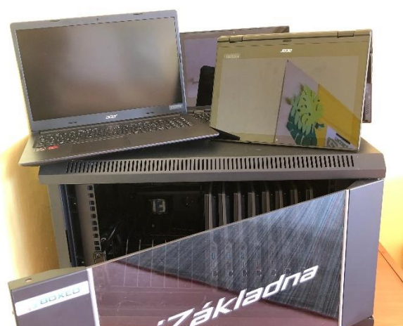
iZákladna a notebooky s dotykovými displeji