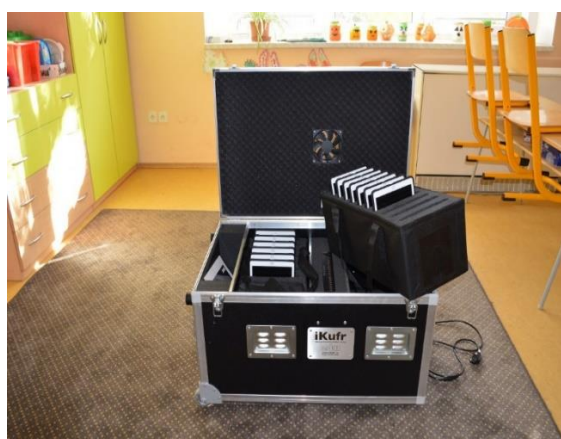
i-kufra + tablety