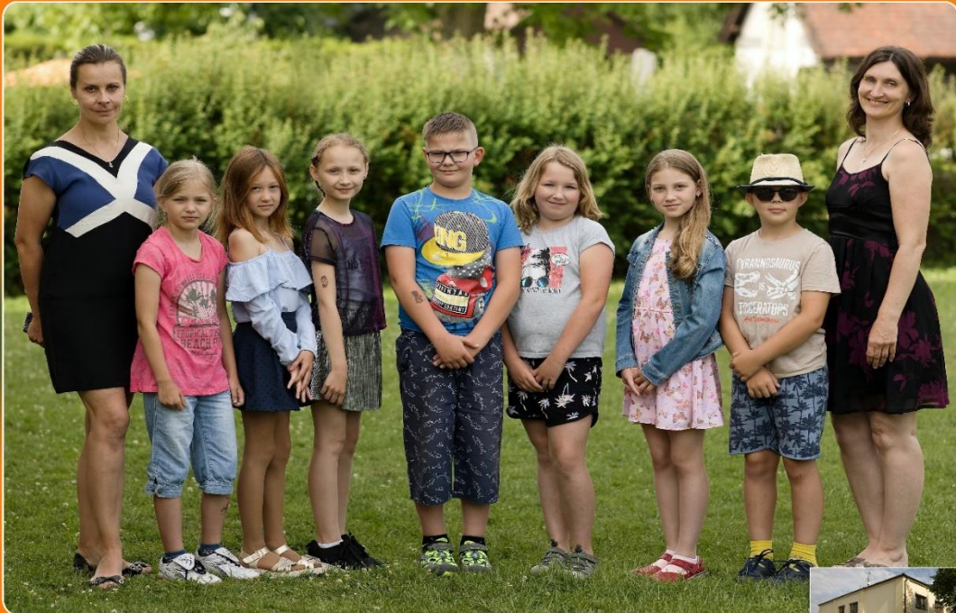
Základní škola Kratonohy červen 2022