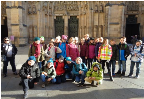
Listopadový výlet do Prahy – 5.ročník