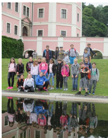
Z výletu II. B A V. B – Bečov nad Teplou

V rámci celoročního projektu „Jsem čtenář“, který probíhal mezi prvními třídami.