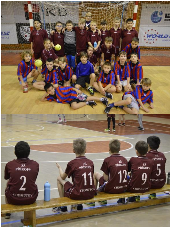
Obrovský úspěch v turnaji miniházené. První a druhé místo si odnášela družstva naší školy .