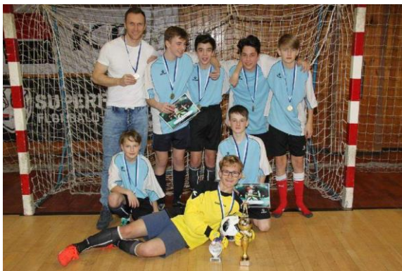
Naše družstvo – vítězové Žákovské futsalové ligy