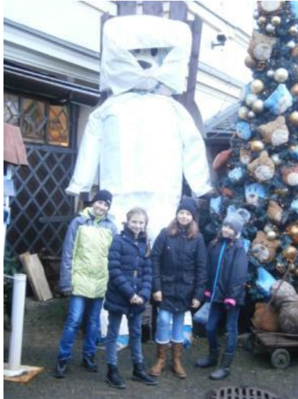
Z Vánoční besídky VI. A