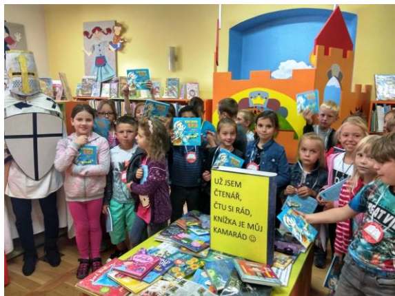
Pasování na čtenáře v I. A

V rámci celoročního projektu „Jsem čtenář“, který probíhal mezi prvními třídami.