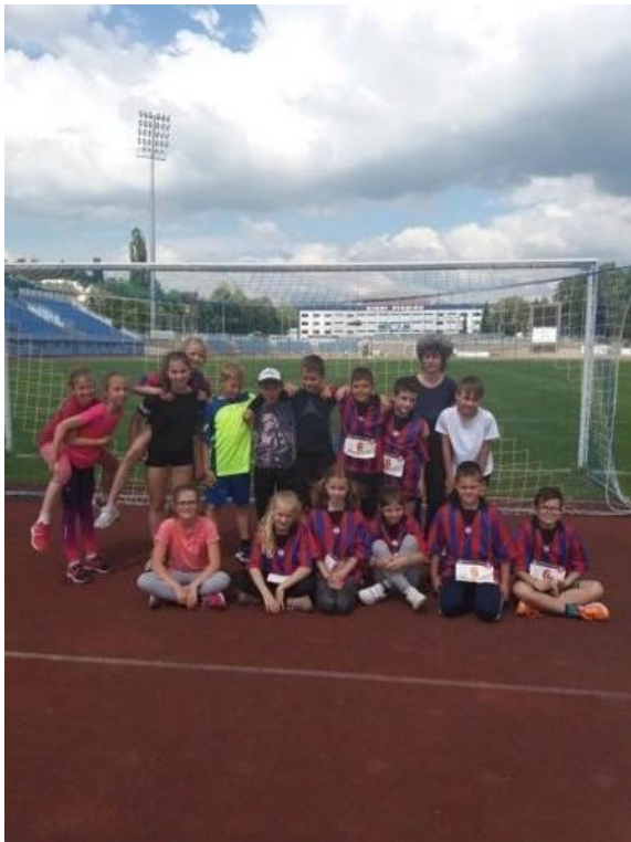
Úspěšná štafeta 4.a 5.ročníku