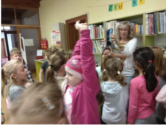
Prvníáci v Městské knihovně