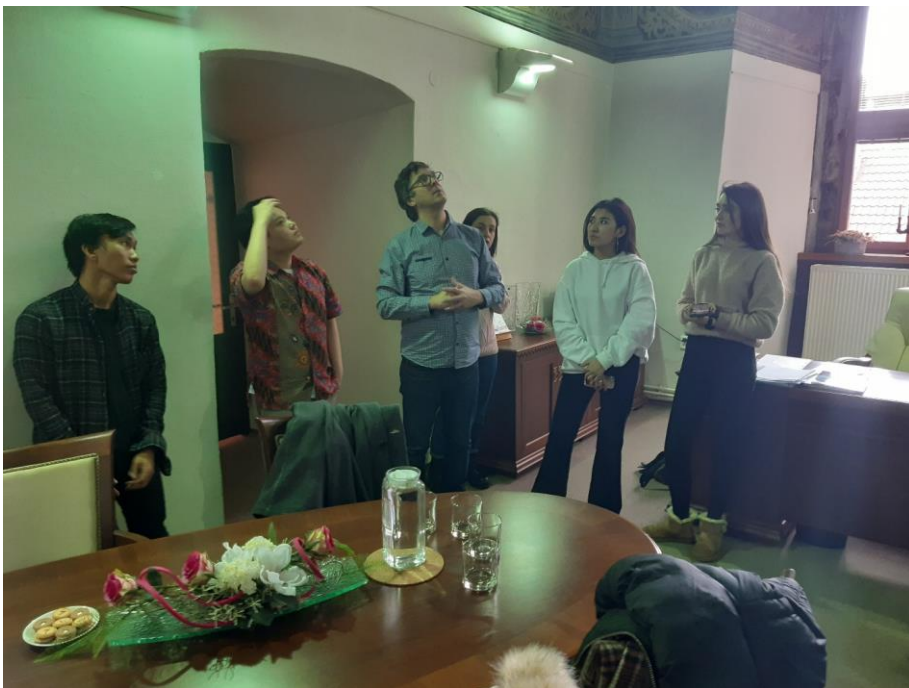
Na návštěvě na radnici si poslechli Tobiášovu legendu

Týden rychle utekl a v pátek jsme se s nimi rozloučili. Krásné suvenýry, třeba až z daleké Indonésie, budou tuto návštěvu určitě dlouho připomínat.