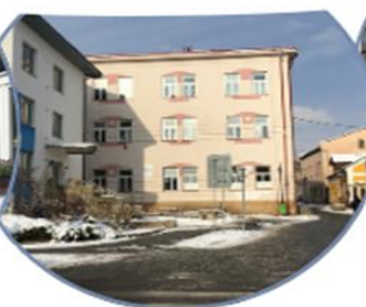
Vrchlického 700, Dvůr Králové n.L.

tel.: 499 320 751 www.zs-dk.cz , info@zs-dk.cz