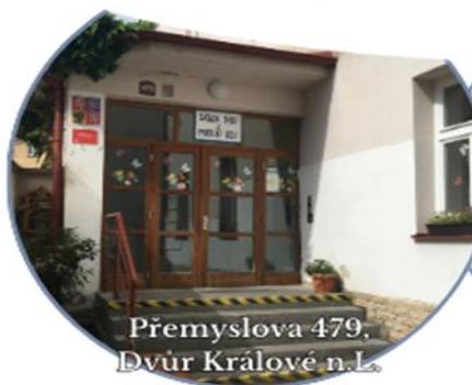
Přemyslova 479, Dvůr Králové n.L.