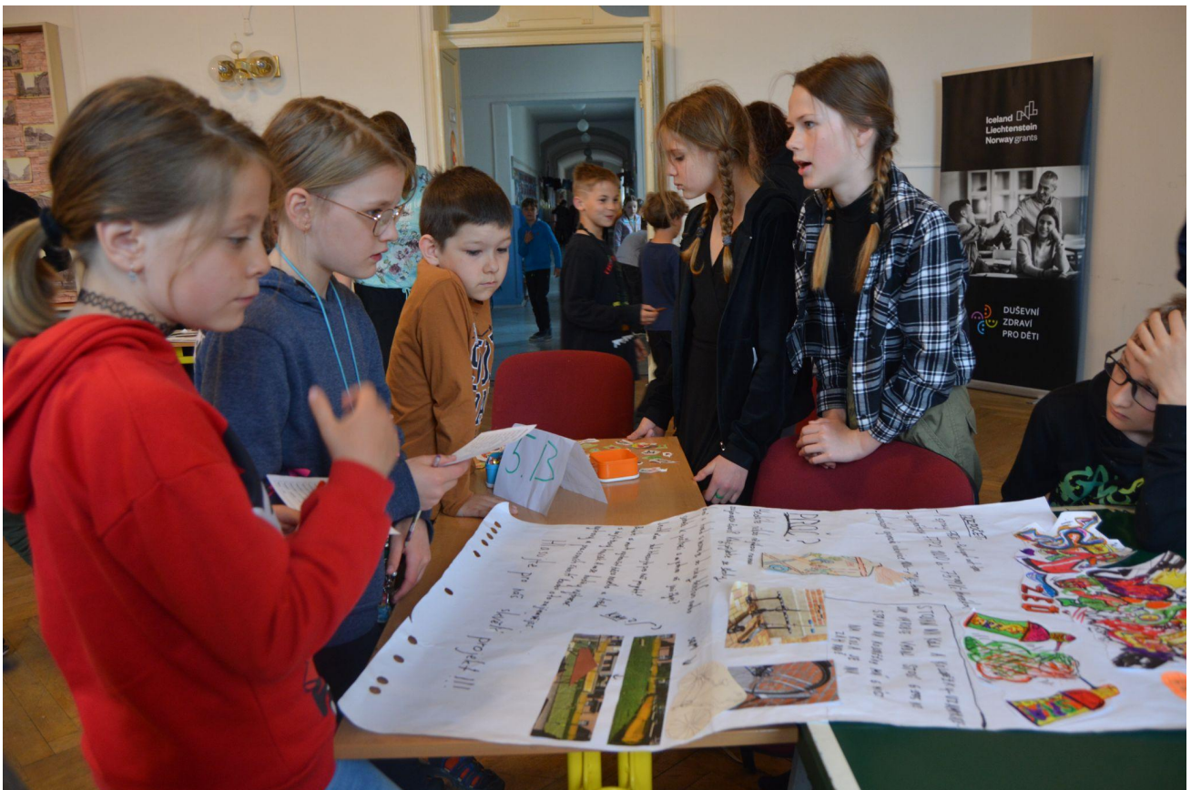
Péběčko - kampaň