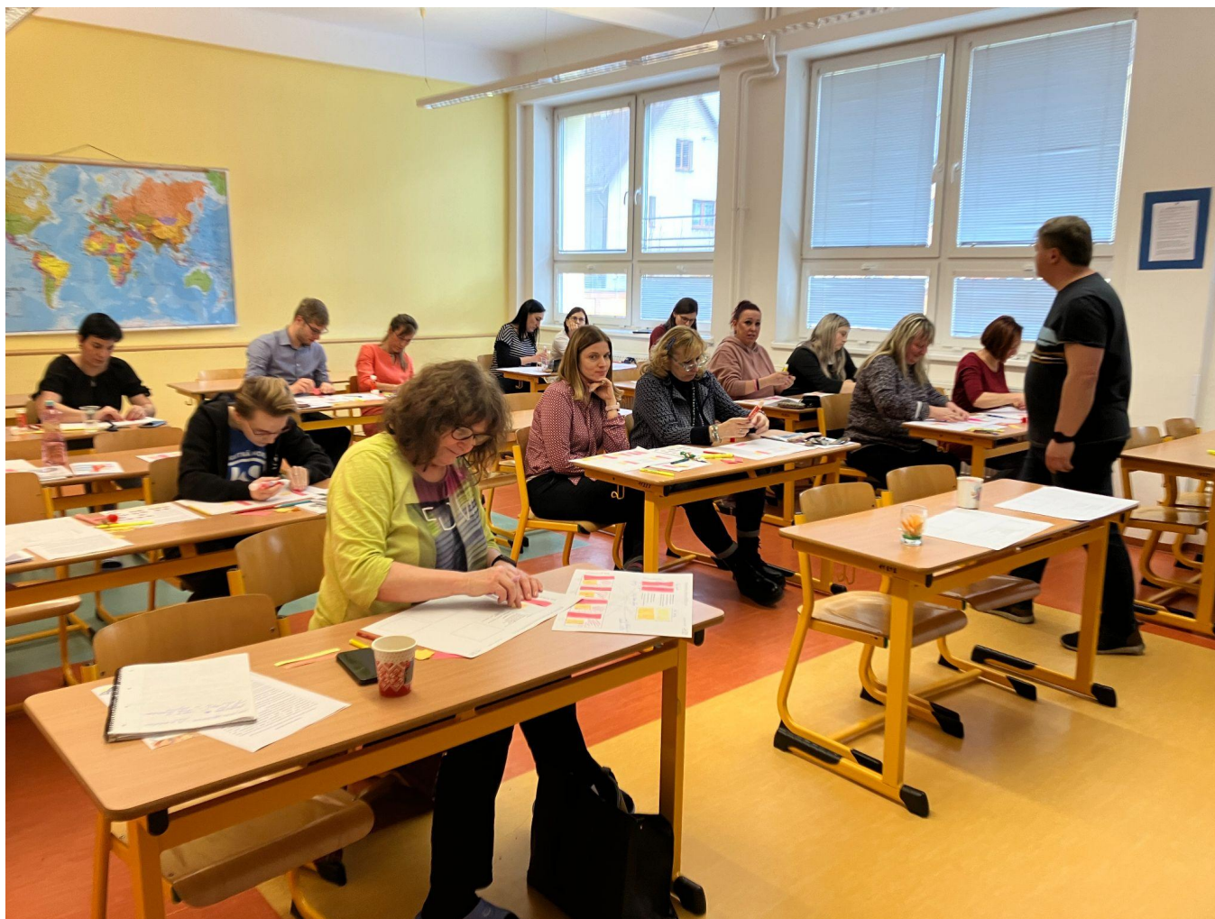
Pedagogické tvořivé dny na ZŠ Janáčkovo nám. Krnov Kurzík