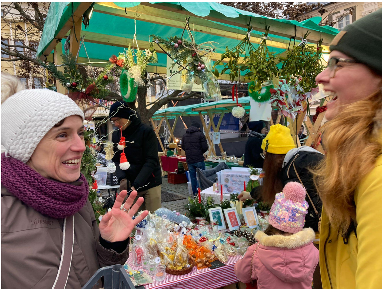
Vánoční jarmark v režii rodičů