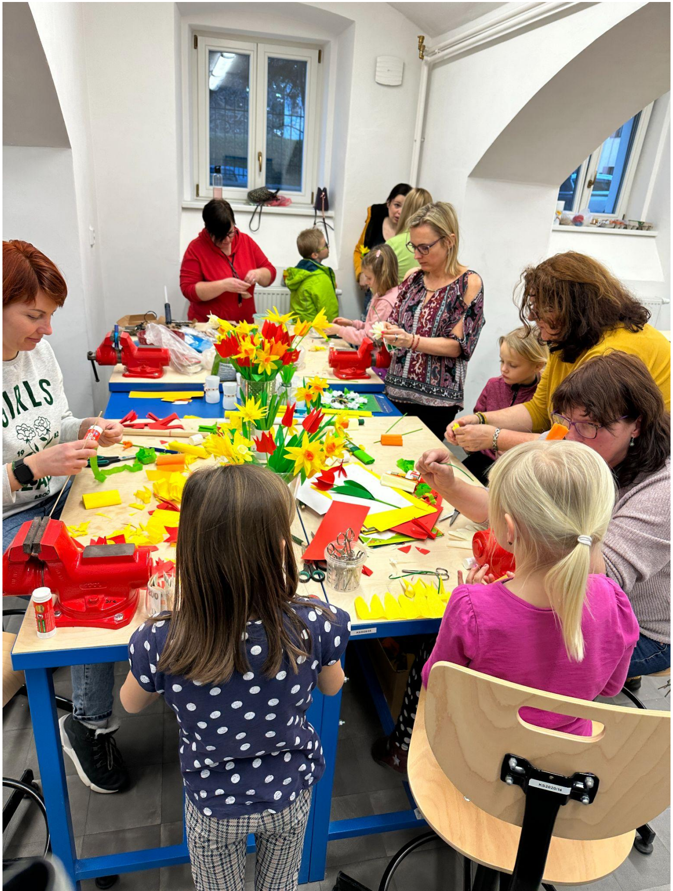
Velikonoční tvoření v režii rodičů, učitelů a asistentek