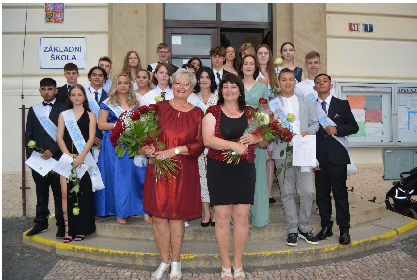
Rozloučení s devátáky