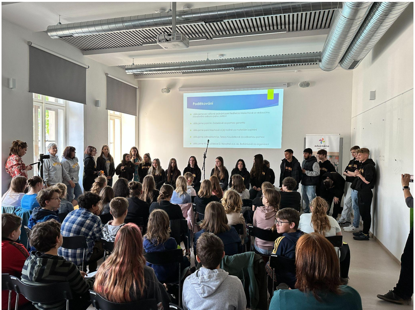
Řešíme společnou výzvu