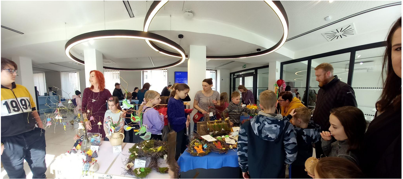
Velikonoční jarmark v České spořitelně