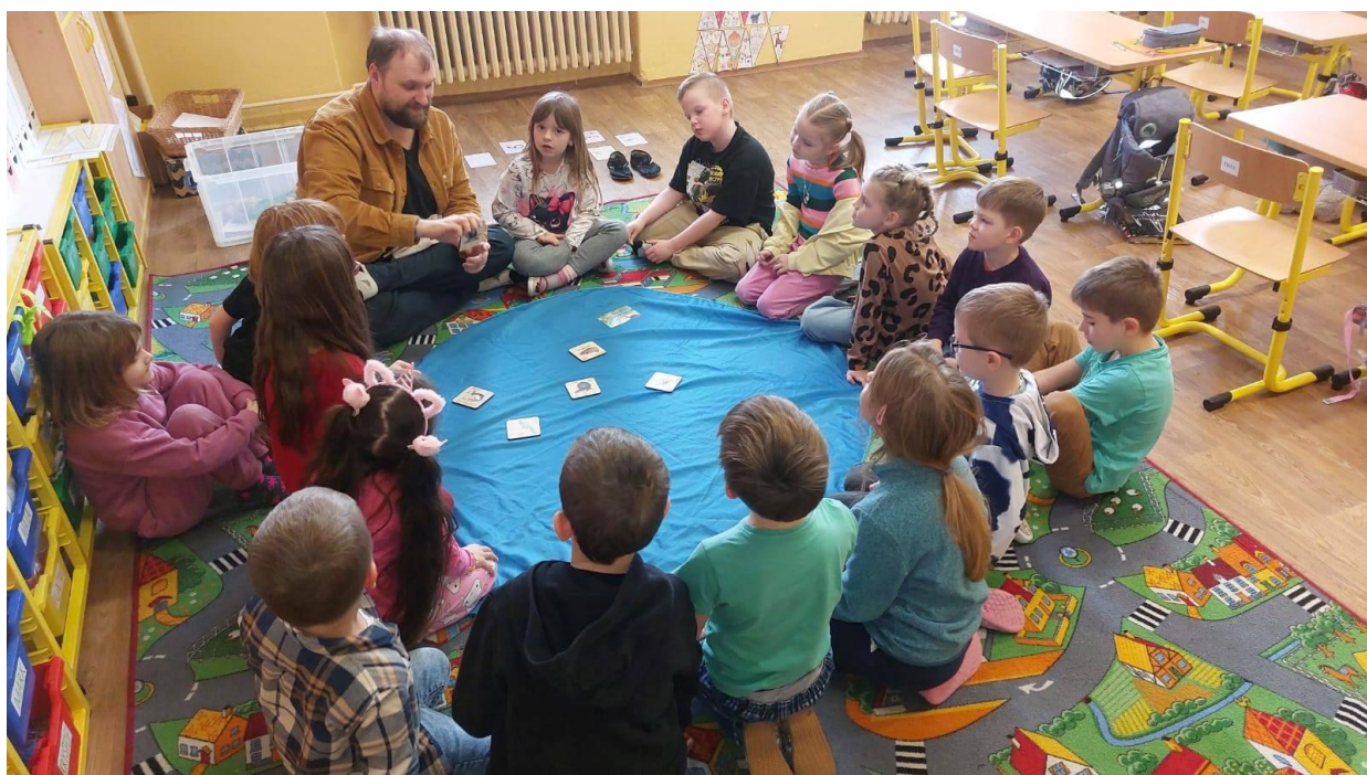
program ekologického střediska SEVER v 1.třídě

Škola má poradenské pracoviště, dvě pedagožky mají kvalifikaci speciální pedagog. Škola nabízí logopedickou péči a pro děti s podpůrnými opatřeními předmět speciálně pedagogické péče.