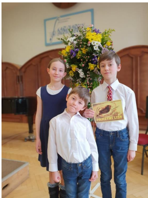
Karlovarský skřivánek – celonárodní kolo