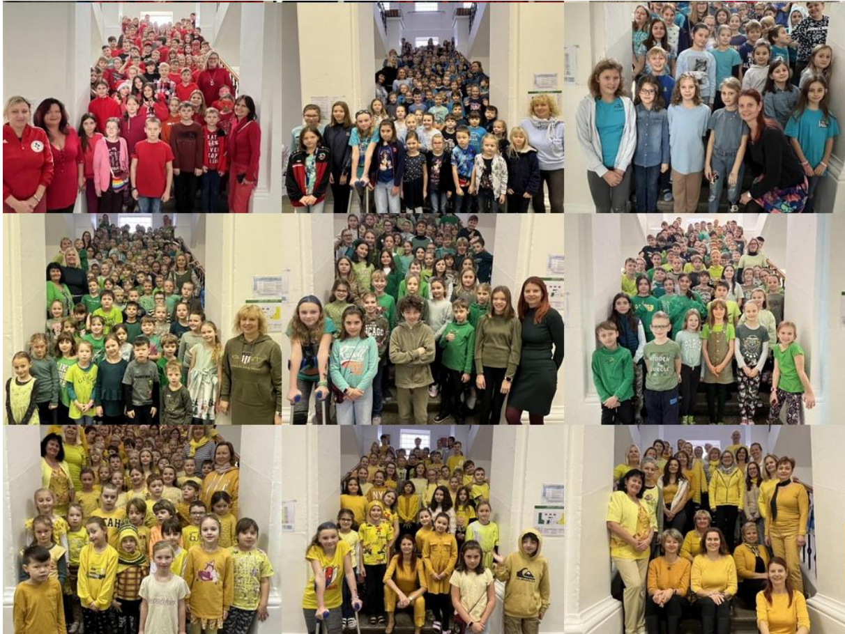
Tematické dny školního parlamentu - Barevný týden na Seifertce