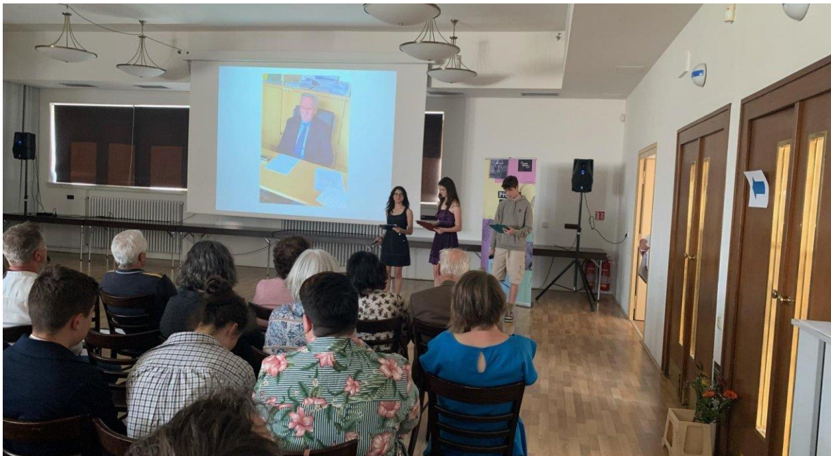
Projekt Příběhy našich sousedů