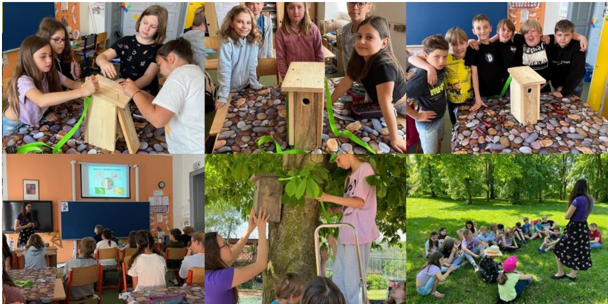
Projekt ptačí budky

Vyučující zařazují do výuky miniprojekty na různá aktuální a zajímavá témata, v některých třídách 1. stupně jsou realizována centra aktivit. Školní žákovský parlament organizuje tematické dny a projektové dny.