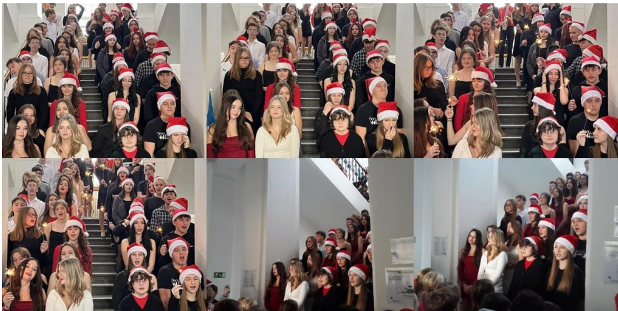
Vánoční projektový den – koncert na schodech