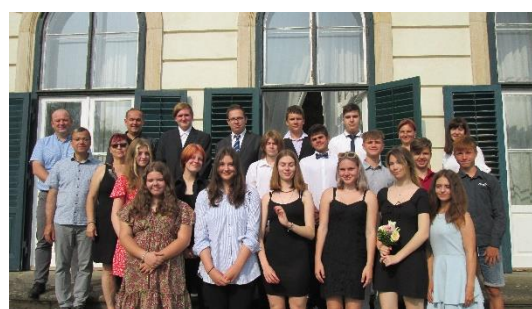
Foto: slavnostní rozloučení s deváťáky na zámku

Zápis do 1. ročníku pro školní rok 2022/2023 proběhl 13.4. 2022, letos klasickým způsobem. Předškoláci podstoupili test svých řečových, pohybových a grafomotorických dovedností. Rodiče 6 dětí požádali o odklad školní docházky. Do 1. třídy by mělo nastoupit 19 dětí.