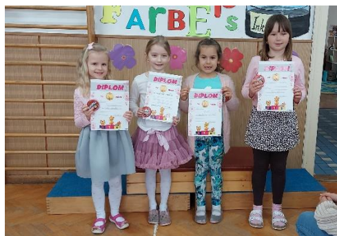
vítězové kategorie 1. třída