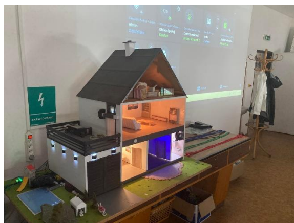
vítězný tým a naprogramovaný dům se systémem Loxone