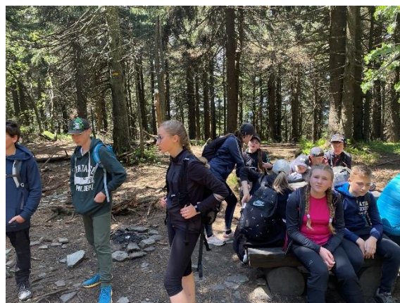
turistický kurz měl velký úspěch