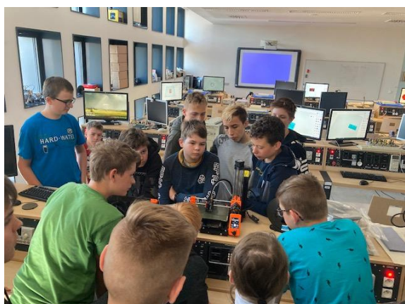
projektový den mimo školu – 3D tisk

V rámci projektu šablony jsme od září 2021 do května 2022 realizovali celkem 25 projektových dnů (4 mimo školu a 21 ve výuce). Projektové dny byly zaměřeny na environmentální výchovu, kariérové poradenství a polytechnickou výchovu, ve které jsme se věnovali zejména 3D tisku.