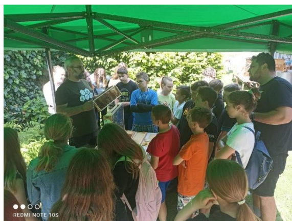
projektový den ve výuce - Včely