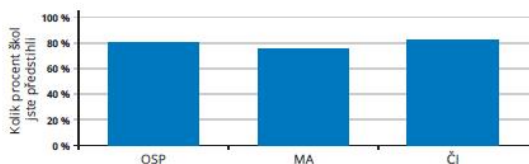
Jak si stojíme mezi ostatními? Relativní postavení školy