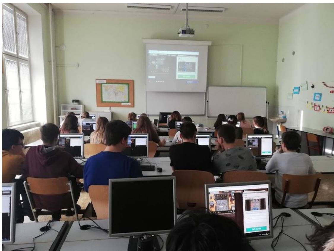
Hour of code