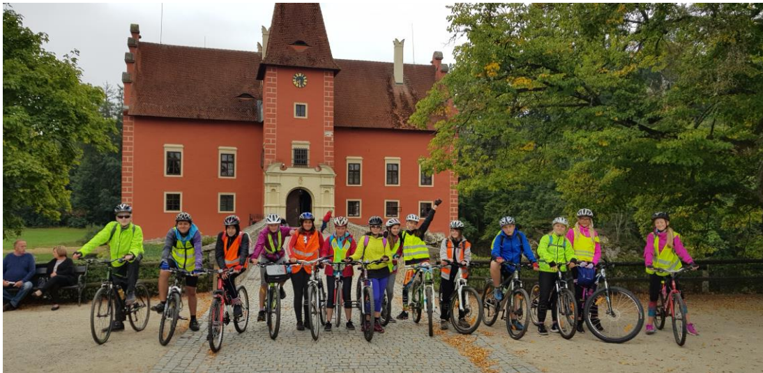
Cyklistický kurz 8. ročník, září 2019