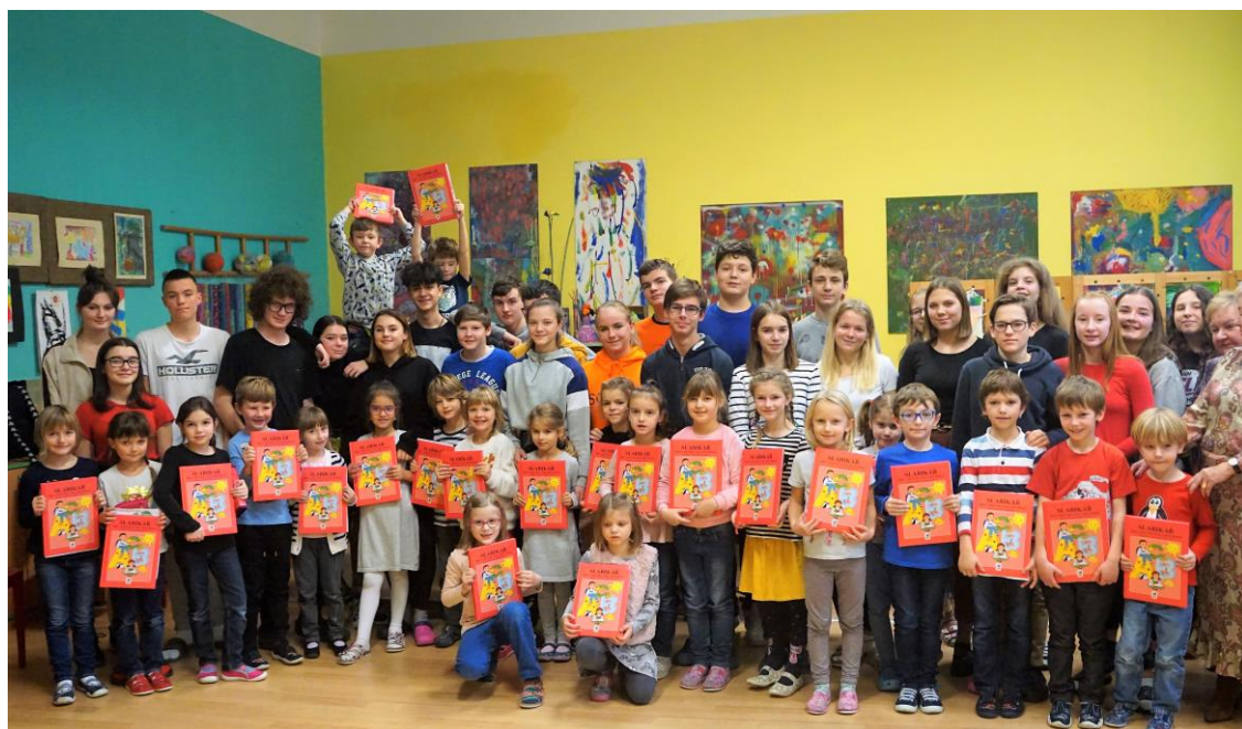
Tradiční slavnostní předávání slabikářů prvňáčkům