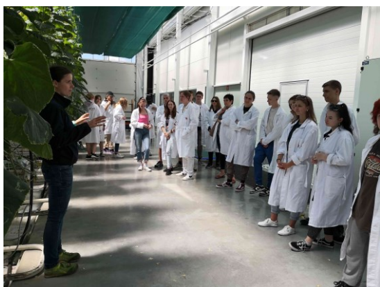
z exkurze na farmu Bezdínek

Naše škola dlouhodobě spolupracuje s družebními středními školami v Pszowe, Rydułtowach a v Żorach. Během školního roku 2021/2022 jsme připravili pro družební školy ze Pszowa Rydułtow 14. 6. 2022 kvízové dopoledne ve škole a odpoledne ekologicko-historickou exkurzi po karvinském okrese. Navštívili jsme farmu Bezdínek a následně jsme si prohlédli šikmý kostel u Karviné.