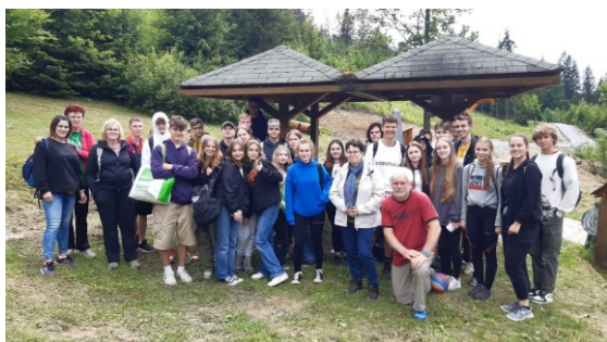
ze setkání na Trojmezí

Ve stejný den – 14. 6. 2022 jsme uspořádali s družební školou Zespół Szkół nr 1 Żory společně setkání na hranici – na Trojmezí u Hřavy. Na programu byly znalostní kvízy o Česku a Polsku, sportovní hry, posezení u ohně spojené s opékáním párků.