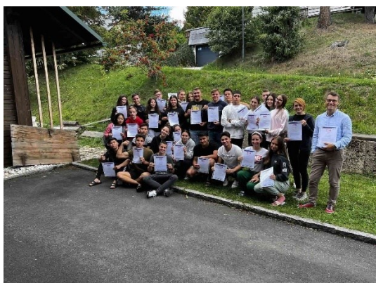
ze setkání v rakouském Grafenbachu

Celým pobytem nás provázela spousta workshopů, které obnášely práci a komunikaci ve skupinách. Pracovali jsme převážně na projektech, které se týkaly médií a jejich dopadu na společnost. Měli jsme také možnost poznat nové kultury a tradice, protože každá země měla za úkol vytvořit prezentaci a předvést své tradiční zvyky. V průběhu celého týdne (25. 8. – 3. 9. 2022) jsme stihli navštívit zajímavá místa: Diex, Griffen, Klagenfurt, Vídeň.