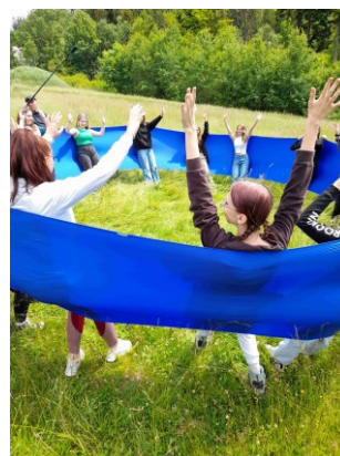
společné aktivity na Trojmezí