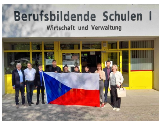
ze zahraniční praxe v Northeimu

V závěru školního roku, během května a června 2022, vyrazilo 20 studentů třetích ročníků do Northeimu v Německu, Narvy v Estonsku a do Dublinu v Irsku, aby získali nové pracovní zkušenosti. Podmínkou účasti bylo uspět ve výběrovém řízení a také absolvovat několikátýdenní přípravný kurz, jehož cílem bylo zvýšení odborné a jazykové kompetence žáků pro výkon stáže v zahraniční firmě či podniku. Pracovní místa v uvedených destinacích pomáhají zajišťovat partnerská škola v Northeimu a evropské agentury v Dublinu a v Narvě.