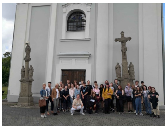
u šikmého kostela v Karviné

Ve stejný den – 14. 6. 2022 jsme uspořádali s družební školou Zespół Szkół nr 1 Żory společně setkání na hranici – na Trojmezí u Hřavy. Na programu byly znalostní kvízy o Česku a Polsku, sportovní hry, posezení u ohně spojené s opékáním párků.