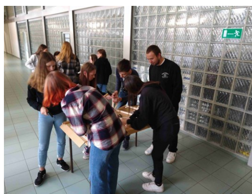
z projektu Bee important v Orlové