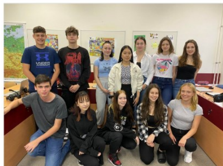
ze setkání v projektu Don@u online