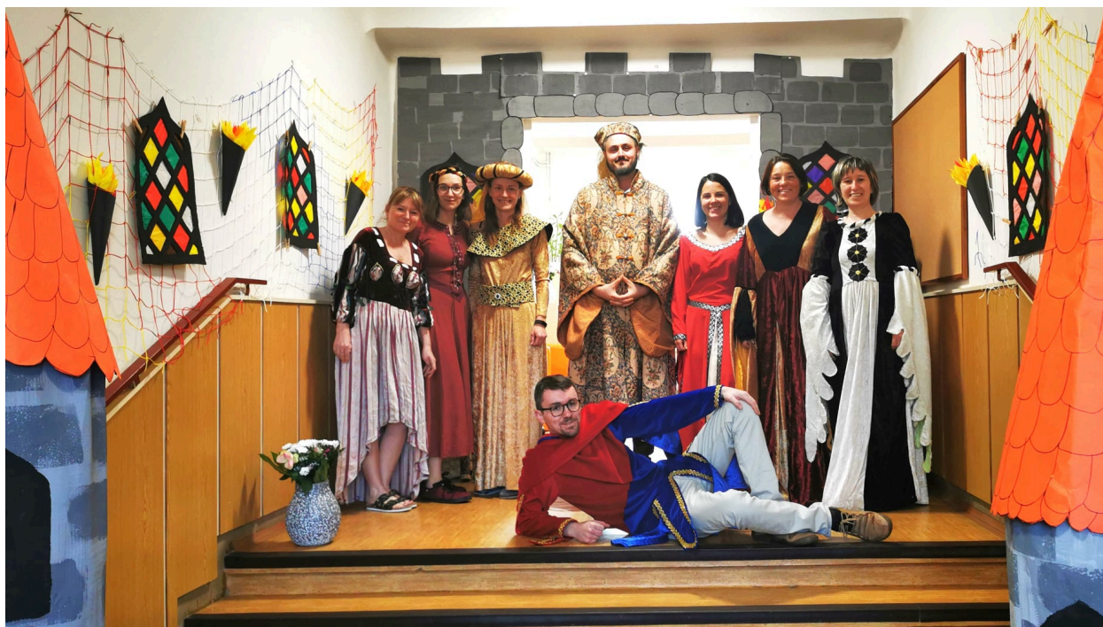
Fotografie ze zápisu do 1. ročníku.