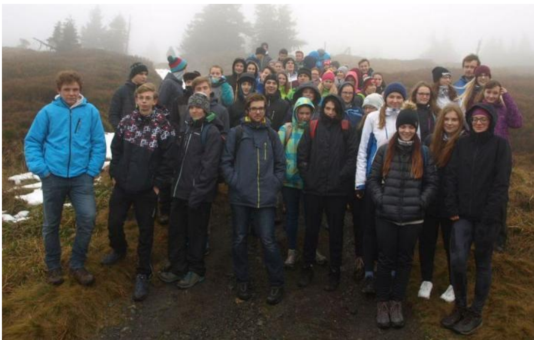
Obr. 3 Geografická exkurze tříd 2.A a 6.P – Hrubý Jeseník

2.A, 6.P – geografická exkurze na Jesenicko - Javornicko (7. – 8. 11. 2017). Obsahovala terénní měření (obec Travná, česko-polské hranice, Borůvková hora – vrchol Rychlebských hor, místo setkávání Havel – Wałęsa za totality, rozhledna), beseda na MÚ Jeseník se starostou Jeseníku a oběma místostarosty o hlavních problémech města i regionu, prohlídka města s pracovníkem MÚ se zaměřením na rozvojové investice města v posledních letech, exkurze do Minipivovaru Jeseník, program v Lázních Jeseník (měření, anketa, sběr dat pro pozdější vyhodnocení v GIS), krátká túra na hřeben Hrubého Jeseníku – kvartérní geomorfologie.