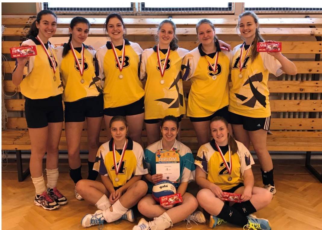
Obr. 4 Krajské kolo ve volejbalu dívek SŠ – družstvo Gymnázia Polička