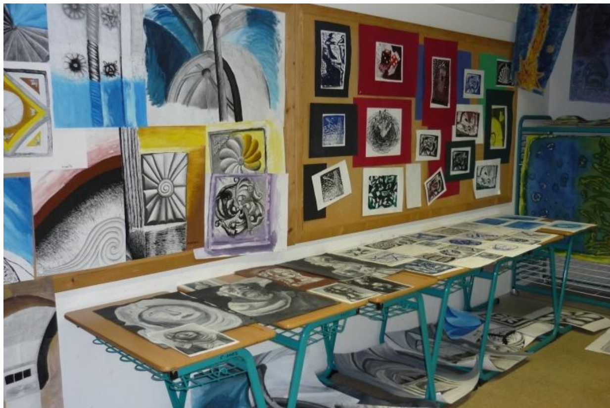
Obr. 1 Učebna výtvarné výchovy

V prostorách studovny se nachází multimediální studio, které slouží nejen pro výuku, ale i pro volnočasové aktivity žáků.