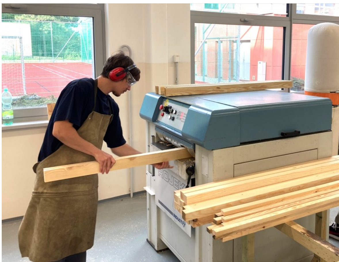
Foto: Výuka v nových truhlářských dílnách v prostorech kampusu