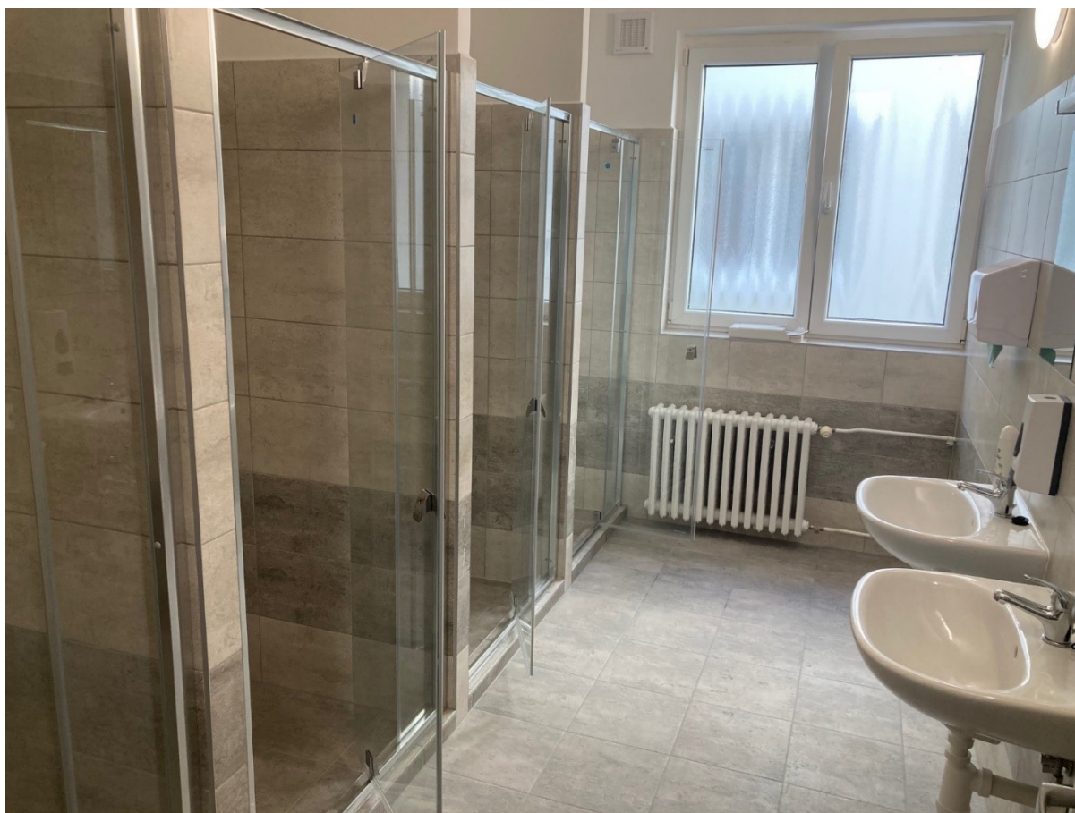
Foto: Nově zrekonstruovaná sociální zařízení na domově mládeže.

Vychovatelky a vychovatelé domova mládeže mají odbornou pedagogickou kvalifikaci nebo si jí průběžně doplňují. Jsou také povinni vést pedagogickou dokumentaci.