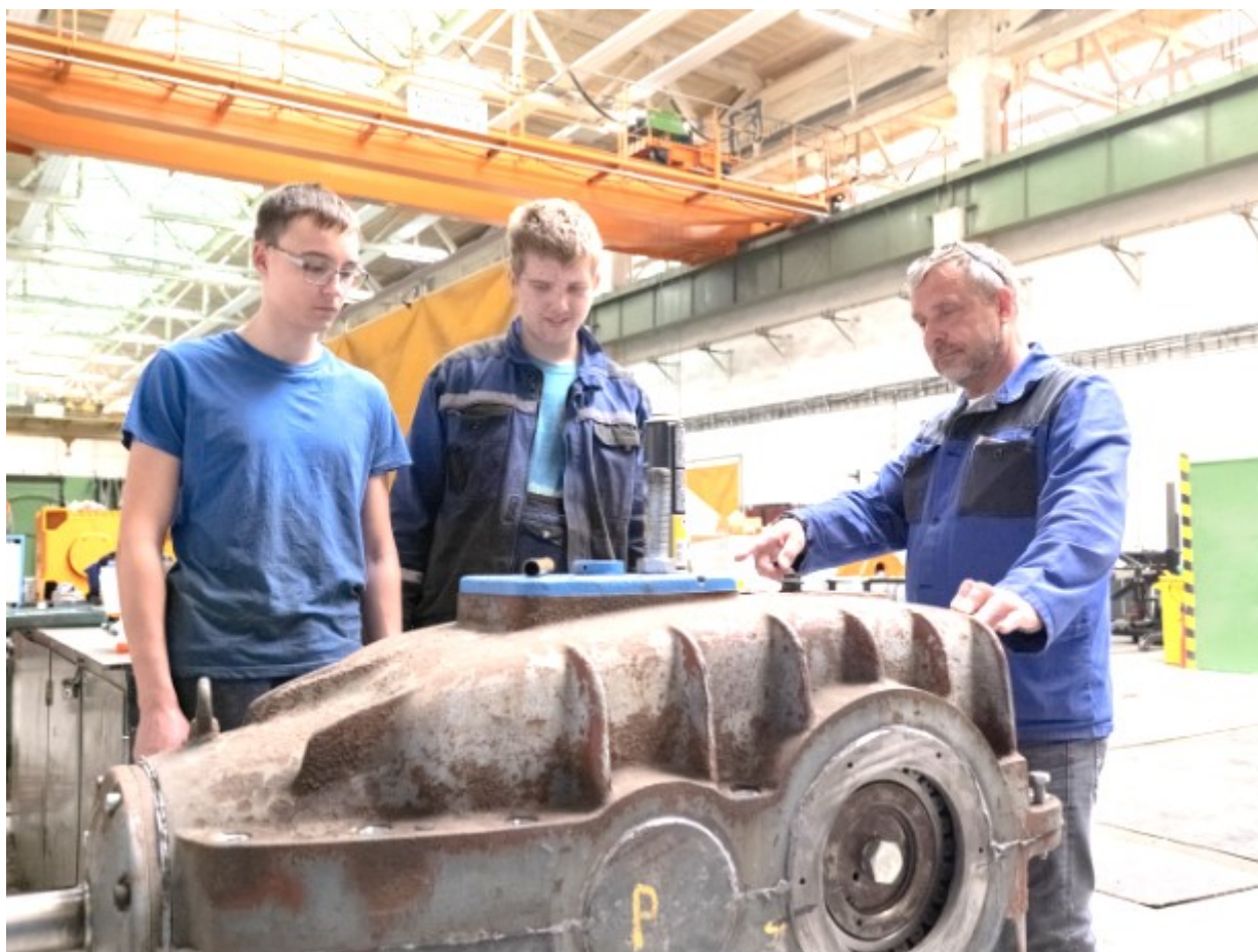
Foto: Individuální odborná praxe žáků ve firmě Prodeco

Pro plnění školního vzdělávacího programu (ŠVP) byly vytvořeny dostatečné materiální podmínky jak ve školních dílnách, tak na dalších pracovištích. Individuální výuka realizovaná v reálných provozech firem probíhala na základě smluv, které škola uzavírala s vybranými organizacemi. Žáci jsou vybavováni ochrannými pomůckami, pracovními oděvy a pracovní obuví. Naplnění ŠVP bylo řádně plněno a kontrolováno pedagogickými pracovníky a vedoucími učiteli Střední školy stavební a strojní, Teplice, p. o.