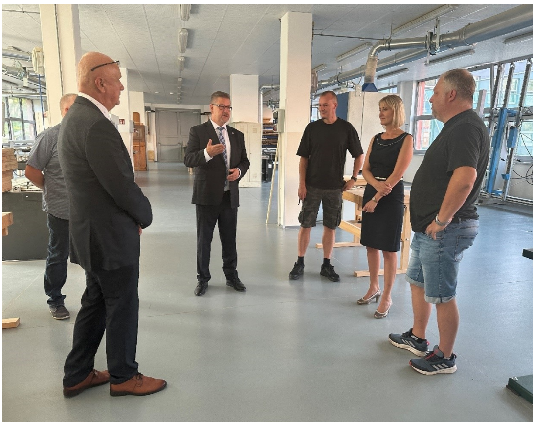
Foto: Návštěva hejtmana Ústeckého kraje Ing. Jana Schillera v nových truhlářských dílnách

Rozvoj školy – byla dokončena výstavba a vybavení nových objektů školy v Teplicích, a tím byl vytvořen kampus pro učňovské vzdělávání. Ve školním roce 2023/2024 probíhala výuka v nových autodílnách určených pro automechaniky a autoelektrikáře a v nových dílnách truhlářů a karosářů v plném rozsahu. Tyto změny umožnily vést výuku ve zcela moderně vybavených učebnách. Postupně se uvádělo do provozu ještě další doplňkové vnitřní vybavení jako lakovna či odsávací zařízení pro truhlářské stroje. Současně s tím se prováděla rekonstrukce zázemí dalších dílen – čalounické, zahradnické a instalátérské dílny.