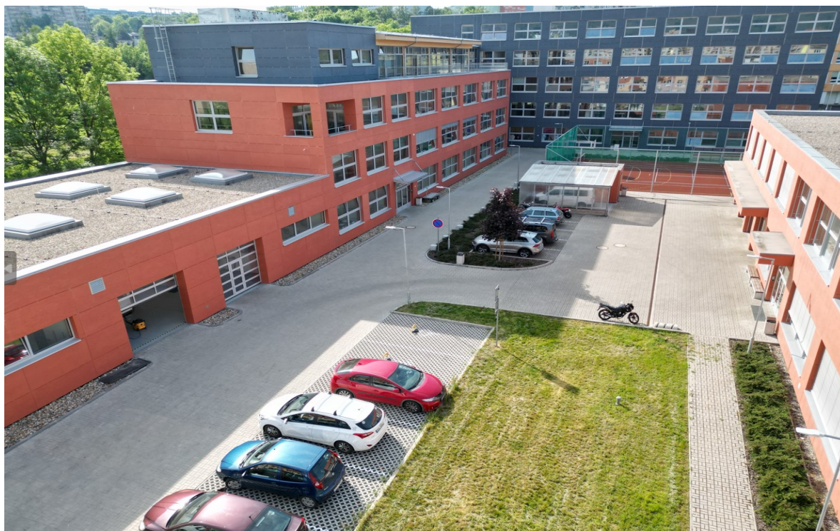
Foto: Pohled do prostoru kampusu