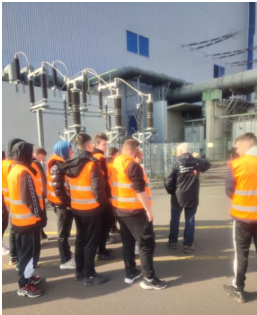
Foto: Žáci naší školy na exkurzi v Elektrárně Ledvice.

Škola uzavřela i pro tento školní rok smlouvu o spolupráci s firmou ČEZ, a tím se stala Partnerskou školou firmy ČEZ. Díky tomu obdrží dotaci ve výši 150 tis. Kč na nákup výukových prostředků pro elektro obory. Mimoto se žáci zúčastnili soutěže Energetická maturita, exkurze do elektrárny či proběhly přednášky za účasti odborníka z firmy ČEZ.