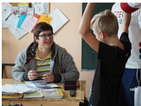
Projekt Paralympijská výzva