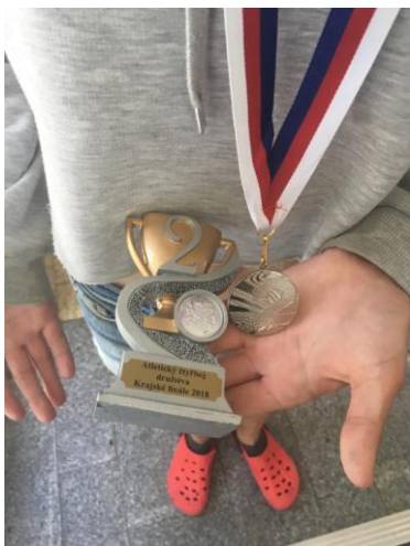
Medaile z krajského kola Atletického čtyřboje