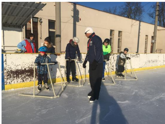
Bruslení s trenérem