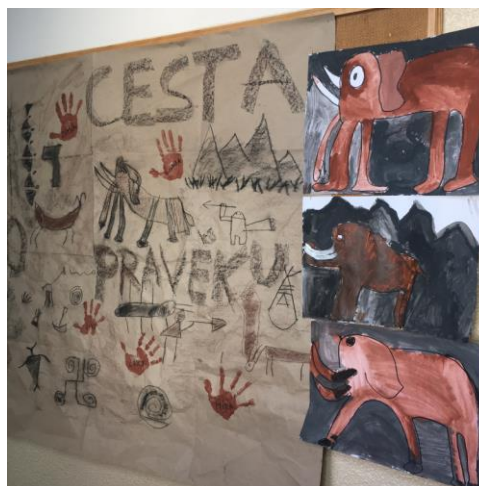
Cesta do pravěku