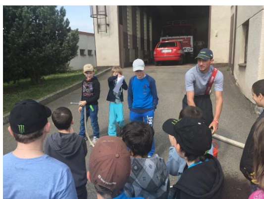
Den otevřených dveří HZS Dobříš