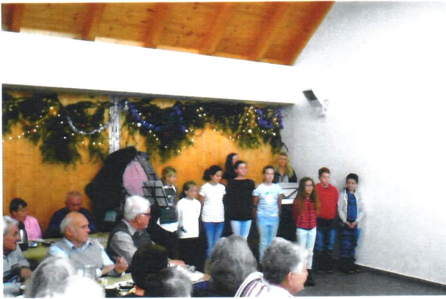
VÁNOČNÍ VYSTOUPENÍ PRO SENIORY