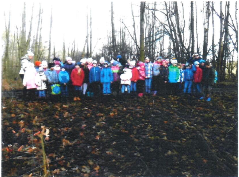
VÁNOČNÍ NADÍLKA PRO LESNÍ ZVÍŘÁTKA