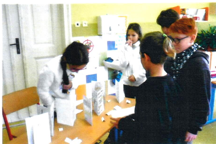
PROJEKTOVÁ VÝUKA AJ - BOOKSHOP