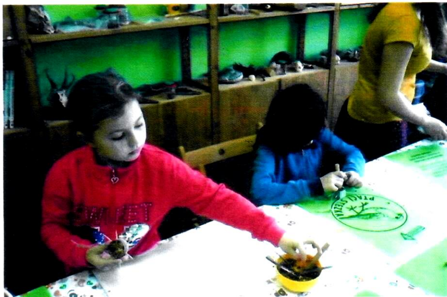
ECO CENTRUM STŘEVLÍK