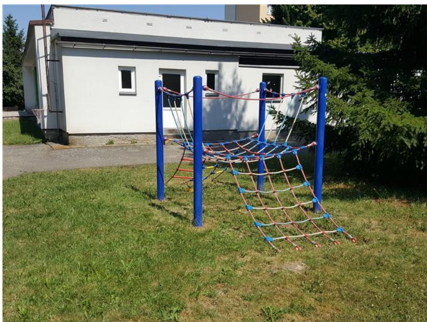
Pavouček a skluzavka