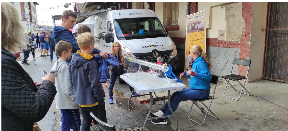
Maker Faire festival – Praha 2022.