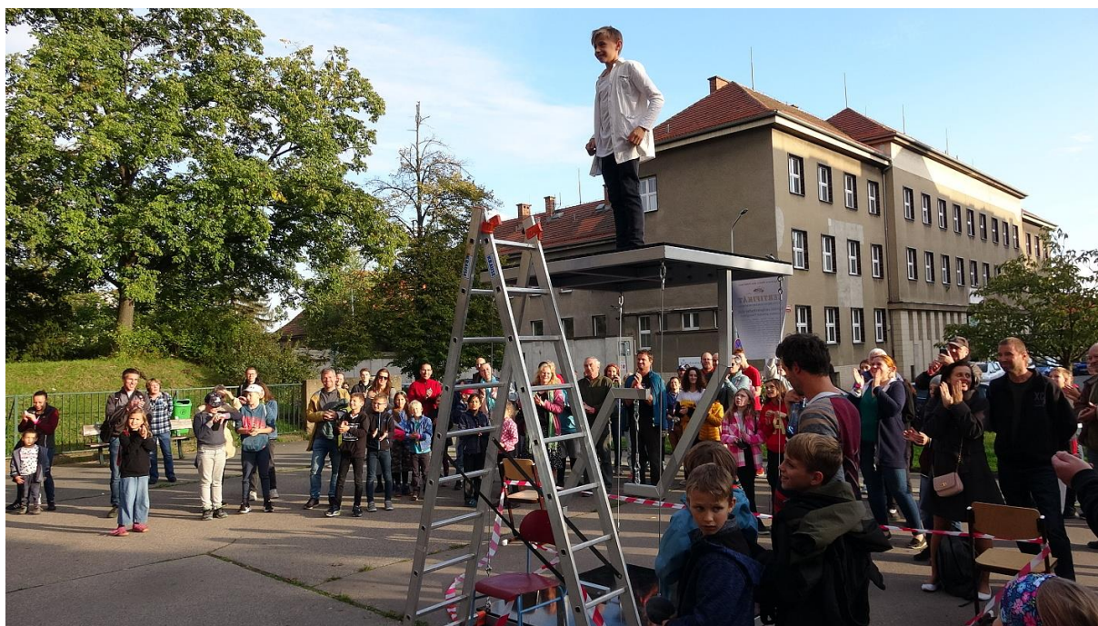
Noc vědců 2022 a zápis českého rekordu „Největší antigravitační stůl“.

Za Laborky.cz zapsal Martin Šturm (Krtek)