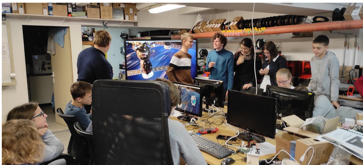
Příprava projektu s ISS.