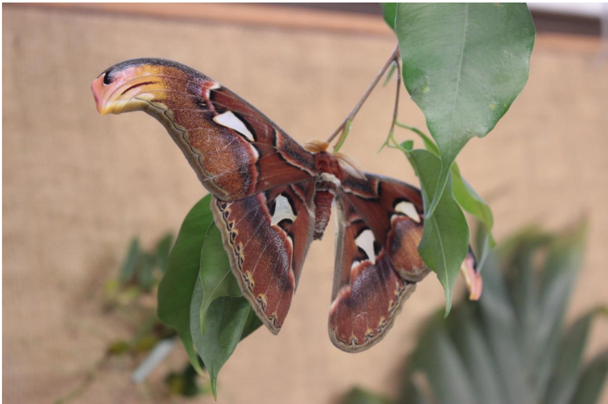
Attacus atlas – motýl s největší plochou křídel na světě v našem motýláriu