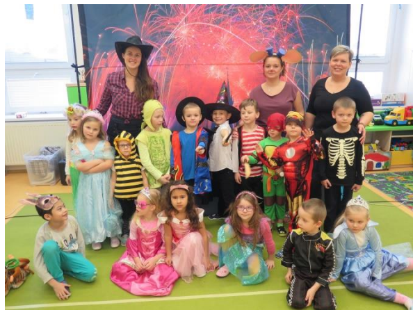
Karneval v MŠ