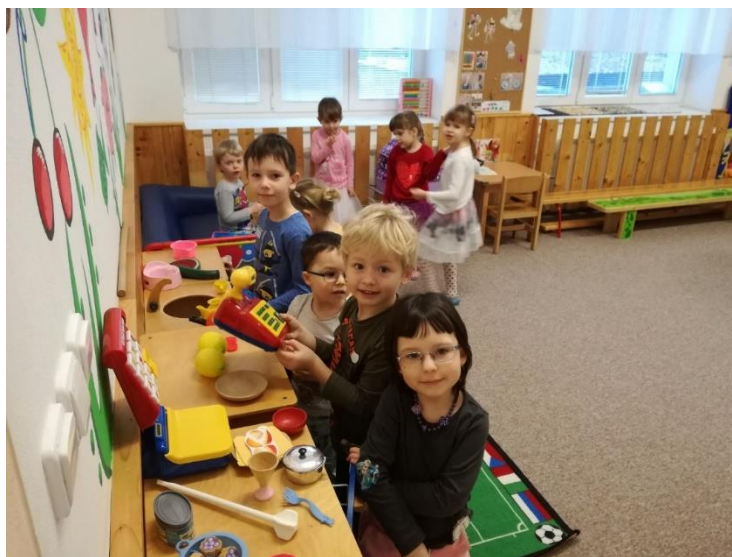
Hrajeme si každý den