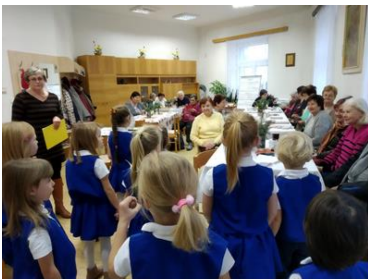
Na návštěvě v domově důchodců