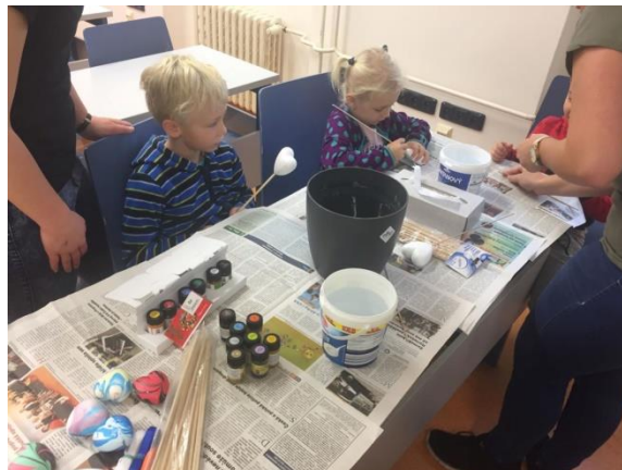
Návštěva Pedagogické fakulty UP v Olomouci – předškoláci – MŠ Řezníčkova