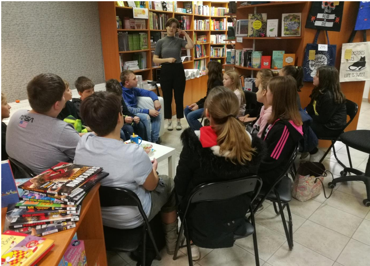
Návštěva v Megabooks