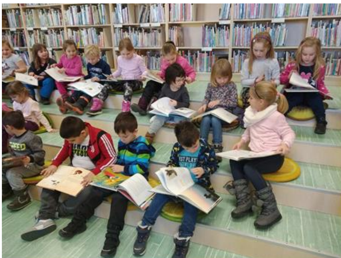
Na návštěvě v knihovně