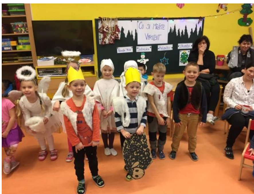
Vánoce v MŠ