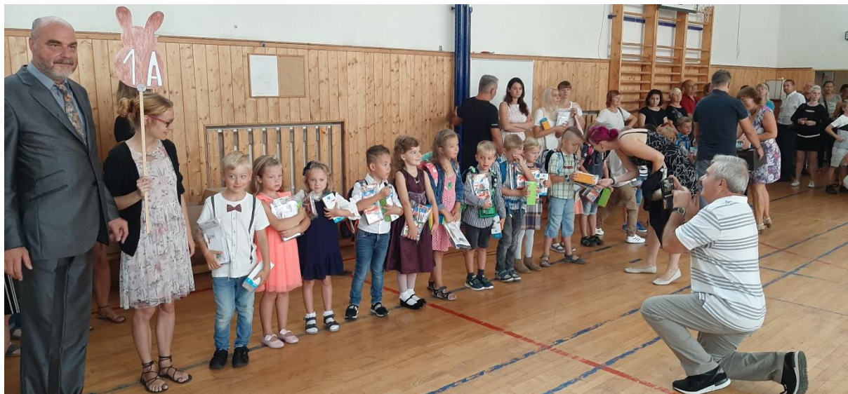
Začátek školního roku