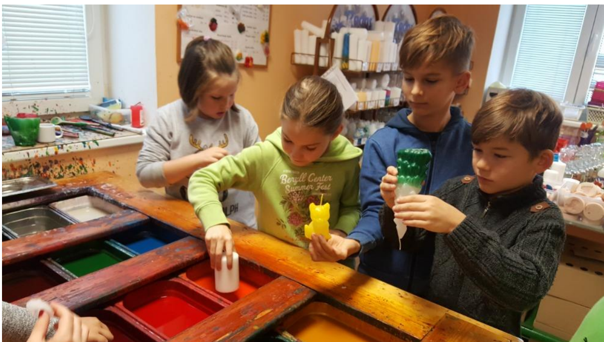
Na návštěvě ve svíčkárně