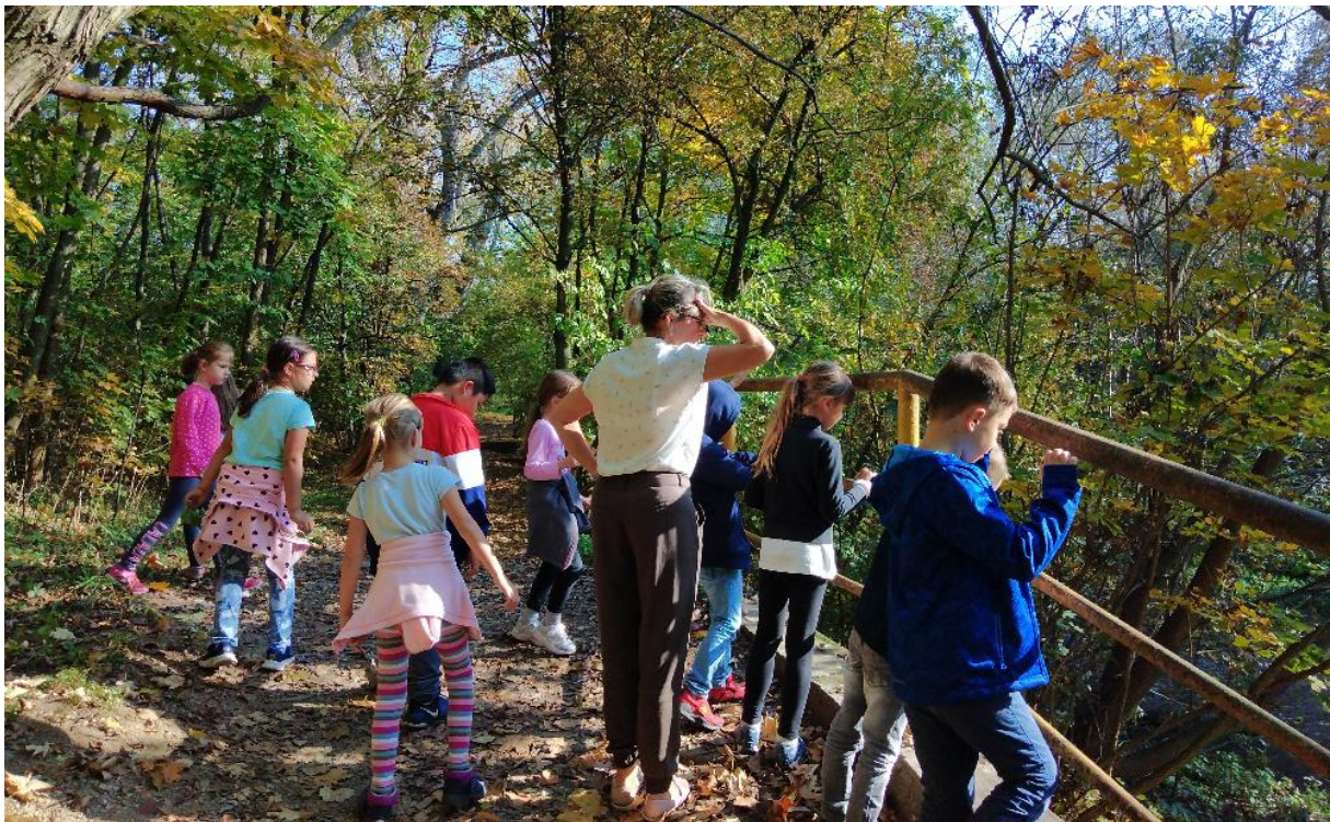
Procházka kolem Bystřičky