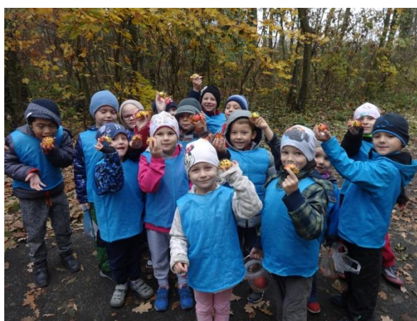
Uspávání broučků – MŠ Hodolanská a MŠ Řezníčkova