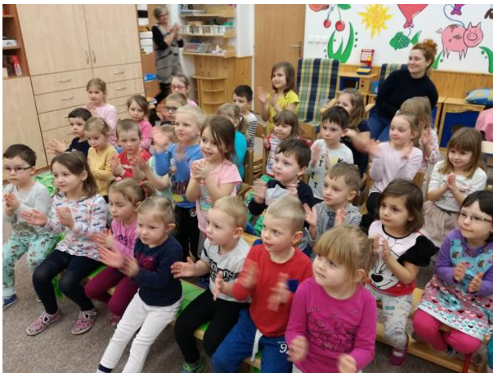
Vystoupení ve školce