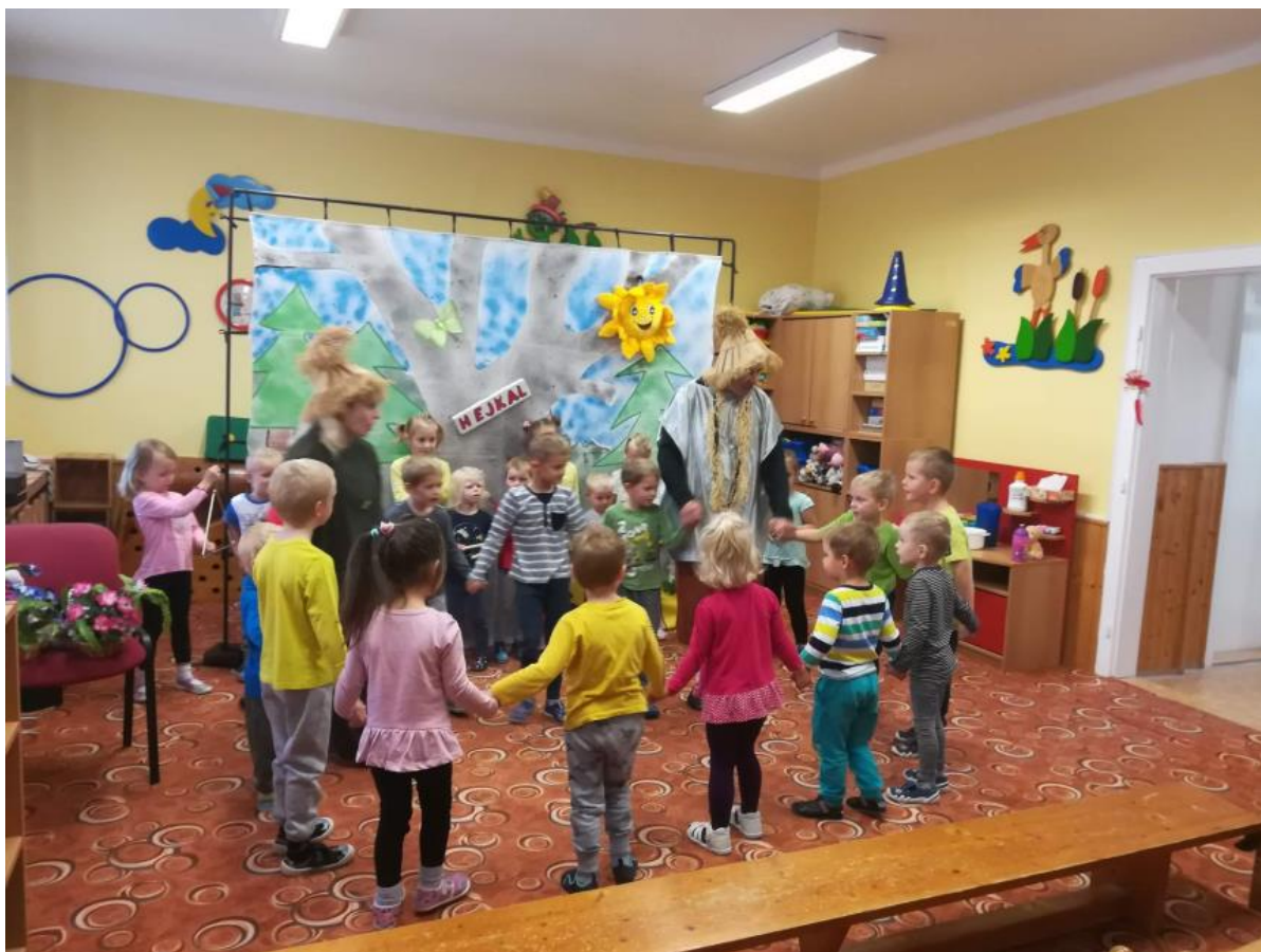
Pohádky z lesa