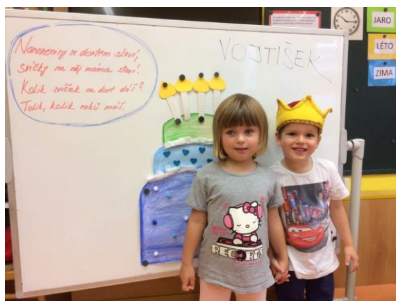
Stále se u nás něco děje