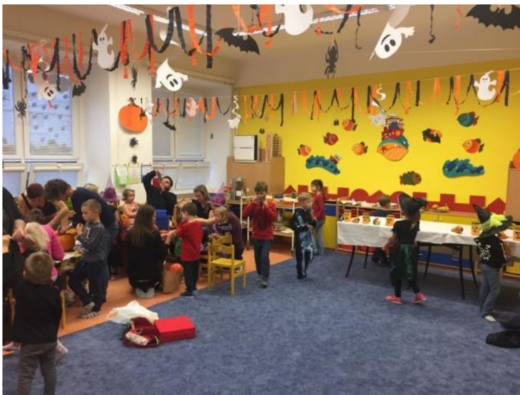
Hallowenské odpoledne v MŠ Hodolanské – setkání s rodiči