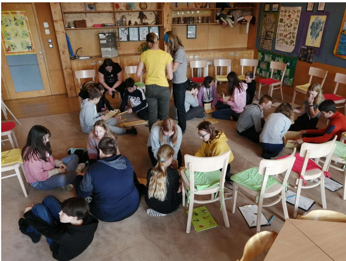
Okoprogram ve Sluňákově