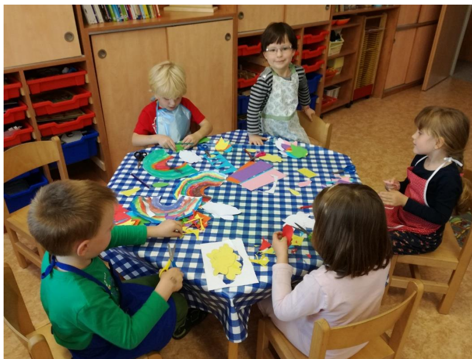
Tvoříme každý den