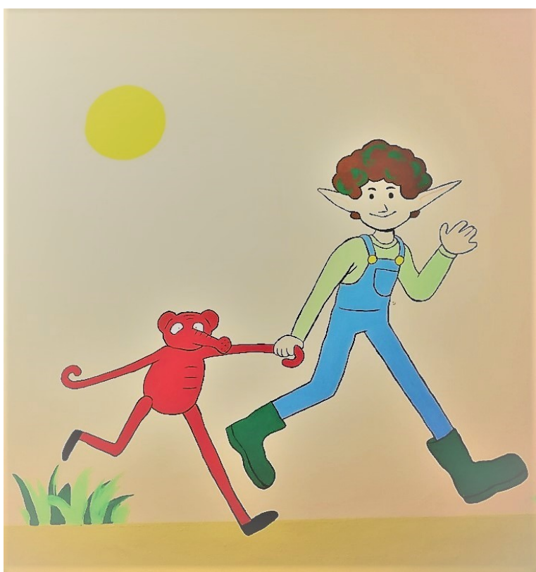
Obrázek 5: Tydýt a skřítek Kamarád

Mateřská škola vytváří podmínky pro adaptaci dítěte v souladu s jeho individuálními potřebami viz. příloha Adaptační plán a příloha Postava Tydýta.