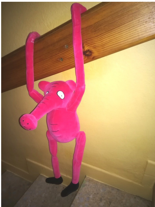
Obrázek 6: Tydýt