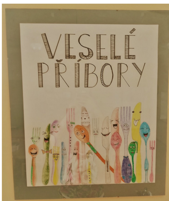
Obrázek 4: Veselé příbory