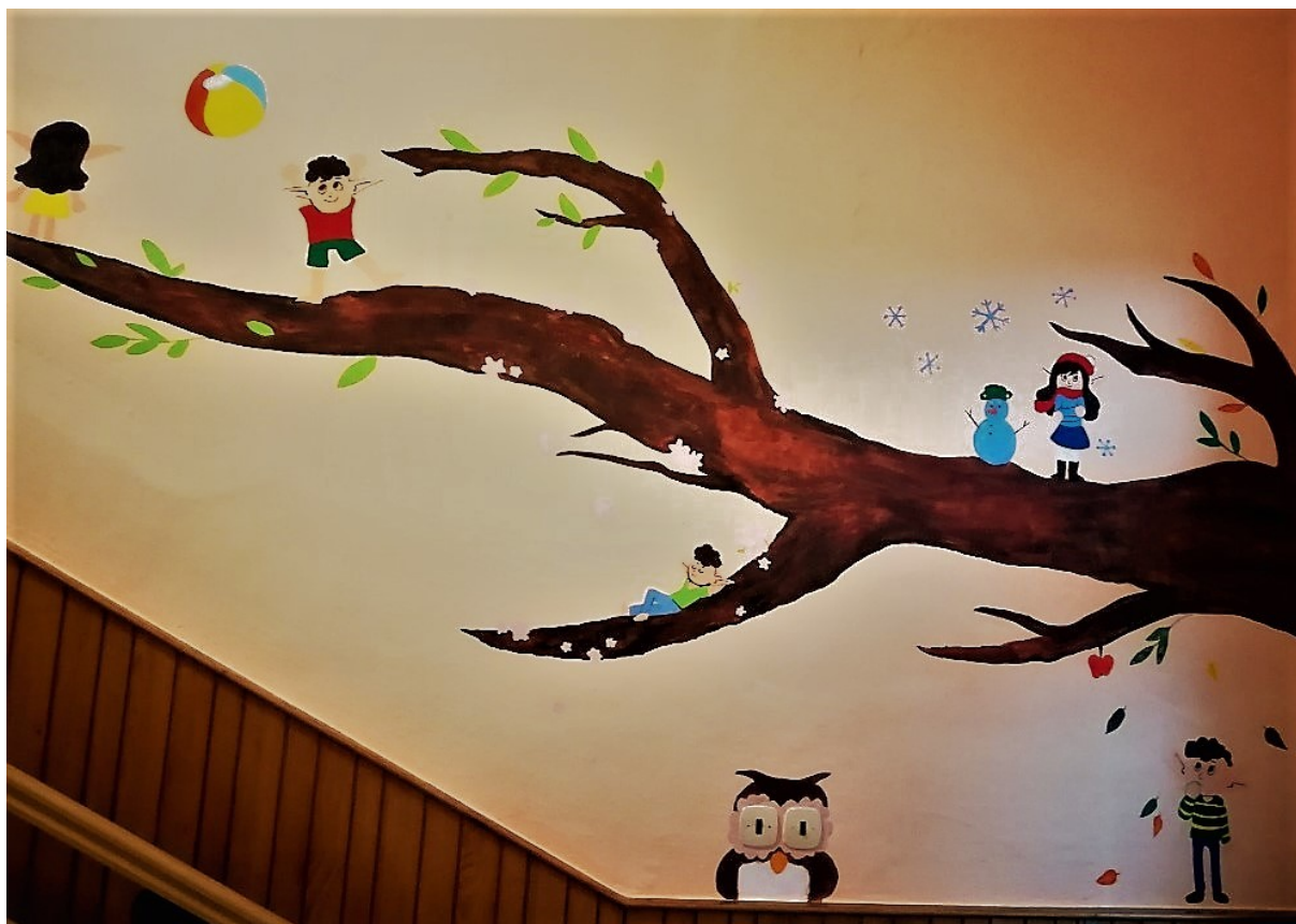
Obrázek 7: Skřítky provázející ročními obdobími