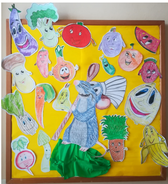
Obrázek 3: myšák Kuchtik

Jídelníček je sestavován tak, aby odpovídal zásadám správné výživy, aby uspokojil nároky dětského organismu, který roste a vyvíjí se. Snažíme se, aby byla strava vyvážená a zdravá, ale také aby dětem jídlo chutnalo. V jídelníčku máme dostatečně zastoupeny mléčné výrobky, luštěniny, ryby. Zařazujeme i cereální pečivo.