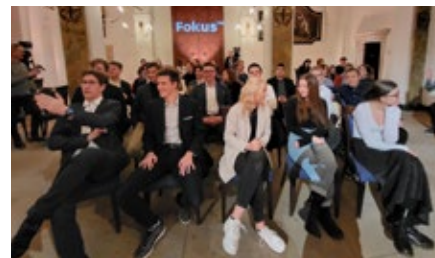
Studenti naší školy se 8. prosince 2022 zúčastnili natáčení pořadu Fokus Václava Moravce v kostele sv. Šimona a Judy v Praze. Tento díl s názvem Víra a naděje byl vysílán 7. dubna 2023.