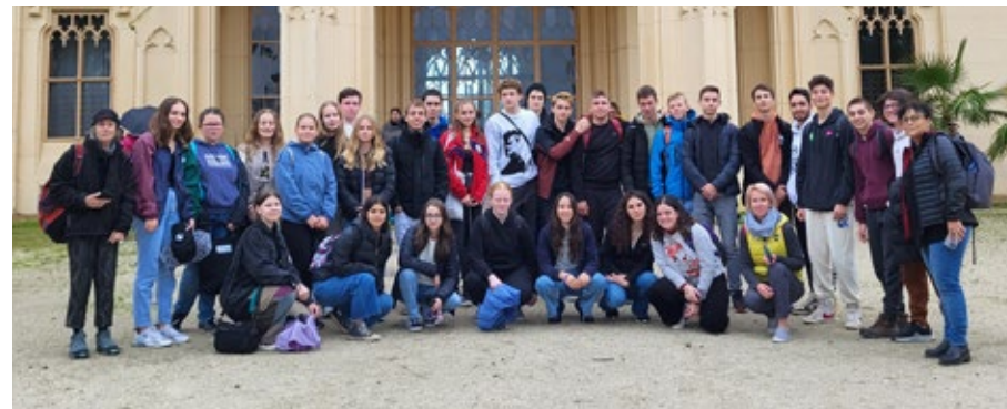
Studenti kvinty se svými hosty, studenty z Izraele, na výletě v Lednici.

Patnáct lidí z naší třídy se rozhodlo zúčastnit se výměnného pobytu s partnerskou školou HaKfar HaYarok, a tak jsme se ve středu 12. 10. v jedenáct večer po prvních virtuálních kontaktech poprvé naživo viděli se svými hosty, studenty z Izraele.