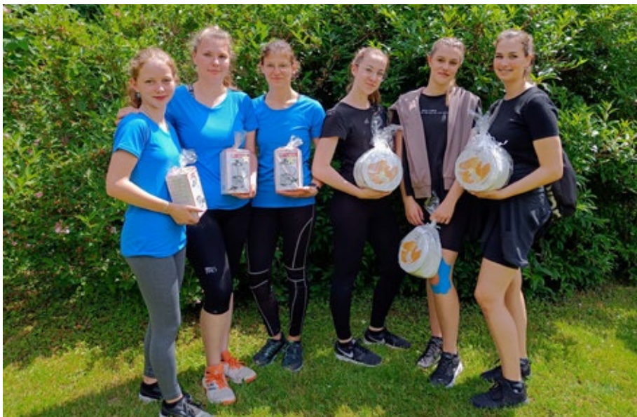
Dva soutěžní týmy reprezentovaly naši školu na 2. ročníku krajského kola soutěže v první pomoci v Brně dne 15. června 2023.