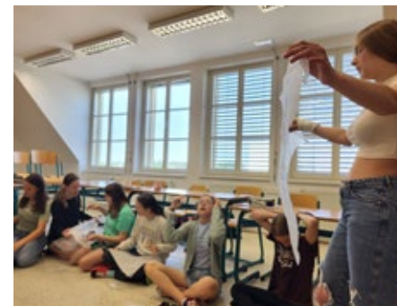
Žáci sekundy se v rámci hodin občanské výchovy seznamovali s různými krizovými situacemi a učili se základy první pomoci. Názorné ukázky jim v těchto lekcích předváděli studenti oboru Praktická sestra.

Dne 25. května 2023 se naši studenti zúčastnili v roli pomocných rozhodčích oblastní soutěže hlídek mladých zdravotníků , kterou pořádal Český červený kříž Hodonín v Lužicích. Studentům 2. ročníku oboru Praktická