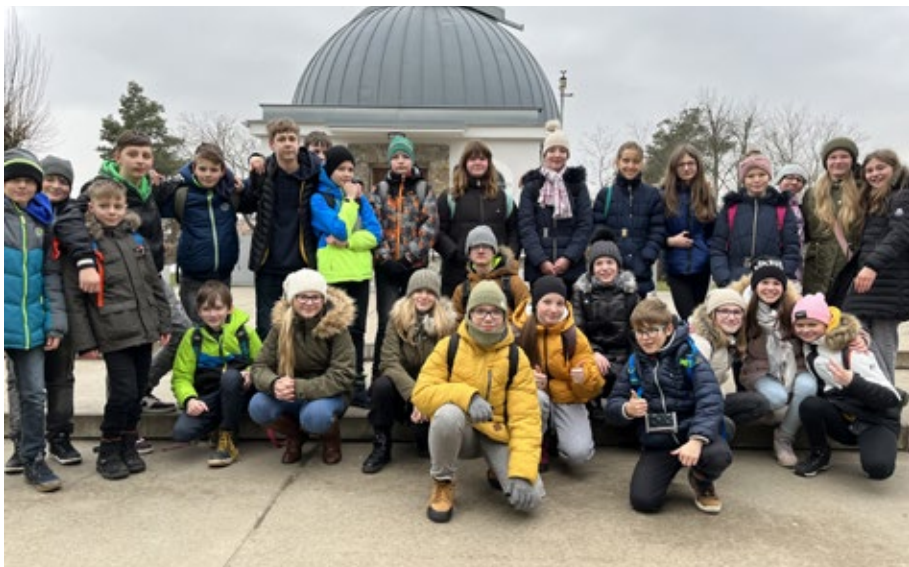
Dne 27. ledna 2023 vyrazila třída prima A do Hvězdárny a planetária Brno. Žáci zhlédli představení Hvězdňý cirkus o historii vesmíru a vyzkoušeli si přístroje před planetáriem.