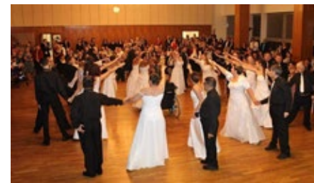
Studenti naší školy tancují na reprezentačním plese Domova Horizont, který se v kyjovském kulturním domě konal 21. ledna 2023.