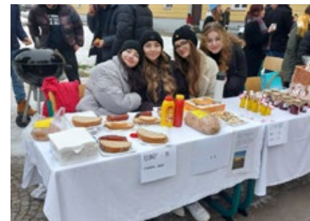
Stánek třídy 1.A na tradičním vánočním charitativním jarmarku před budovou školy.

Nelze než vyjádřit vděk a uznání všem zúčastněným, protože díky ochotě studentů připravit výrobky a díky kupujícím, kteří podpořili charitativní jarmark, jsme letos mohli na dobročinné účely předat 153 910 Kč . Naši studenti věnovali vybrané prostředky neziskovým organizacím a jedincům v nouzi, jako například Azylovému domu pro matky s dětmi v Kyjově, Hipoterapii v CVC Kostice, onkologickému oddělení Dětské