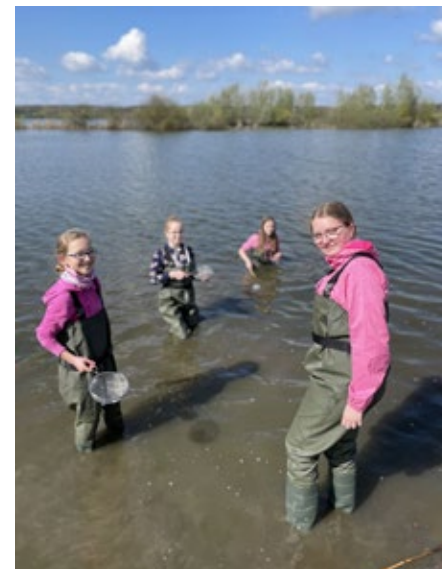
Terénní cvičení ze zoologie pro třídu sekundu A se konalo dne 25. dubna 2023 v nově vznikajícím ptačím parku v Dubňanech.