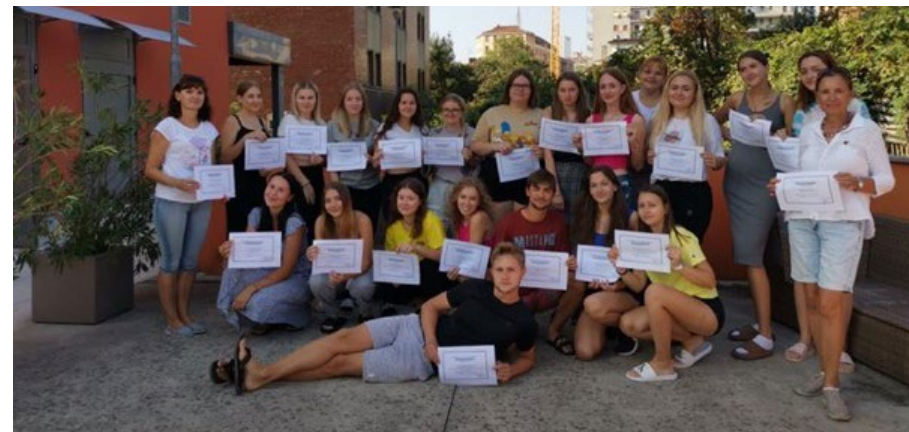
Vybraní studenti 3. a 4. ročníků oboru Praktická sestra se zúčastnili v rámci projektu Erasmus + 14denního pobytu v Itálii.

V tomto školním roce se dvě skupiny po dvaceti vybraných studentech 3. a 4. ročníků oboru Praktická sestra zúčastnily v rámci projektu Erasmus + 14denního pobytu v Itálii.