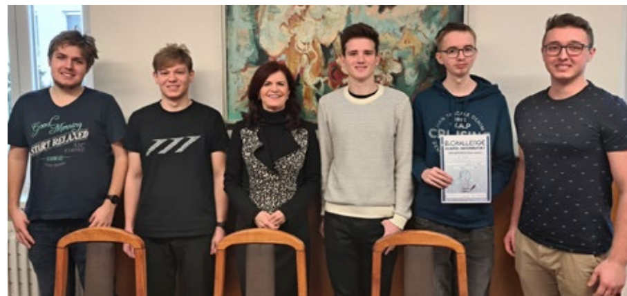
Účastníci krajského kola Bobříka informatiky s paní ředitelkou.

V listopadu jsme se v rámci semináře z výpočetní techniky zúčastnili školního kola soutěže Bobřík informatiky v kategorii senior.