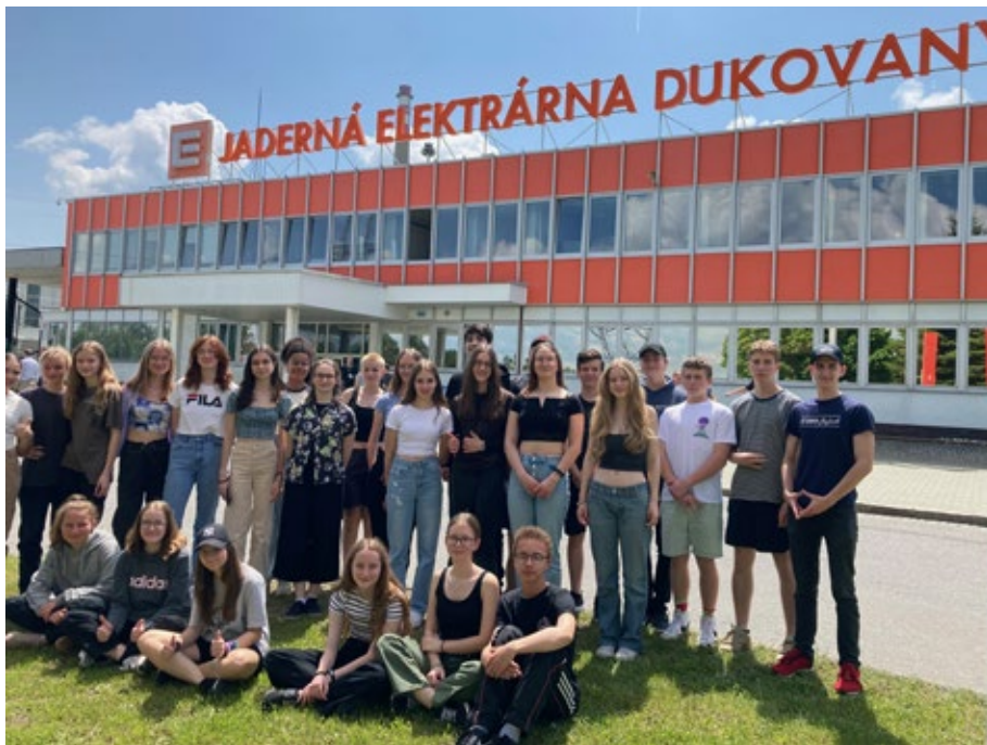
Dne 22. května 2023 vyjela kvarta na exkurzi do jaderné elektrárny Dukovany a do přečerpávací elektrárny Dalešice. Do reaktoru se žáci mohli podívat díky technice virtuálních brýlí, ale ve vodní elektrárně od turbíny stáli jen pár centimetrů.

Dne 24. května 2023 dopoledne Klvaňovo gymnázium uspořádalo okresní kolo fyzikální olympiády kategorie G, tzv. Archimediádu (7. ročník; sekundy), pro žáky základních škol a víceletých gymnázií okresu Hodonín.