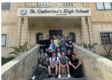
Naši studenti před školou St. Catherine's High School v Pembroke na Maltě.