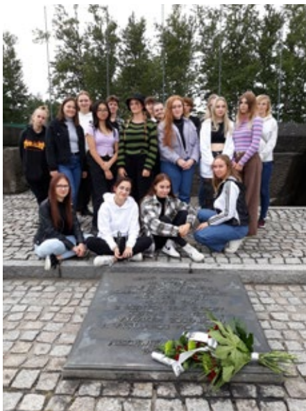
Studentky třetího ročníku oboru Praktická sestra v Památníku obětí holocaustu v Osvětimi dne 14. září 2023.

Vyučování dne 2. září 2022 zahájili nově nastupující studenti a studentky oboru Praktická sestra dvěma třídnickými hodinami, poté pokračovala výuka podle řádného rozvrhu stejně jako u studentů 2. a 3. ročníku.