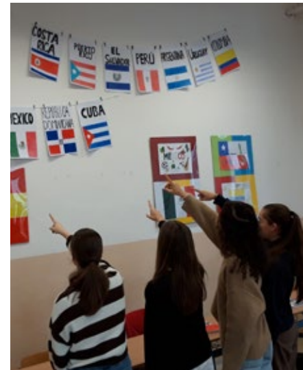
Studenti tercie si v rámci hodin španělštiny vyzdobili jazykovou učebnu.

Po prvním roce se španělštinou se mnozí studenti těší na dovolenou do Španělska, kde své získané znalosti zdárně využijí a určitě i rozšíří. A já se těším, že se s námi o své letní zkušenosti v září podělí a doporučí nám nová