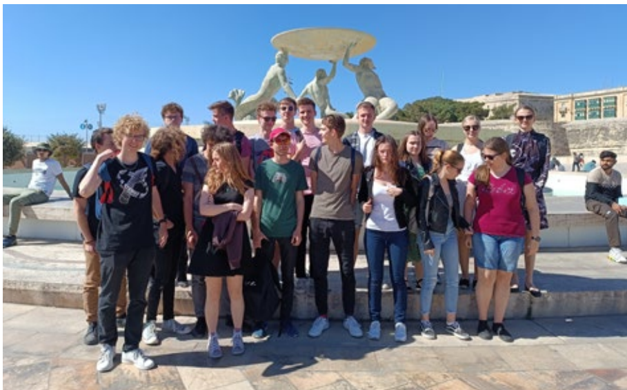
V rámci studijního pobytu na Maltě poznávali studenti i místní památky.