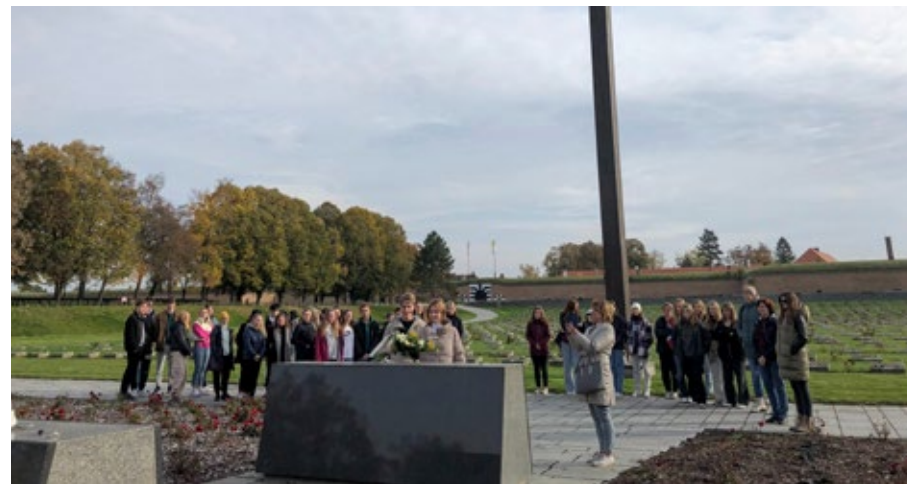
Studenti pokládají kytici na Národním hřbitově v Terezíně. Exkurze do Památníku Terezín se dne 21. října 2022 zúčastnili studenti kvarty, dějepisného semináře a zájemci z ostatních tříd.

Dne 16. listopadu 2022 odpoledne od 14:30 hodin proběhlo posezení členů profesor-