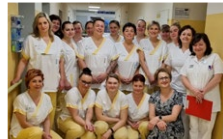
Účastnice akreditovaného kvalifikačního kurzu sanitář.

Na základě absolvování závěrečné zkoušky, která se koná před minimálně 3člennou zkušební komisí, obdrží absolvent Osvědčení o odborné způsobilosti k výkonu zdravot-