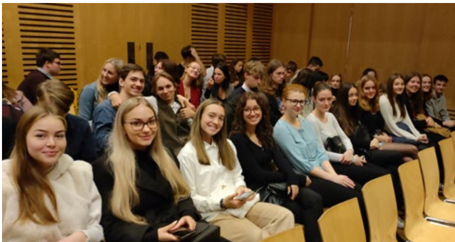
Studenti vyšších ročníků navštívili dne 17. října 2022 anglické divadelní představení v Brně.

Moravě. Poslední den účastníci strávili ve Vídni, odkud izraelští studenti spolu se svými dvěma učitelkami odlétali.