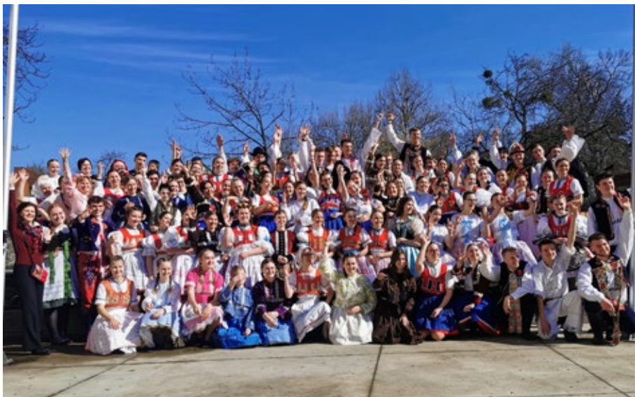
Ve středu 12. dubna 2023 proběhl Den v kroji.