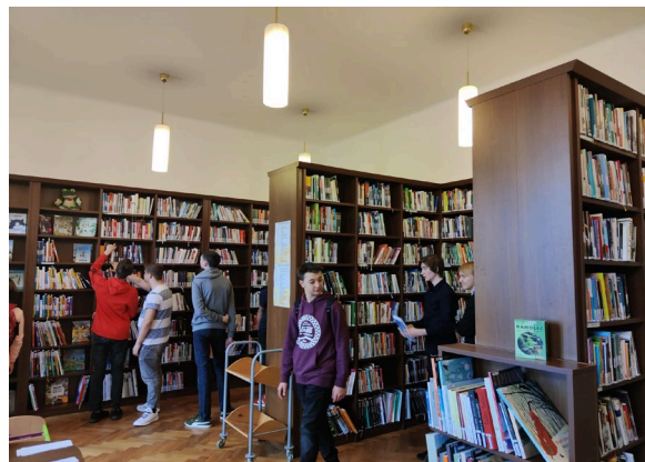
Návštěva SVK Kladno