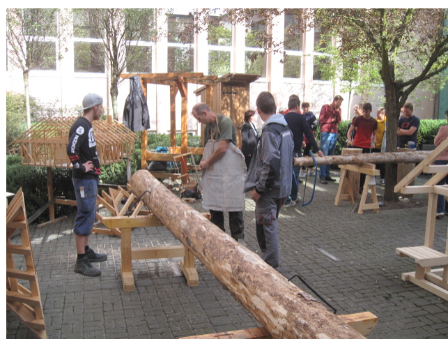
Prezentace technického vzdělávání v kladenském regionu 2019 – akce pořádaná OHK Kladno