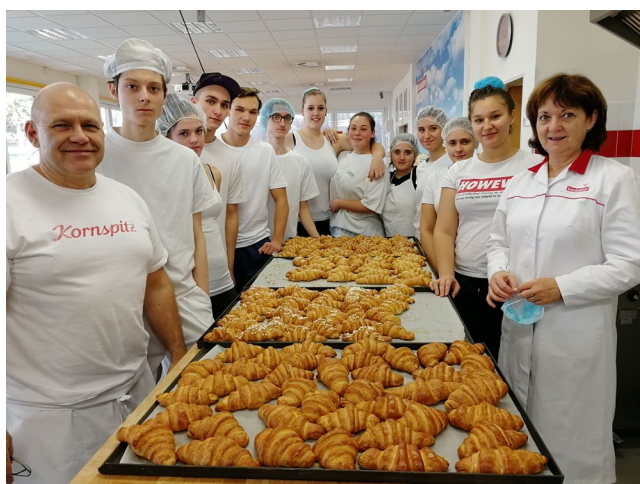
Exkurze do firmy Backaldrin