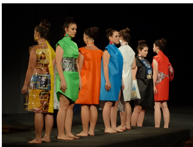
Účast žáků oboru Modelářství a návrhářství oděvů na soutěži Mladý módní tvůrce Jihlava