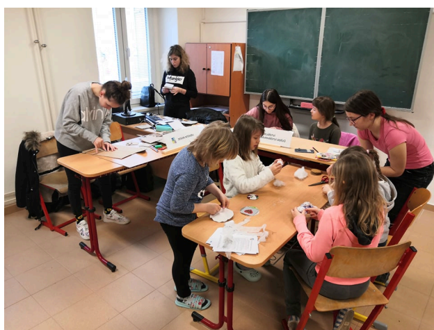
Den řemesel v 6. ZŠ Kladno