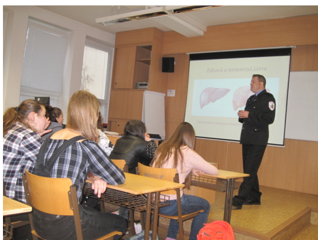
Přednáška zaměřená na primární prevenci