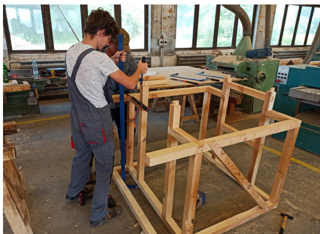
Praktické závěrečné zkoušky oboru Tesař