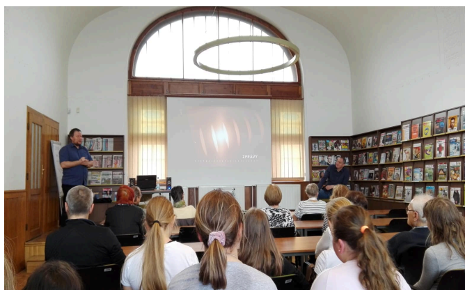
Mediální vzdělávací beseda v SVK Kladno