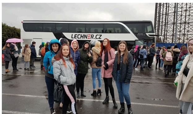
Školní zájezd do Londýna v prosinci 2019