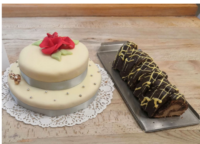
Praktické závěrečné zkoušky žáků oboru Cukrář