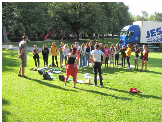
Adaptační kurz pro žáky 1. ročníků