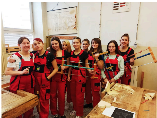
Praxe žáků Design interiéru (Ateliér designu)