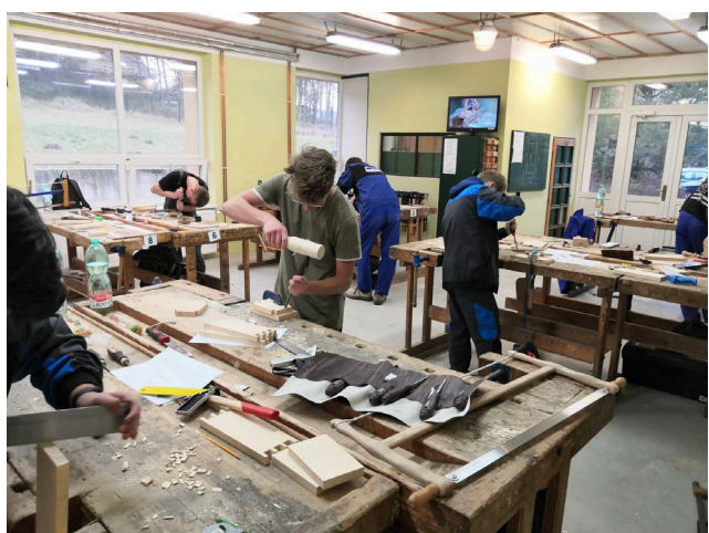
Soutěž Truhlář 2019