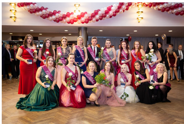
Absolventský a maturitní ples