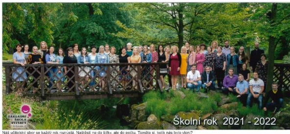
Školní rok 2021 - 2022

Vzhledem k absolutní vytíženosti všem našich výukových prostor jednáme s vedením Gymnázia a Obchodní akademie o zapůjčení dvou vzdělávacích prostor, kam bychom na říjen a listopad přestěhovali dvě vybrané třídy (2. a 3. třída). Ze zvažovaných scénářů se nám tento jeví jako pro žáky i jejich učitele nejvhodnější. Zvažovali jsme i variantu učit dočasně třídy, kde se mění okna, v tělocvičně, v jídelně nebo distančně, ale výše popsaná varianta bude pro vzdělávací proces žáků nejméně zatěžující. Dovolím si již teď poděkovat zákonným zástupcům 2. a 3. třídy za účast na schůzce, kde bude školou navrženo řešení a proběhne diskuze k tomuto tématu.