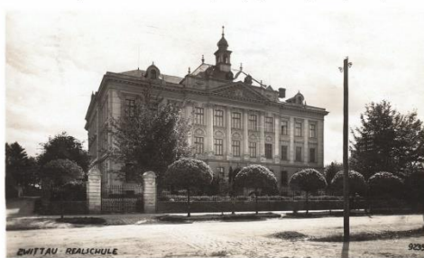
Základní škola Svitavy, T. G. Masaryka 27

V letáčkem rozeslaném rodičům je foto z nejstarších dochovaných fotografií je pevnou z nejstarších dochovaných fo