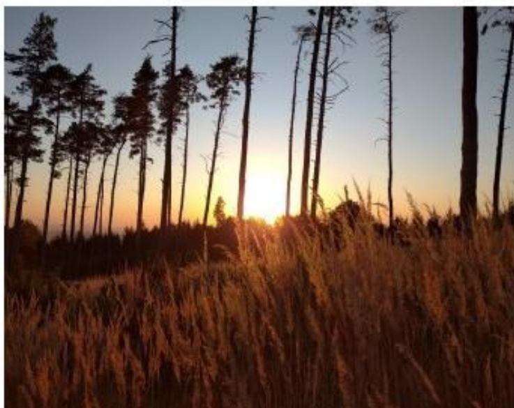
Snímky žáků oceněné ve fotosoutěži na téma Krása podzimní přírody