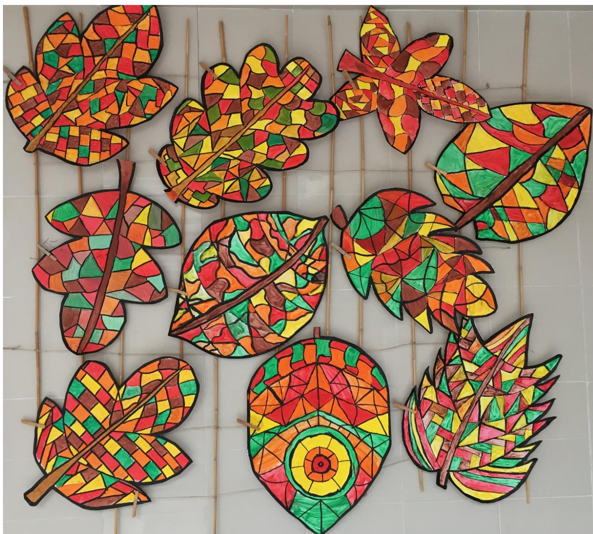
Výzdoba chodby ve 4 NP v nové budově – práce žáků II. stupně

Kroužky v projektu Učení je zábava (Šablony III) vedli pedagogové školy, pouze jeden vedl externí pracovník (Klub zábavné logiky a deskových her pro 1. stupeň)