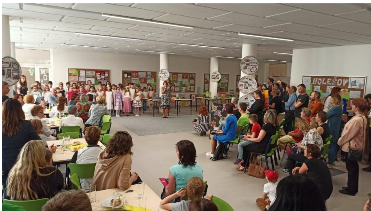
Slavnostní otevření atria spojené s výstavou k 700 letům založení města Holešov