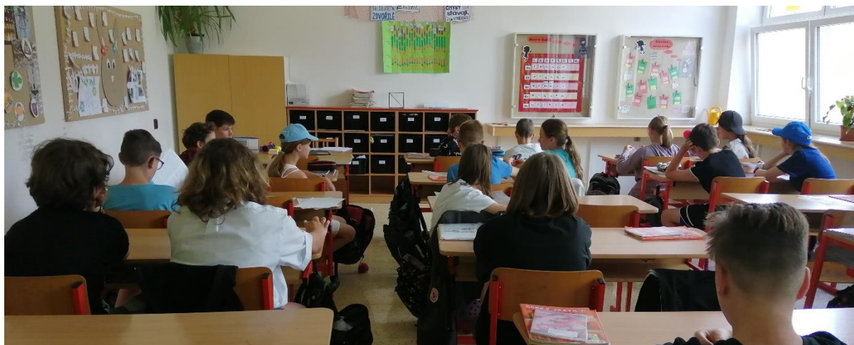
Den naruby – žáci jsou zády k tabuli během výuky

Ve všech ročnících základní školy byli žáci vzděláváni podle Školního vzdělávacího programu pro základní vzdělávání „Škola s širokou nabídkou“.