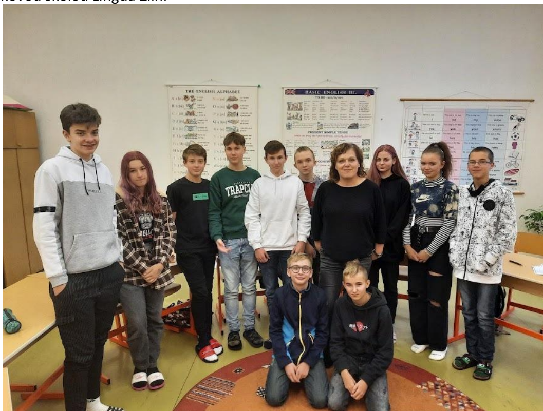
Žáci ze skupiny KET