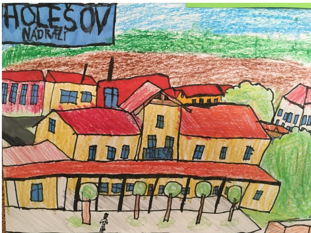
Práce žáka k vernisáži ve škole u příležitosti oslav 700 let města