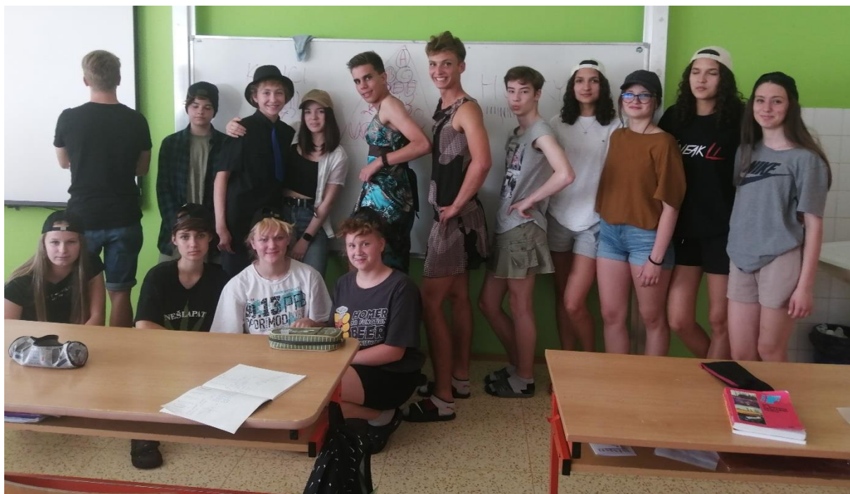
Den naruby v IX. C