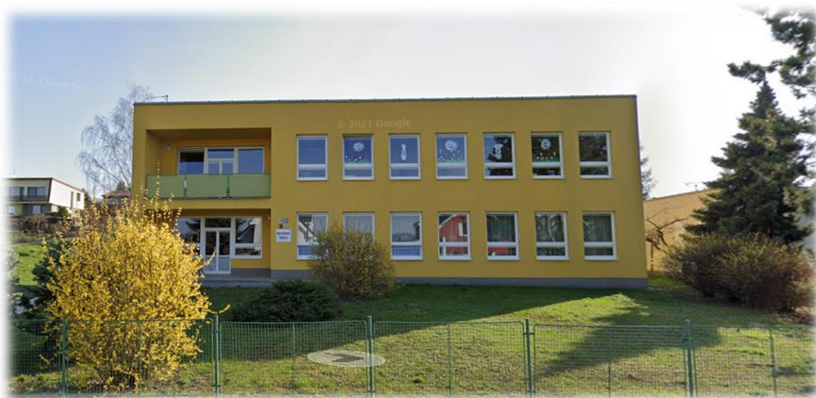
Místo poskytnutého vzdělávání Slunečná 2792