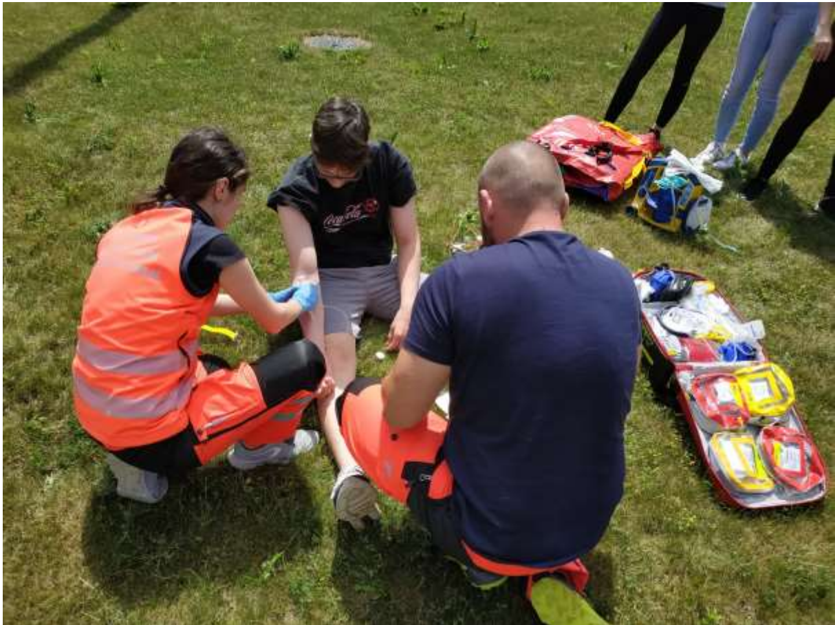
Zdravotnická záchranná služba