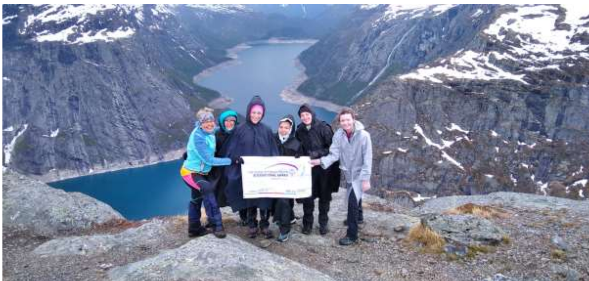
Zlatá DofE expedice v Norsku