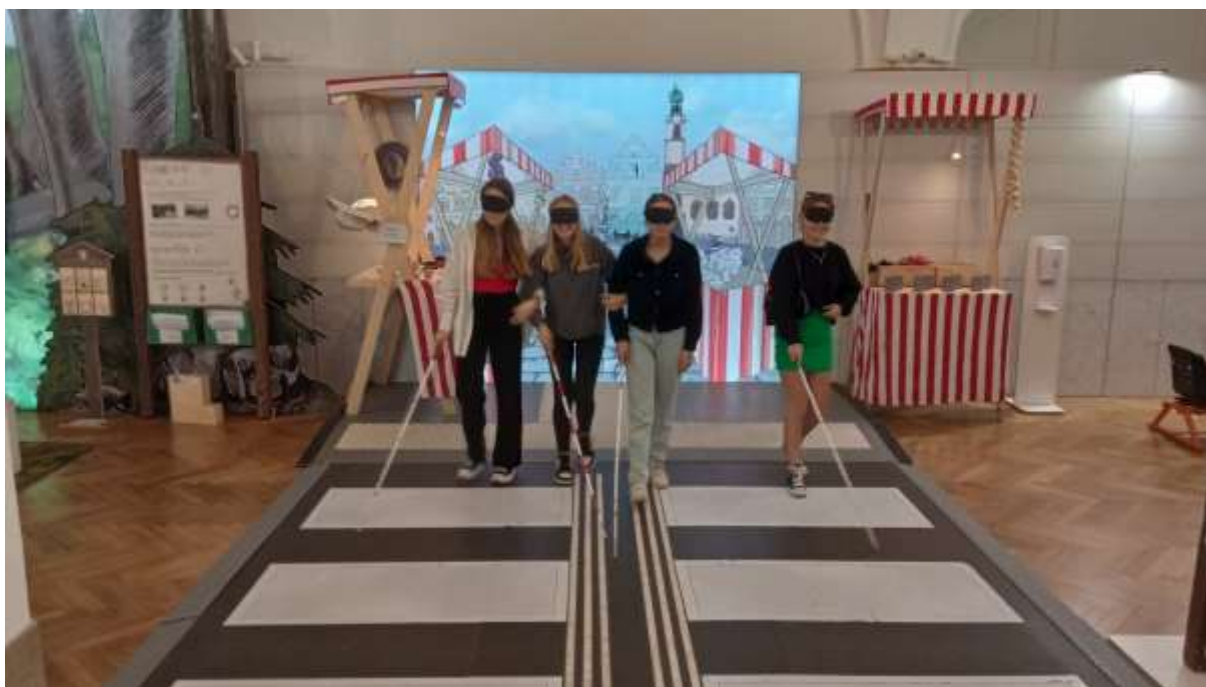
VČM - Lidé odvedle