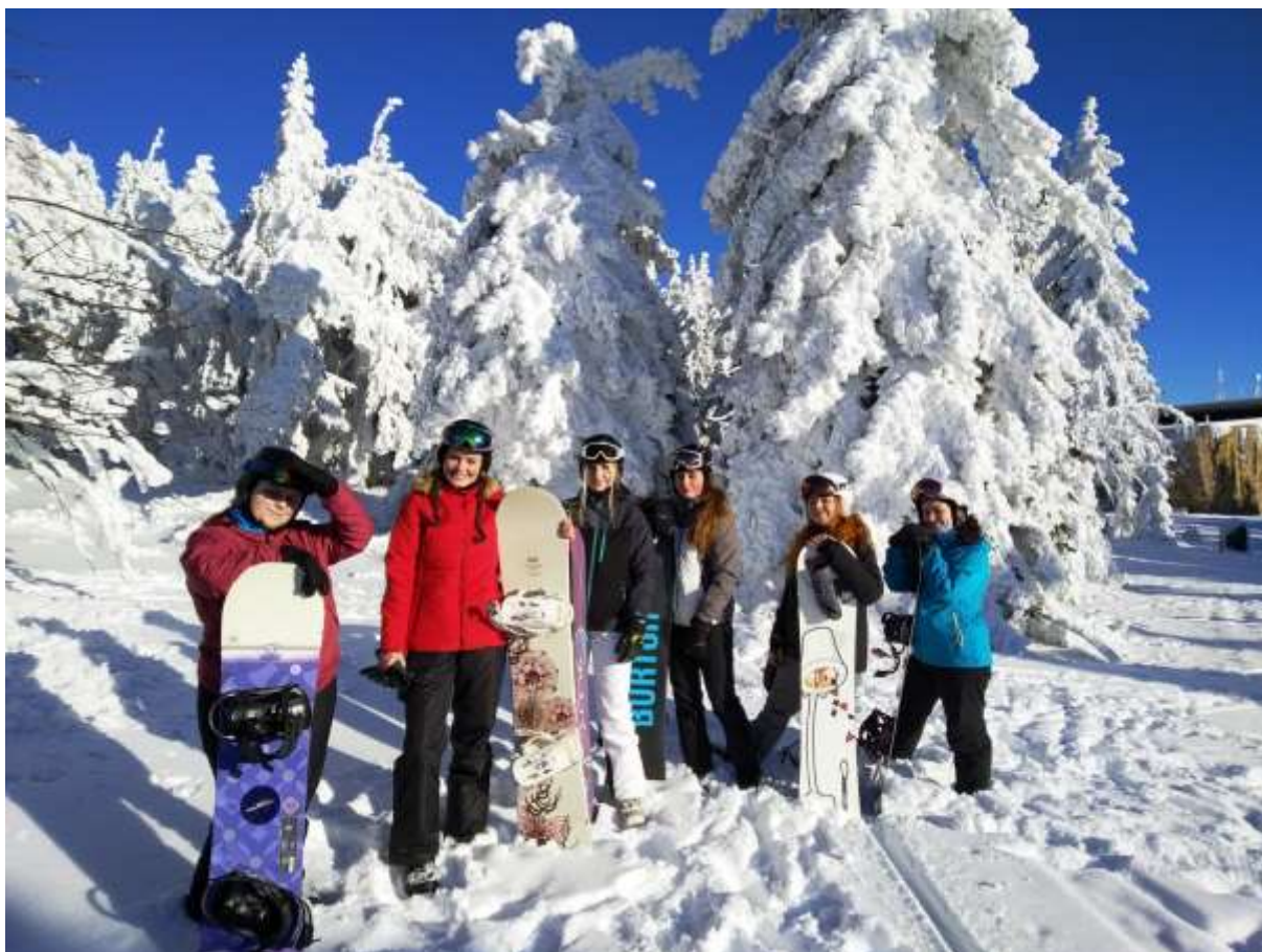
Lyžařský a snowboardový kurz