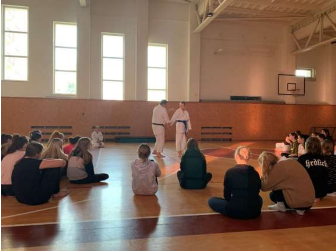
Základy sebeobrány na DM