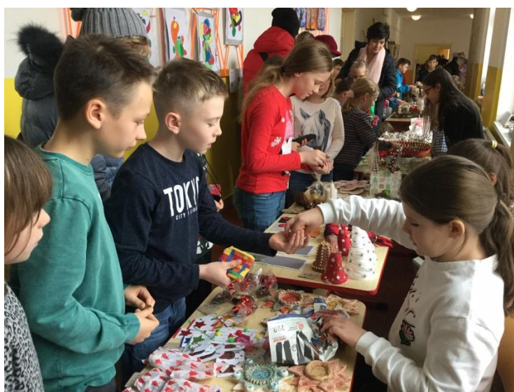
Školní vánoční jarmark