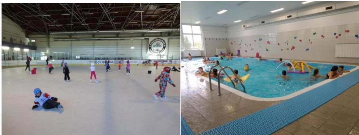
Kurz bruslení a plavání na 1.st.