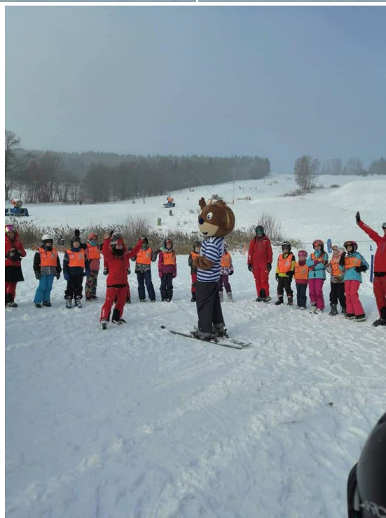
Lyžařský kurz 1.st.