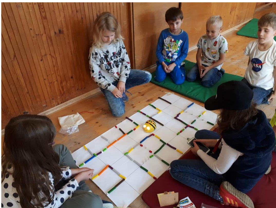
Týden programování na 1.st. – Code week