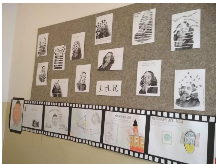
Přípravy na neuskutečněný den otevřených dveří