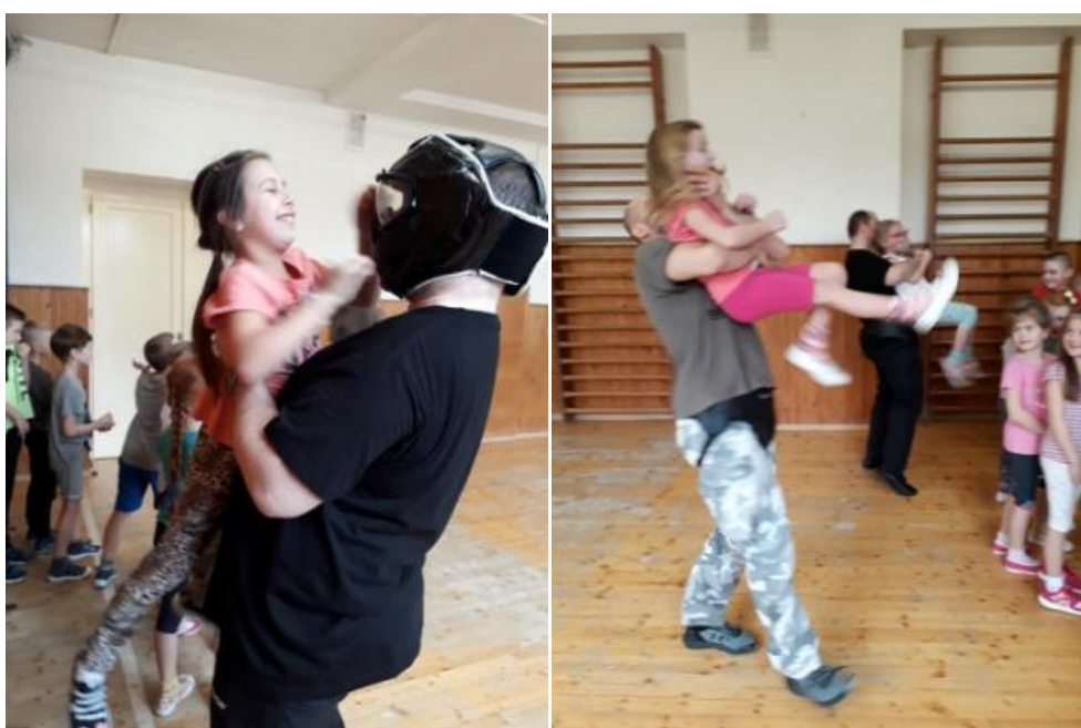
Kurz sebeobranu pro žáky 1. a 2. tříd