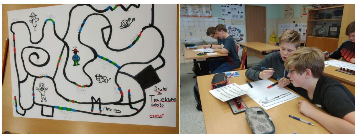
Práce s ozoboty v 7. roč. – rychlost rovnoměrného pohybu