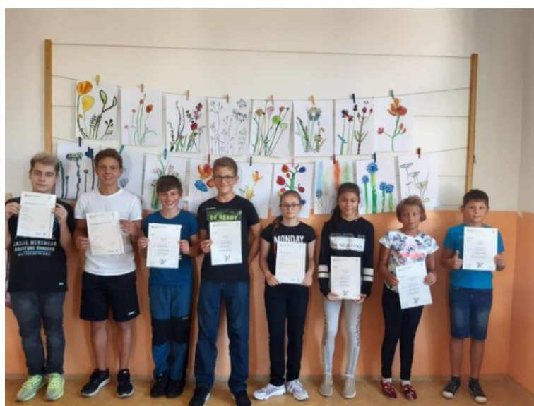
Již druhým rokem se naše škola pyšní statutem přípravného centra jazykových zkoušek Cambridge. Účastníkům byly předány certifikáty o úspěšném složení zkoušky.