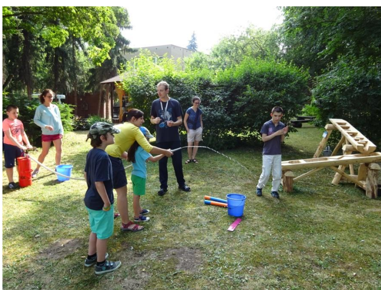
Sportovní dopoledne s Jitrem