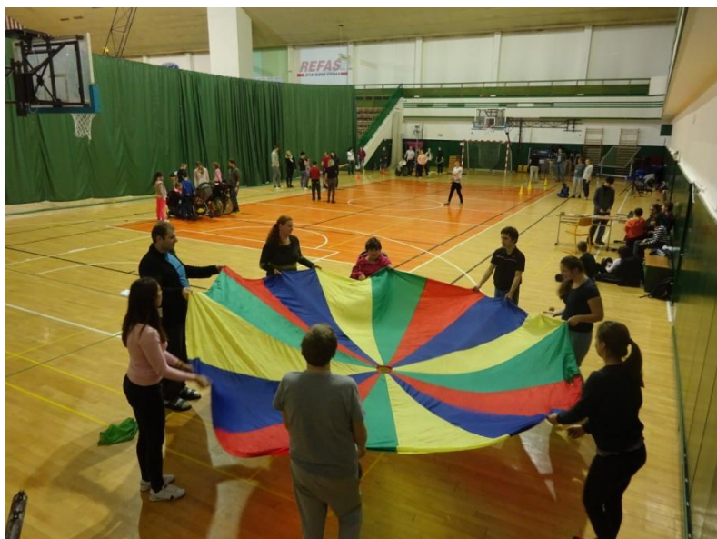
Mikuláš na Sportovní hale UP