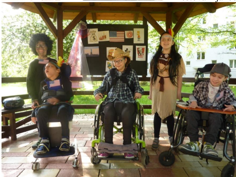
Natáčení filmu pro školní akademii