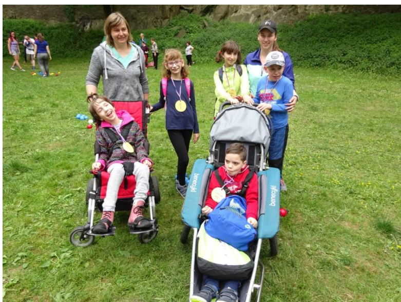
Sportovní dopoledne s APA