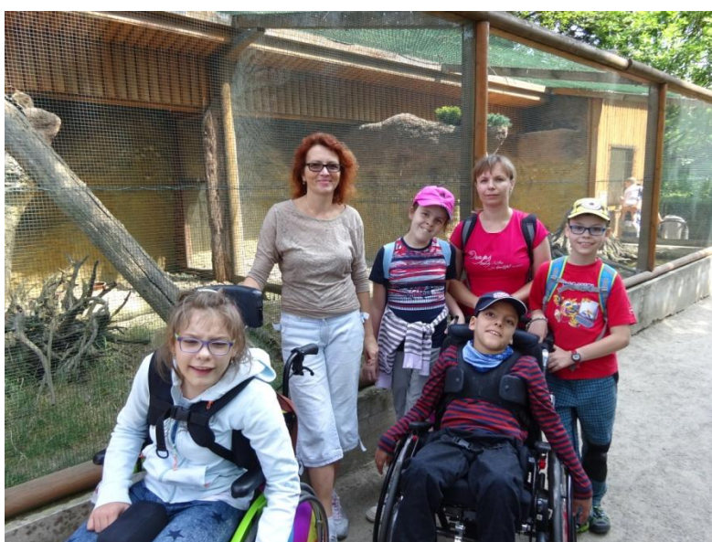
Výlet do Zoo parku Vyškov