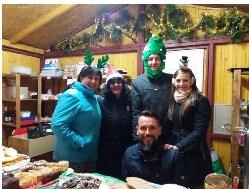
Vánoční stánek Dobrého místa pro život s herci Moravského divadla