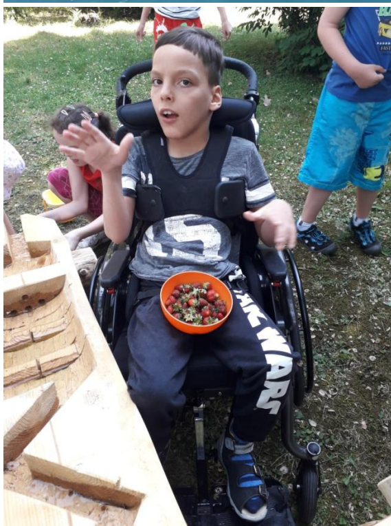
Pěstování jahod v Přírodní učebně