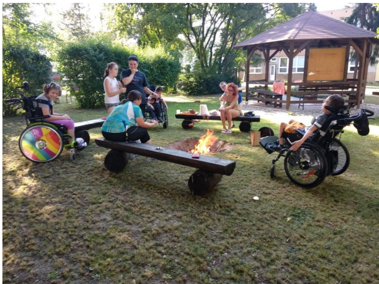
Přespání v CREDU