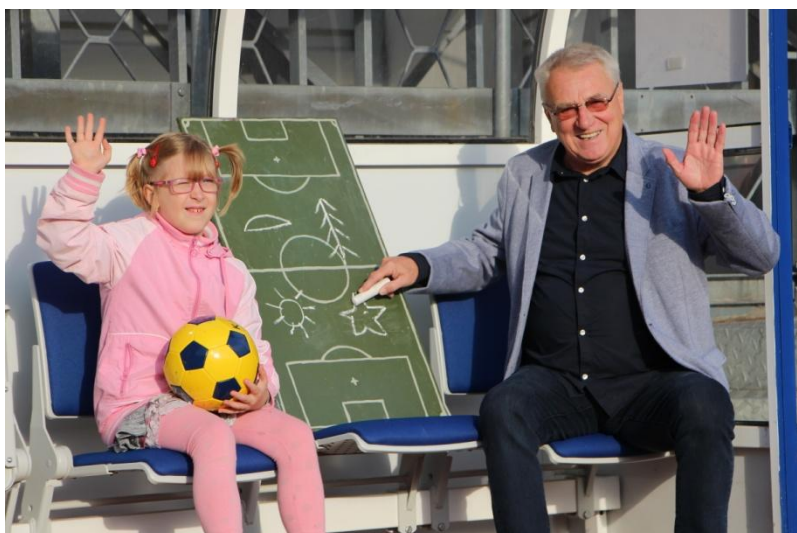
Focení benefičního kalendáře