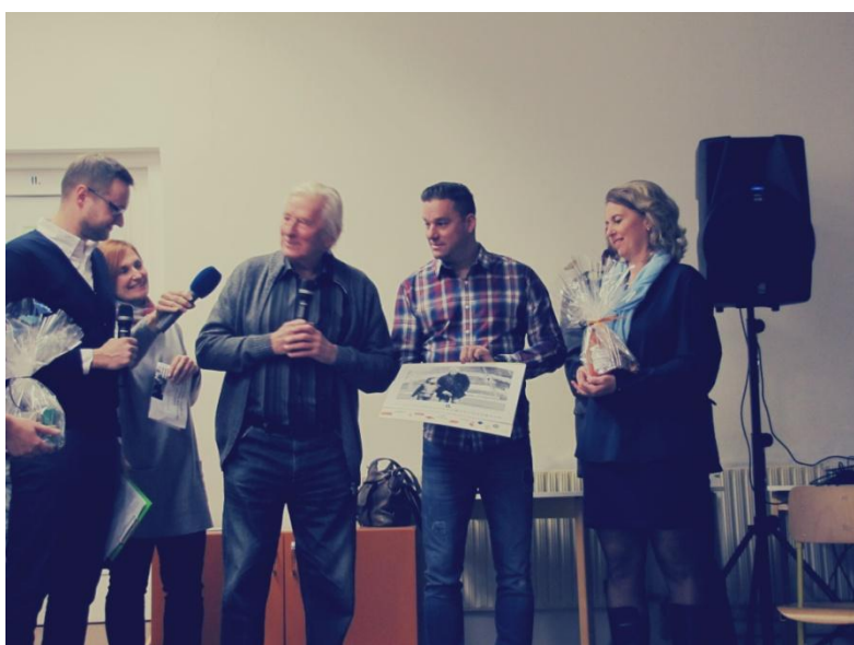
Křest benefičního kalendáře