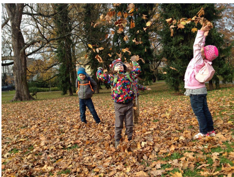
Užívání si podzimu