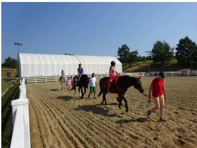
Dětský den v Tršicích