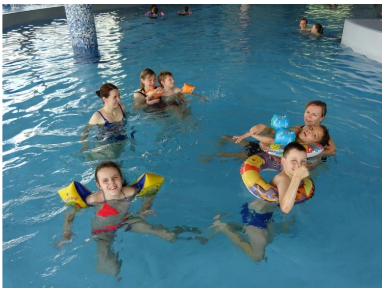
Výlet do Velkých Losin