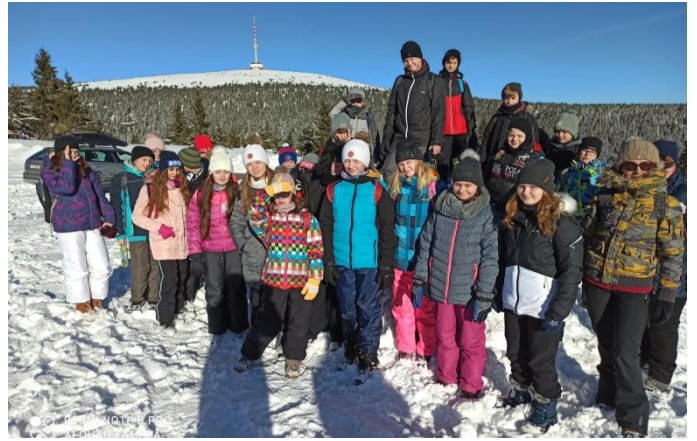
Ve zdravém těle, zdravý duch. Ozdravný pobyt Jeseníky.