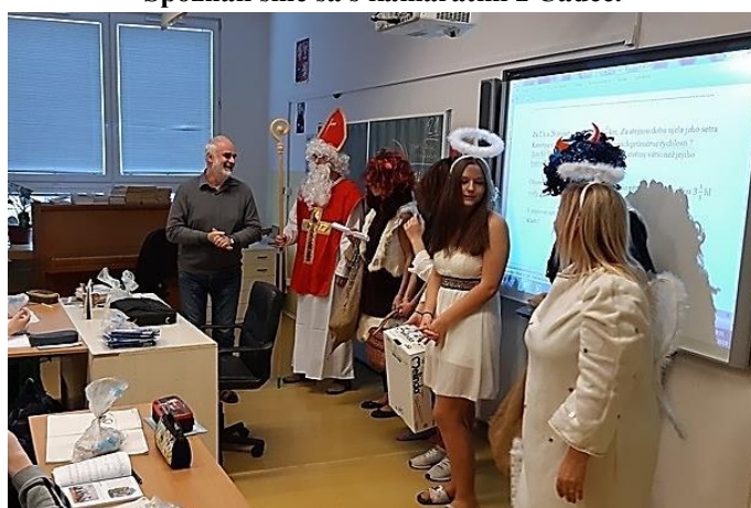
A pak přišel i Mikuláš.