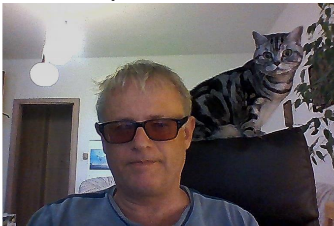
Do online výuky se zapojili i členové rodiny.