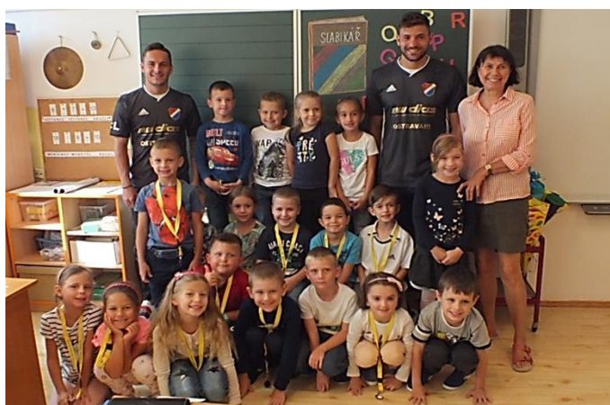
1. září s úsměvem a s Baníkem.