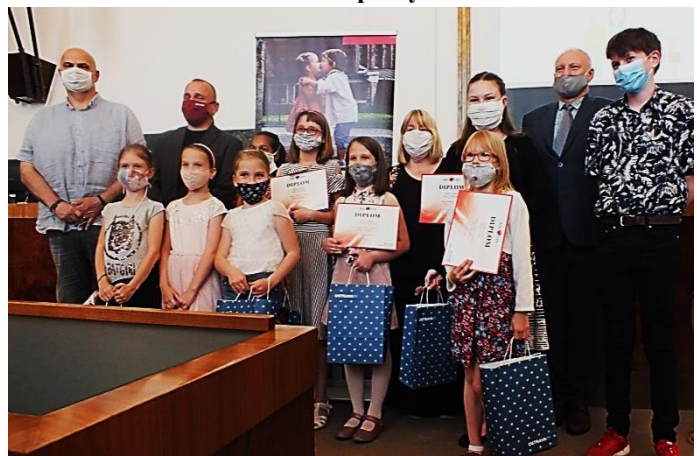
Ale i tak jsme vítězili – soutěž Moje rodina.