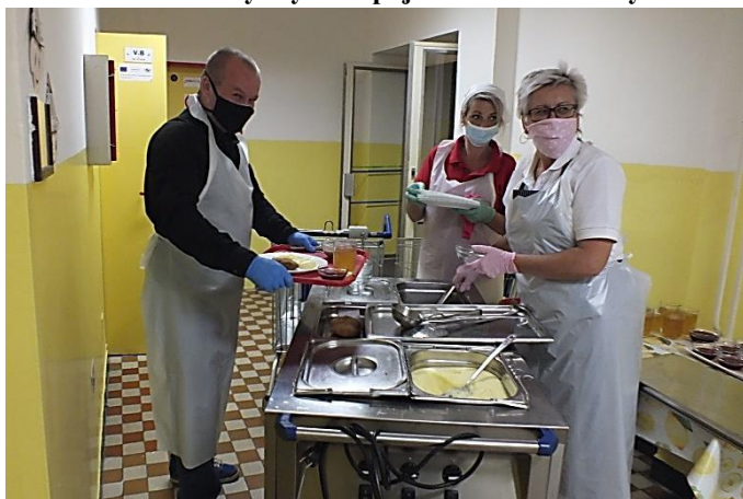
Luxus. Strava all inclusive až do třídy.