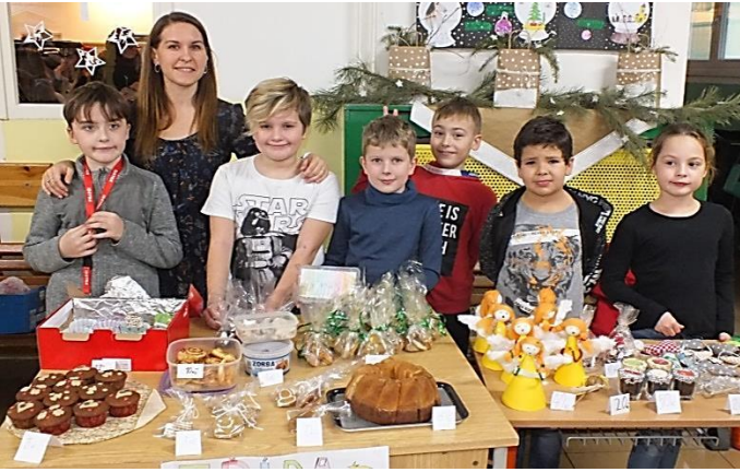
Nejlepší dárky pod stromeček koupíte na Zelené.