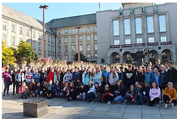
Spoznali sme sa s kamarátmi z Čadce.