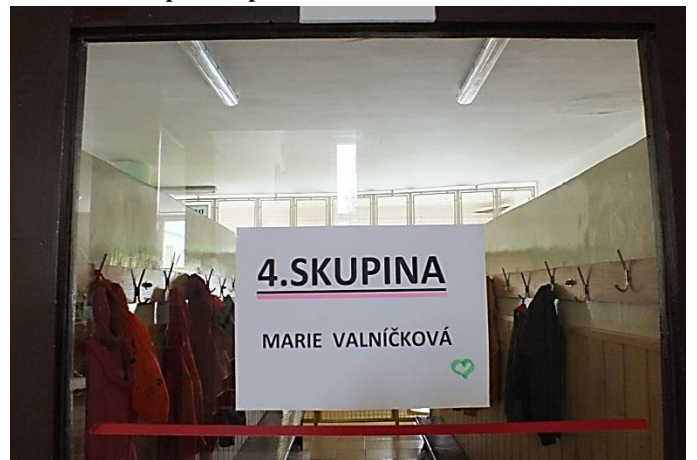
Květen 2020 – Zpátky ve škole.