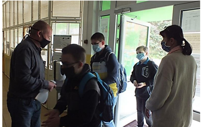
A pak už přišel Covid – březen 2020.