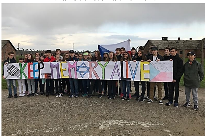
Nikdy nesmíme zapomenout – Osvětím 2019.