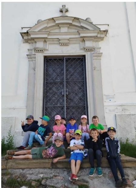
První třída na Svatém kopečku v Mikulově