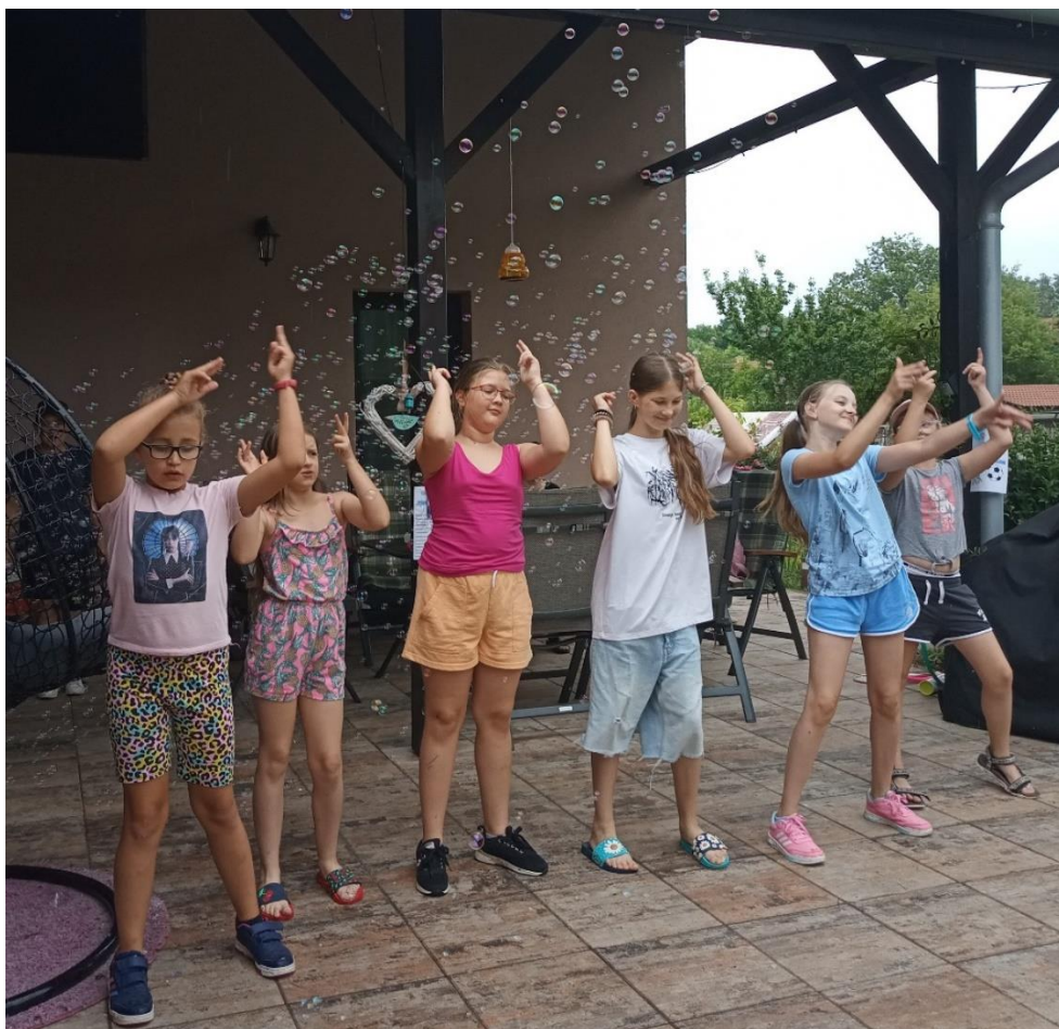
Čtvrtá třída na návštěvě u paní učitelky