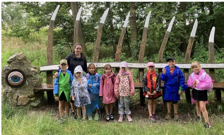
Přípravka na výletě v Jevišovce