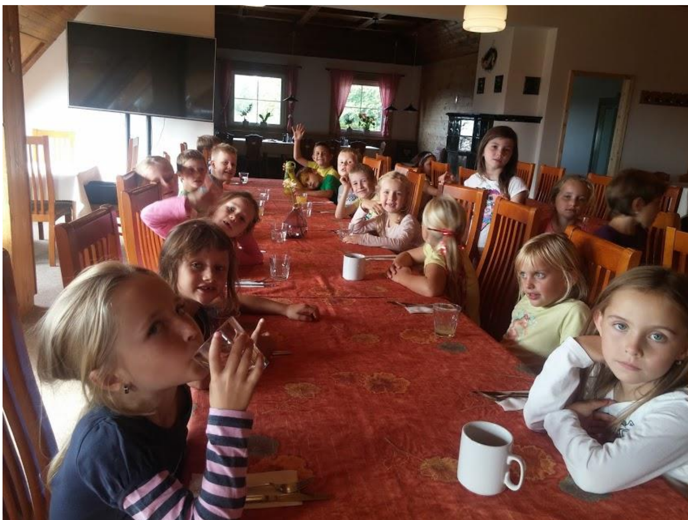
Výchova k vlastenectví (pevnost Stachelberg)