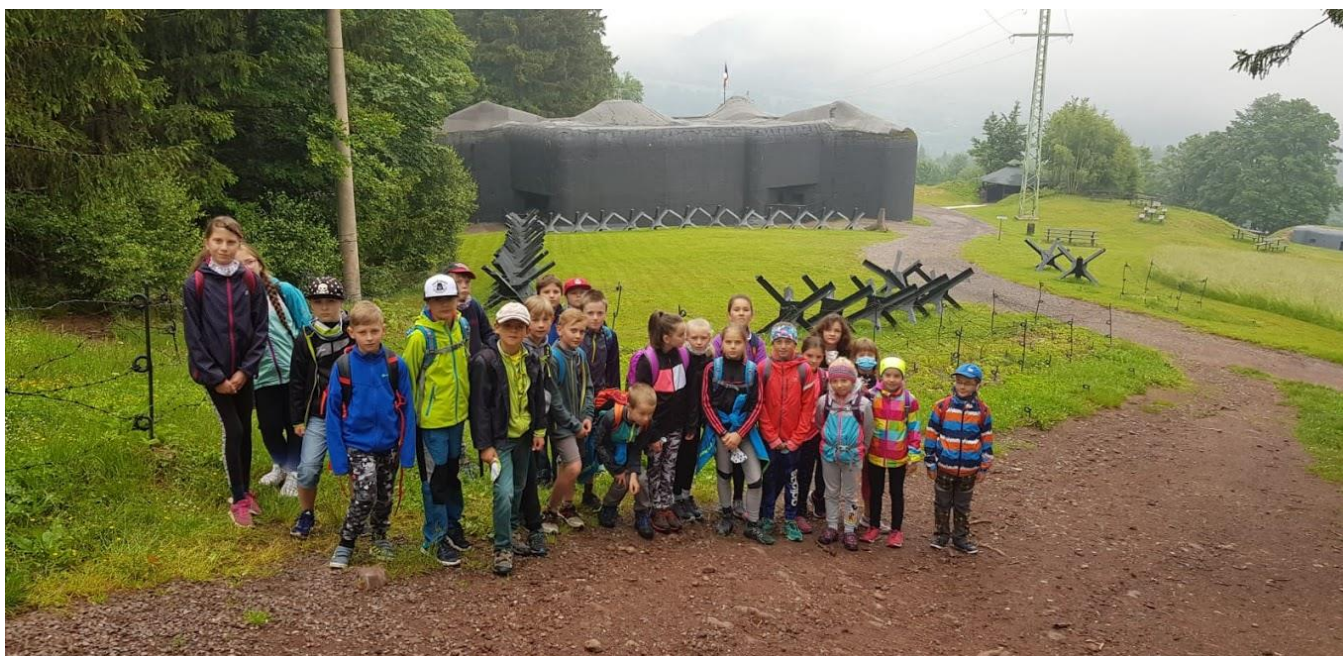
Výchova demokratického občana