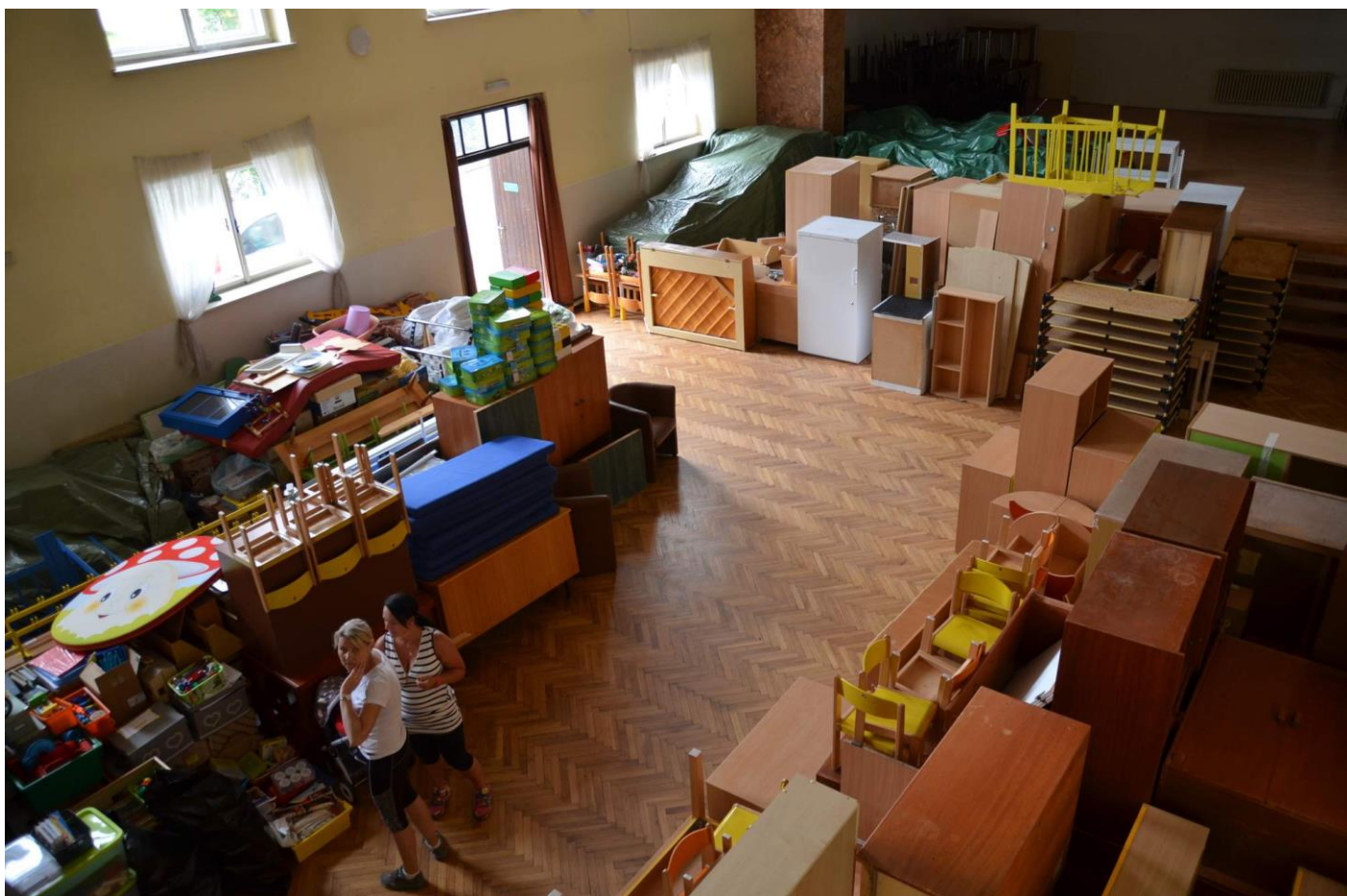
Těsně před zahájením stavby: