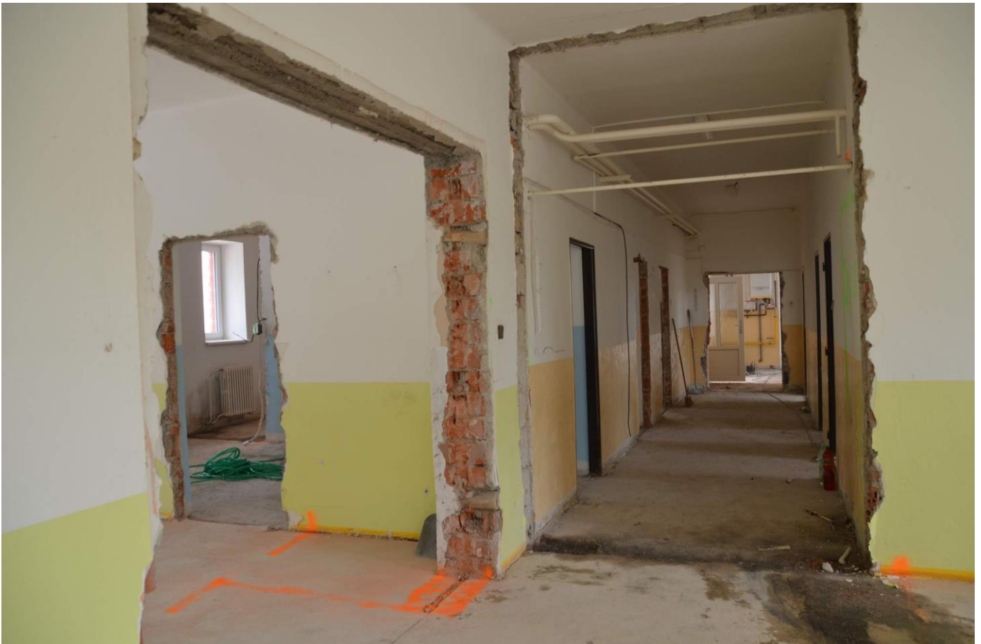
Odstraněna byla zámková dlažba z parkoviště a fasáda, kterou by rekonstrukce poničila.