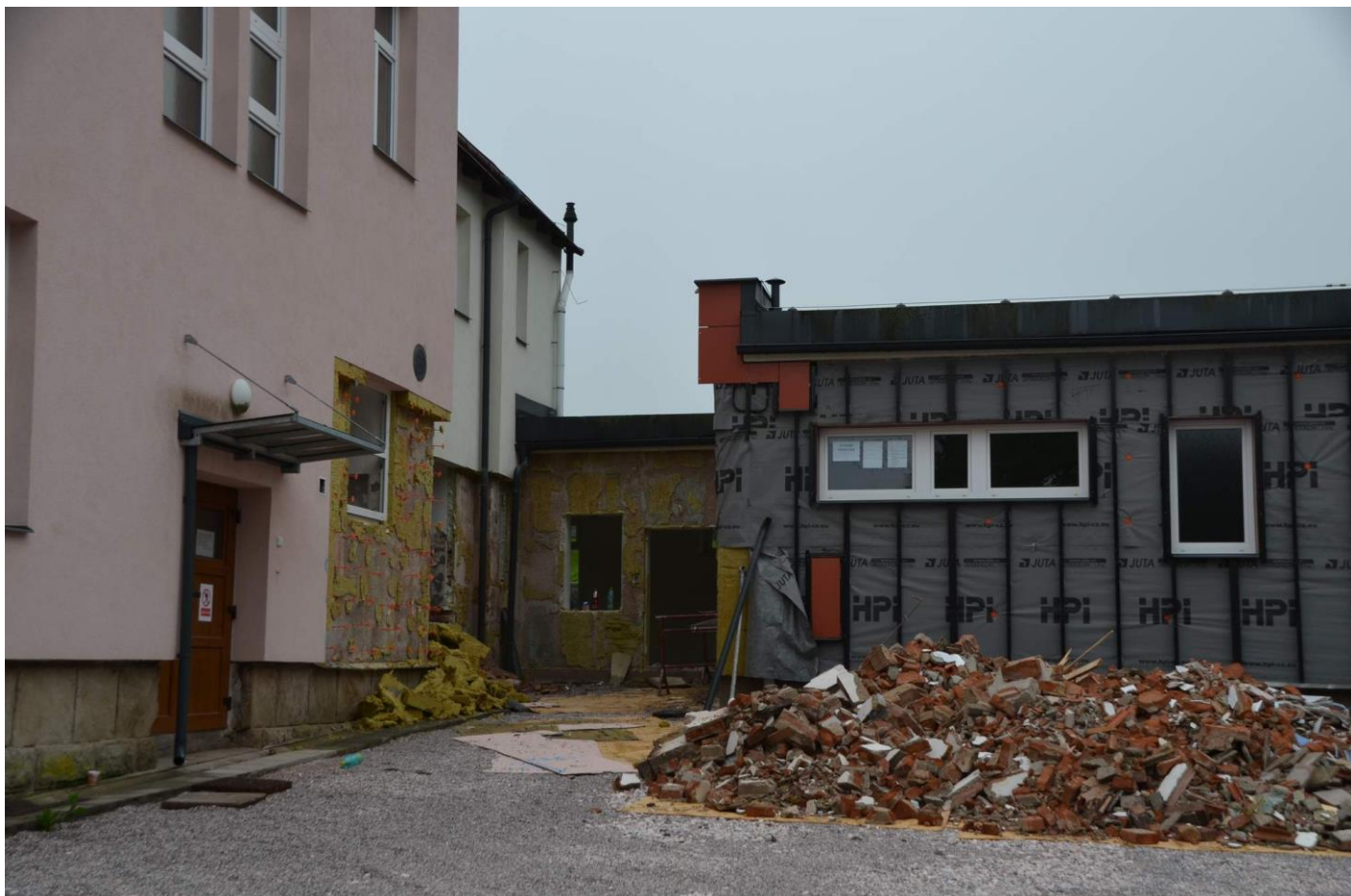
Stavba obnáší i výměnu sítí včetně kanalizace.