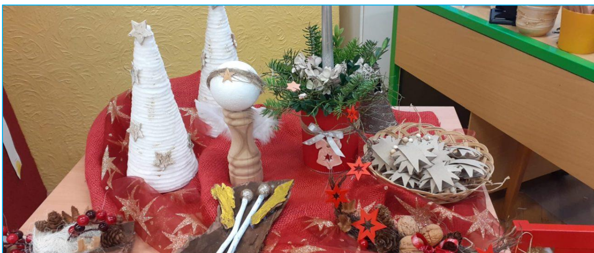
Den otevřených dveří spojený s vánoční výstavkou – vystavované výrobky