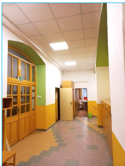
Vestibul po rekonstrukci