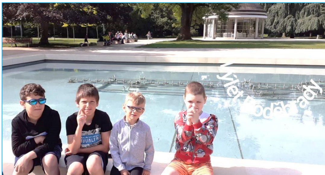
PS ZŠS na výletě do Poděbrad