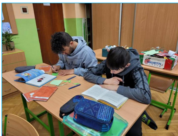
Žáci při četbě zapůjčených knih