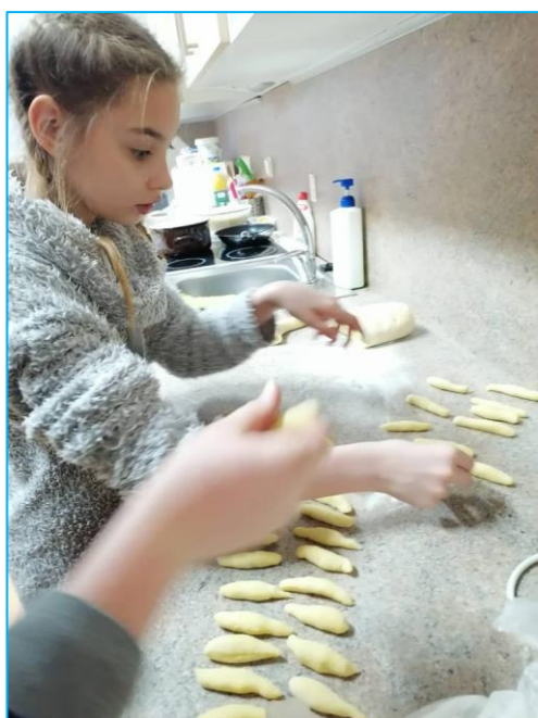
Žáci při projektovém dni „Bramboriáda“ - všechna foto