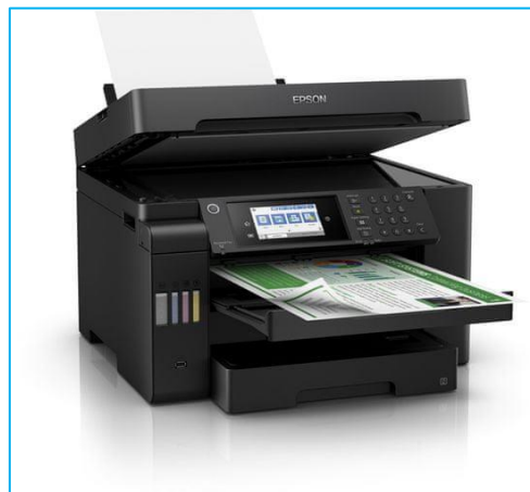
Nová barevná kopírka byla pořízena do sborovny.