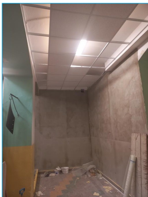
Vestibul při rekonstrukci