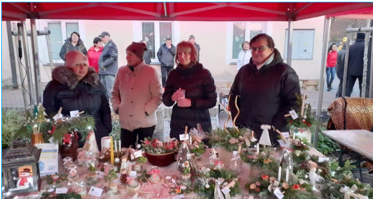
Prezentace školy při příležitosti rozsvícení vánočního stromu v Městci Králové - stánek naší školy

Příjemnou atmosféru adventu zažíváme při propagaci školy na rozsvícení vánočního stromu, který pořádá Město Městec Králové, kde vystavujeme práce našich žáků a zveme širokou veřejnost na vánoční výstavu, která se následně koná v naší škole.