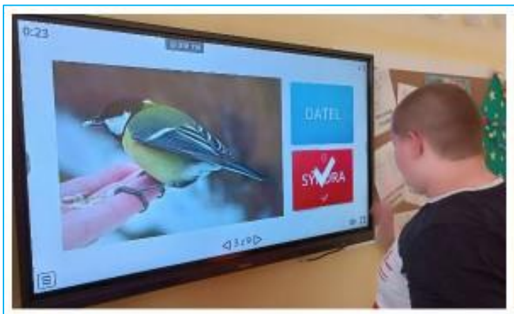
Do II. třídy byl umístěn nový interaktivní monitor.