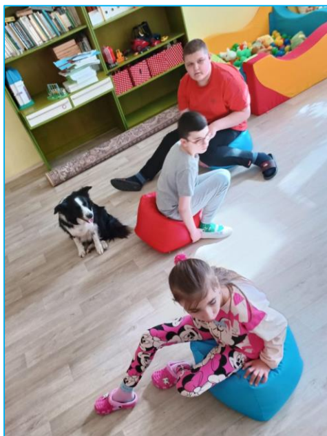
Naši žáci během canisterapie - obě foto

pocity, podněcuje verbální a neverbální komunikaci, rozvíjí sociální citění a poznávání a složku citovou. Všechny tyto pozitivní vlivy canisterapie ukázaly, že je velmi vhodná pro naše žáky. Financování canisterapie bylo podporováno ze spolku Ruku v ruce.