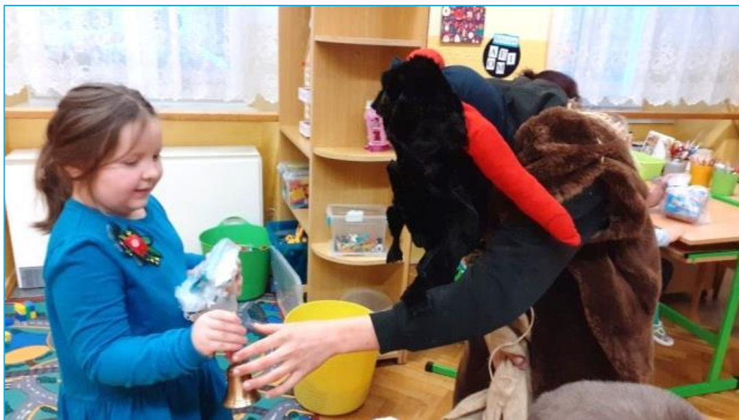
Když přišel čert do třídy PS ZŠS...