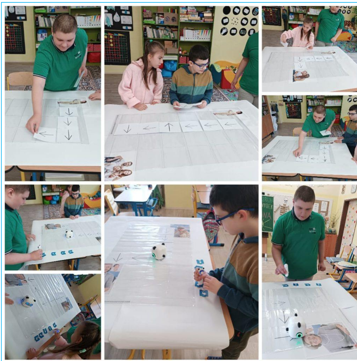
Žáci II. třídy při práci s robotickou hračkou

Interaktivní a robotické hračky jsou výborným pomocníkem při rozvíjení základního programování i pro naše žáky. Proto i my tyto hračky pravidelně využíváme při výuce. Dnes jsme se učili krokovat nejenom pomocí šipek, ale i s mTinym, s kterým jsou všichni kamarádi.