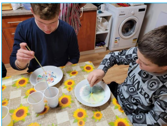
Žáci při fyzikálních pokusech – všechna foto