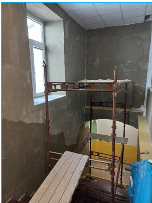
Schodiště při rekonstrukci

Vzhledem ke zvyšujícím se cenám energií byly ve IV. třídě a na školní kuchyňce instalována nová akumulční kamna. Tím očekáváme snadnější regulovatelnost teplot ve třídách. Snažíme se nakládat s energiemi hospodárně. Vše bylo plně financováno pronajímatelem budovy školy – Městem Městec Králové.