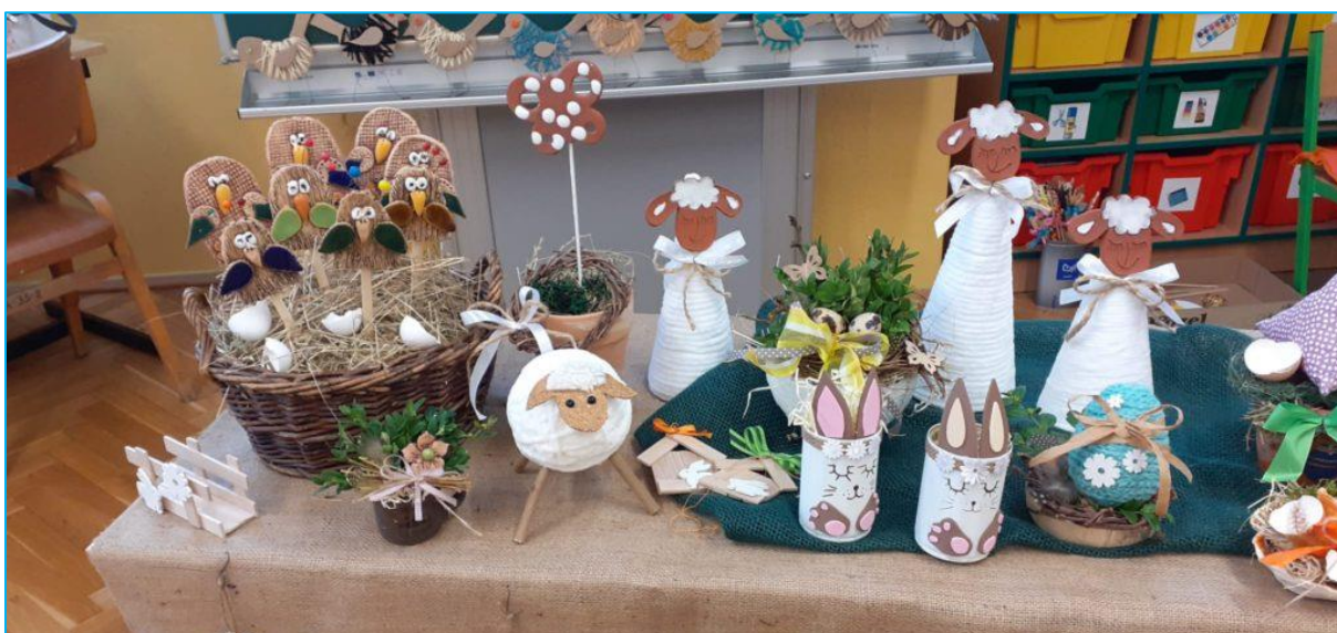
Den otevřených dveří spojený s velikonoční výstavkou – vystavované výrobky

V hodinách pracovního vyučování vyrábějí žáci různé upomínkové předměty a přáníčka zaměřená na vánoční a velikonoční tematiku. Každoročně pořádáme velikonoční a vánoční výstavky, spojené se dnem otevřených dveří. Tyto akce jsou veřejností velmi kladně hodnoceny a hojně navštěvovány. Návštěvníci si mají možnost prohlédnout prostory školy, výtvarnou výstavku, nahlédnout do tříd a sledovat výuku našich žáků.