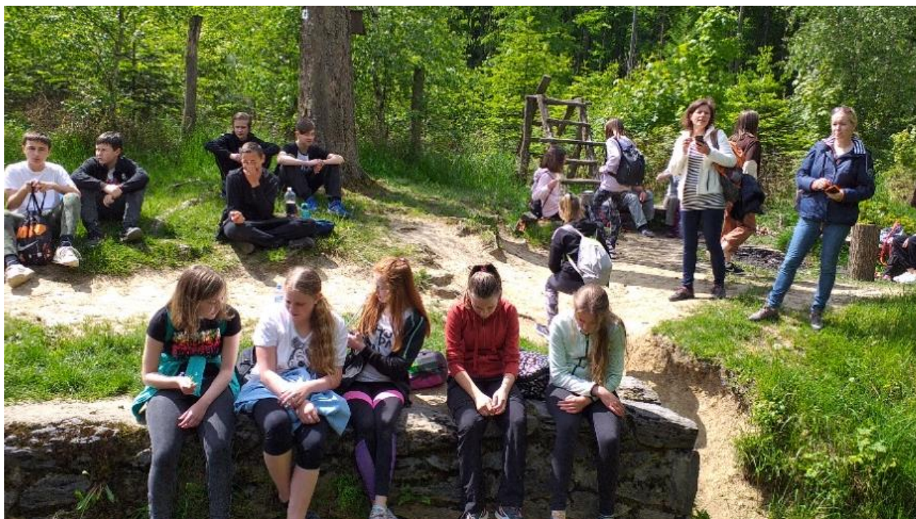
Pochod za zdravím

1. 6. 2021 – v rámci Dne dětí jsme zorganizovali „Pochod za zdravím“, aby se po dlouhém distančním vzdělávání opět stmelily třídní kolektivy