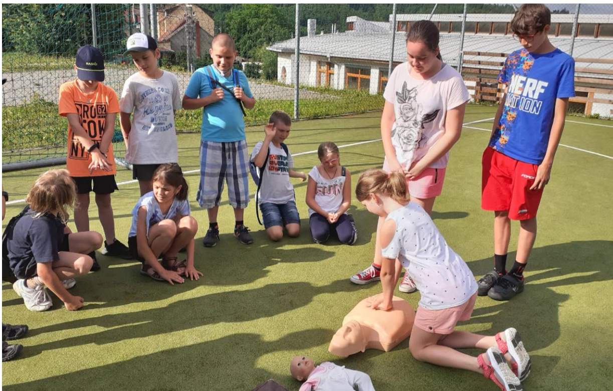
Den prevence a předlékařské první pomoci