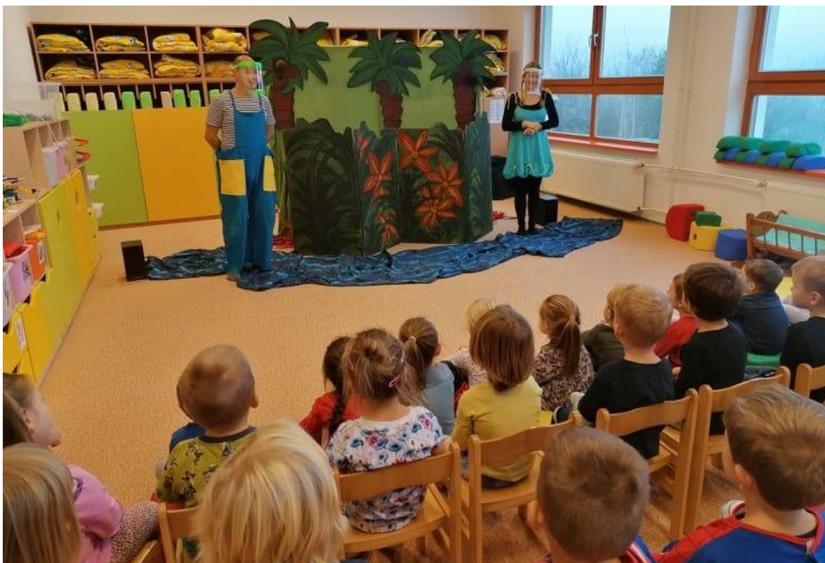
Divadlo v MŠ – Africká pohádka

25. 11. 2020 – divadelní představení v MŠ „Africká pohádka“