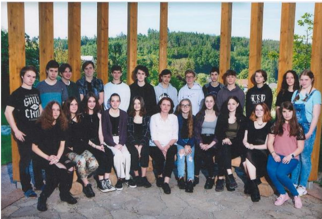
Absolventi školy 2020/21