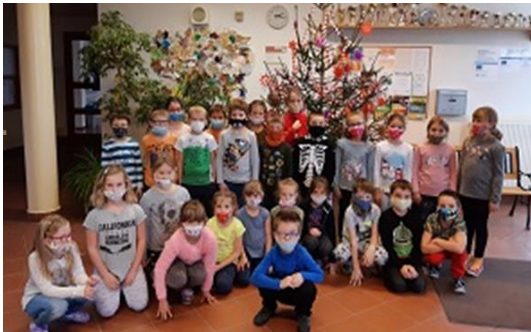
Zdobení vánočního stromečku vlastními vyrobenými ozdobami