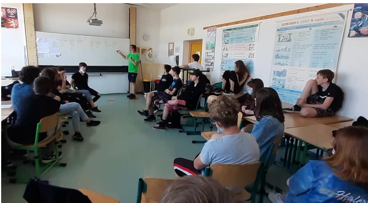
Život v kostce