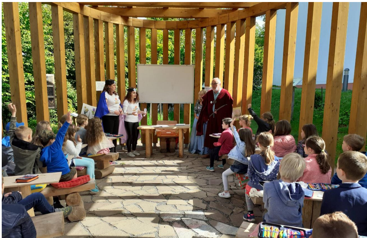
Pasování na čtenáře

1. 6. 2021 – pasování žáků 1. třídy na čtenáře