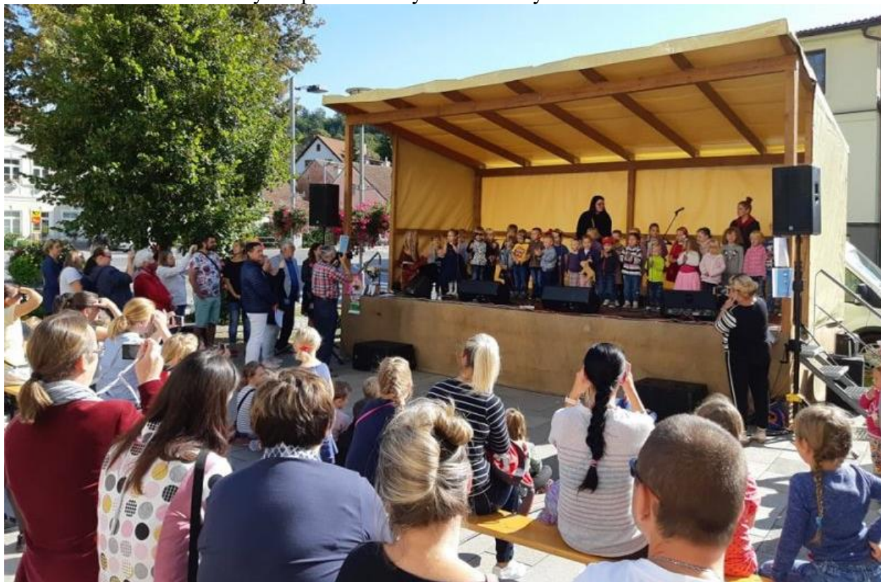
Den Křtin 2020

19. 9. 2020 – Den Křtin – vystoupení dětí a vyhodnocení výtvarné soutěže ke Dni Křtin