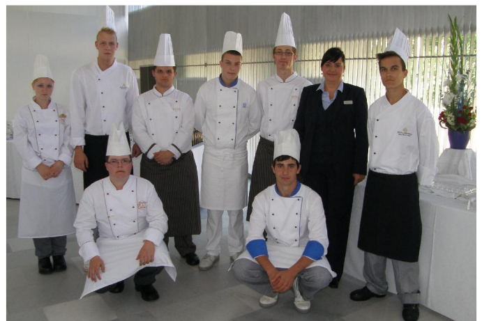
catering pro karibské diplomaty