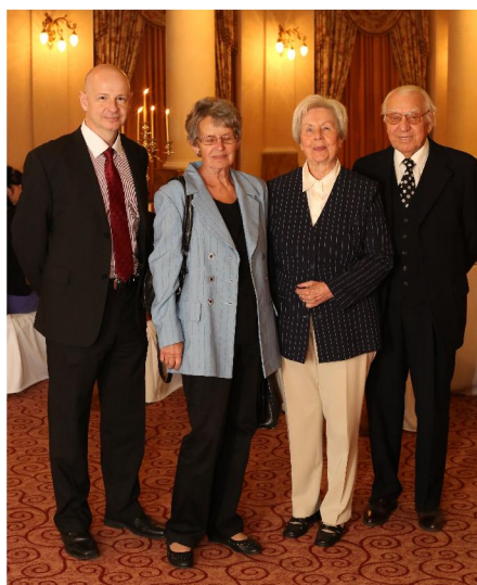
setkání ředitelů školy