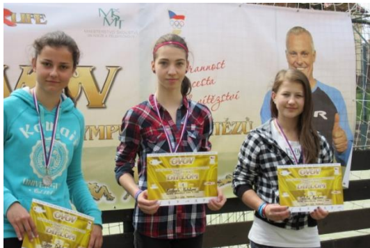
OVOV, okresní kolo v Humpolci