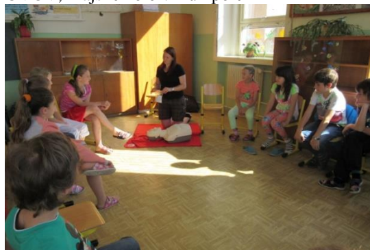
První pomoc ve 2. a 3. třídě