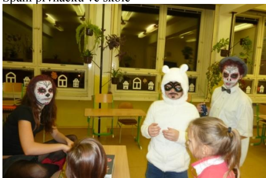
Halloween ve škole