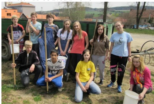
Den Země a 8. třída