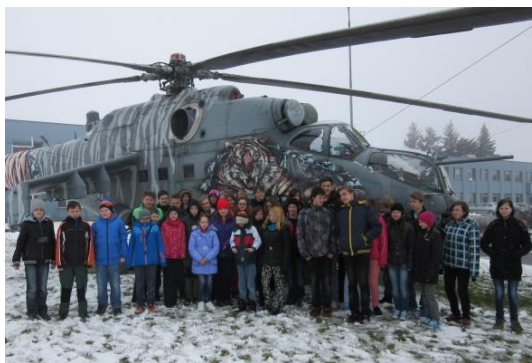
Náměšť nad Oslavou a Temelín