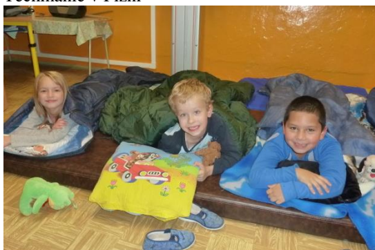
Spaní prvňáčků ve škole