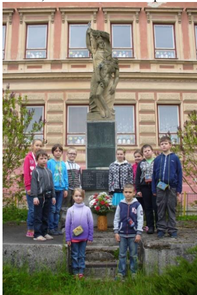
Družina u pomníku padlých