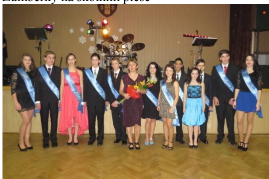
9. třída po slavnostním stužkování