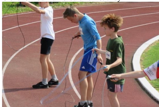
OVOV, krajské kolo v Humpolci