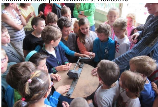
První školní medování