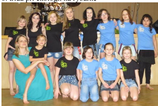
Zumberky na školním plese