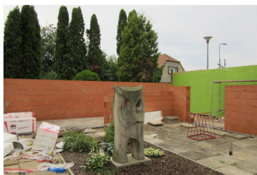
Stavba nové spojovací chodby