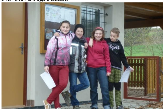
6. třída při ekologii na rybárně