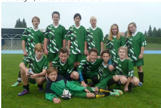
CocaCola Cup, turnaj v Pacově