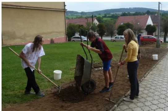
Úprava parku před školou