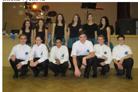
Devítka po předtančení