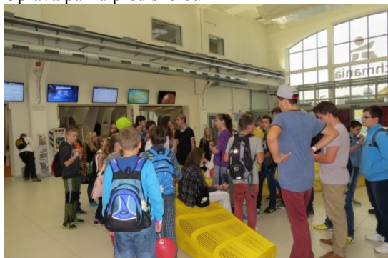
Techmanie v Plzni