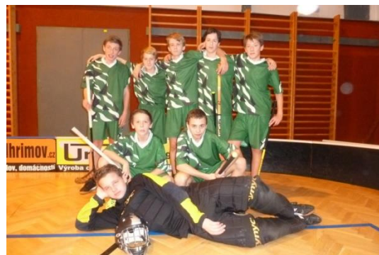
Florbal, turnaj v Pelhřimově