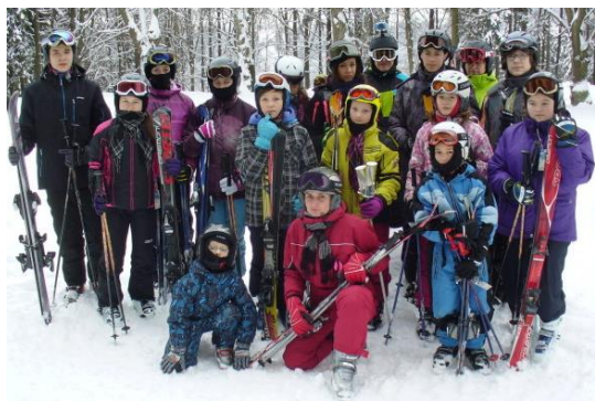
Lyžařský kurz v Pasekách nad Jizerou