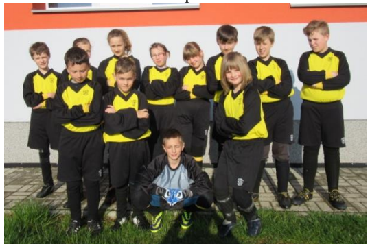
McDonalds Cup, turnaj v malé kopané v Pacově