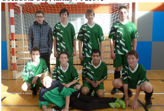
Sálový fotbal, turnaj v Pacově