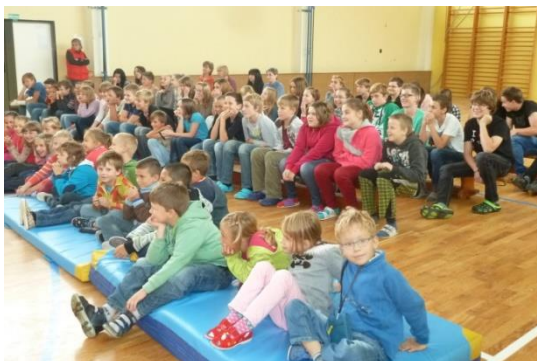
Pernštejní, divadlo v tělocvičně