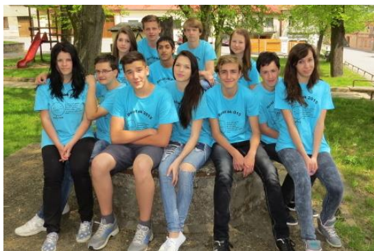
Žáci 9. třídy