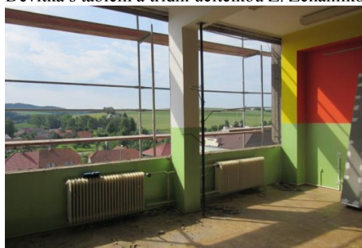
Začátek rekonstrukce školy