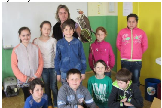
Dravci ve škole na 1. stupni