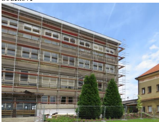
Začátek rekonstrukce školy