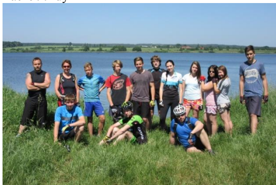
Cyklo turistický výlet na Třeboňsko