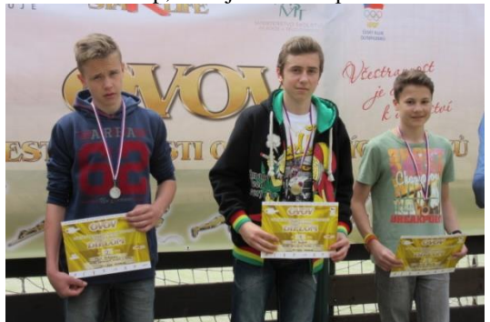
OVOV, okresní kolo v Humpolci