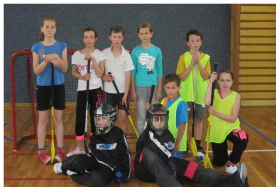
Členové kroužku florbalu 4. – 6. třídy