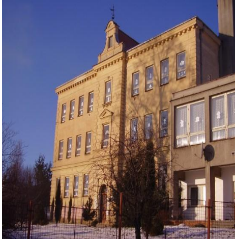
Obr. 1: Hlavní budova