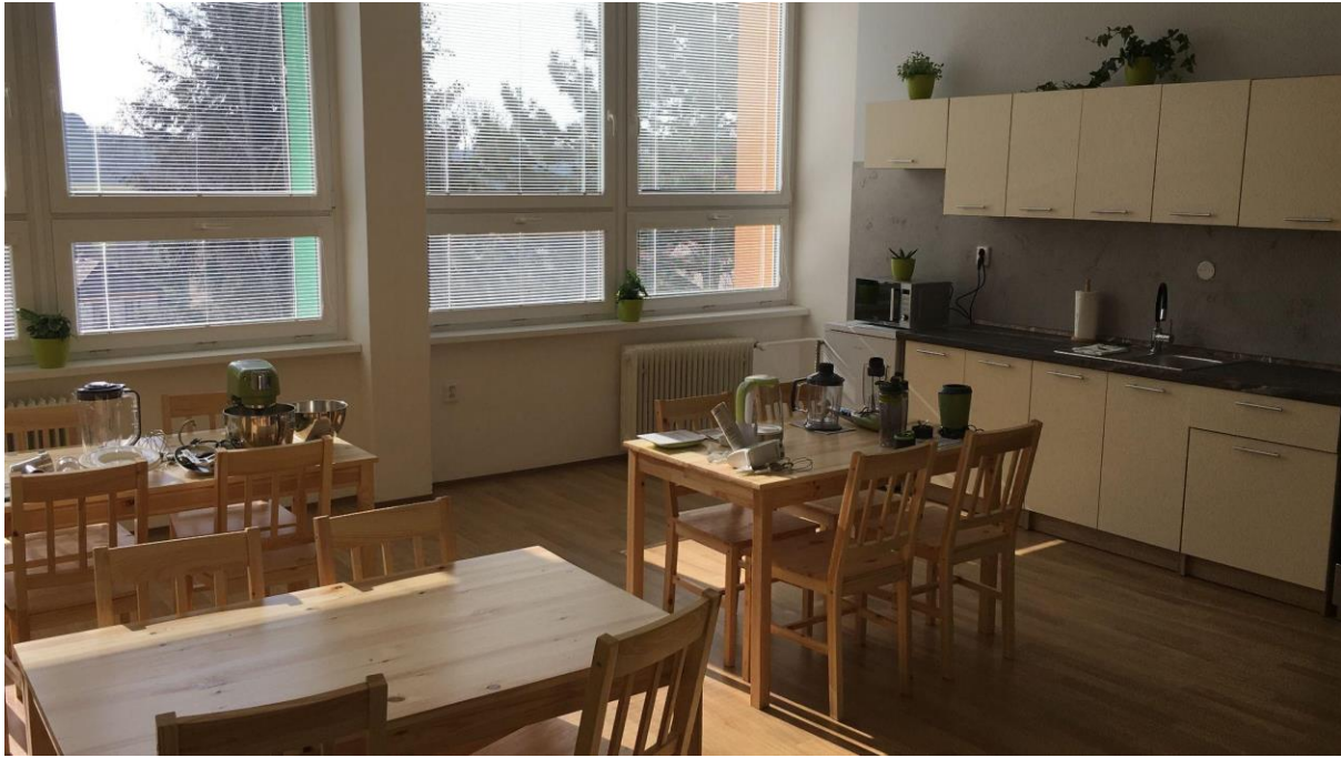
Obr. 5: Cvičná kuchyňka