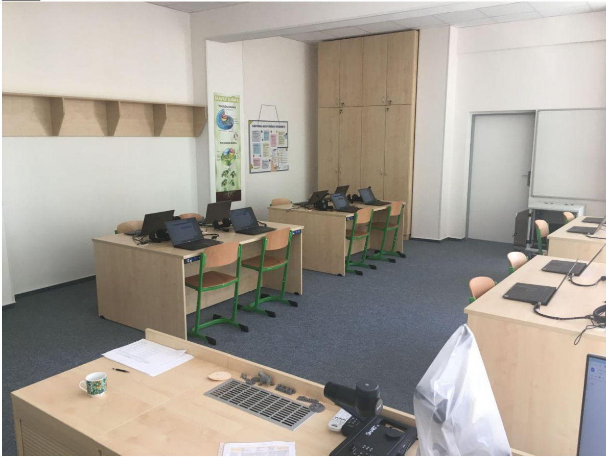
Obr.3: Enviromentální učebna