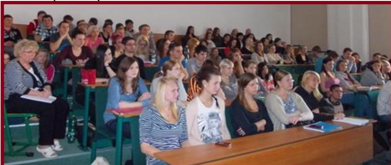
Multifunkční přednáškový sál