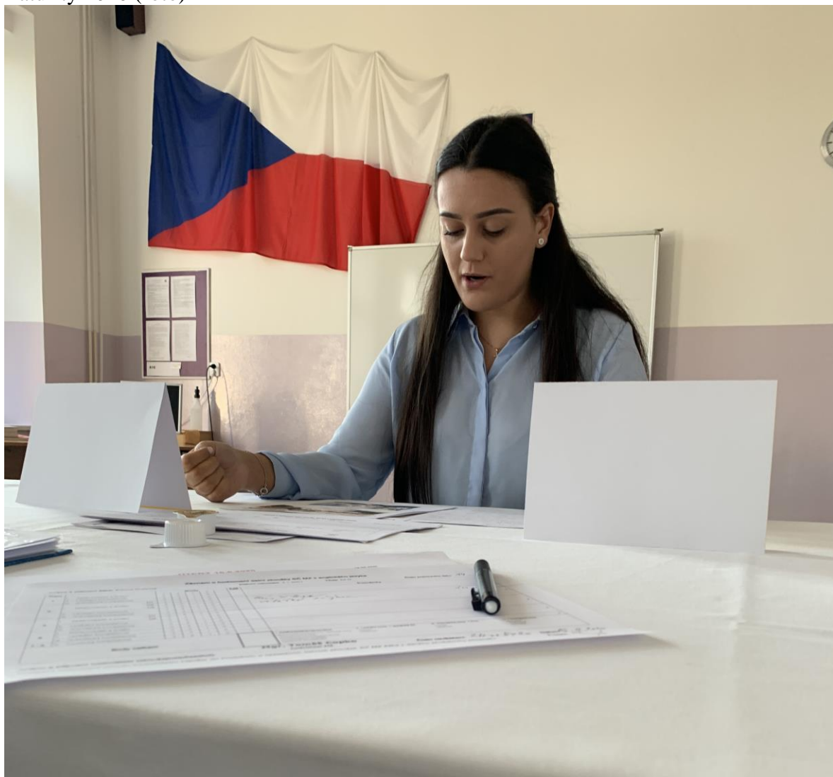
Maturity 2020 (foto)