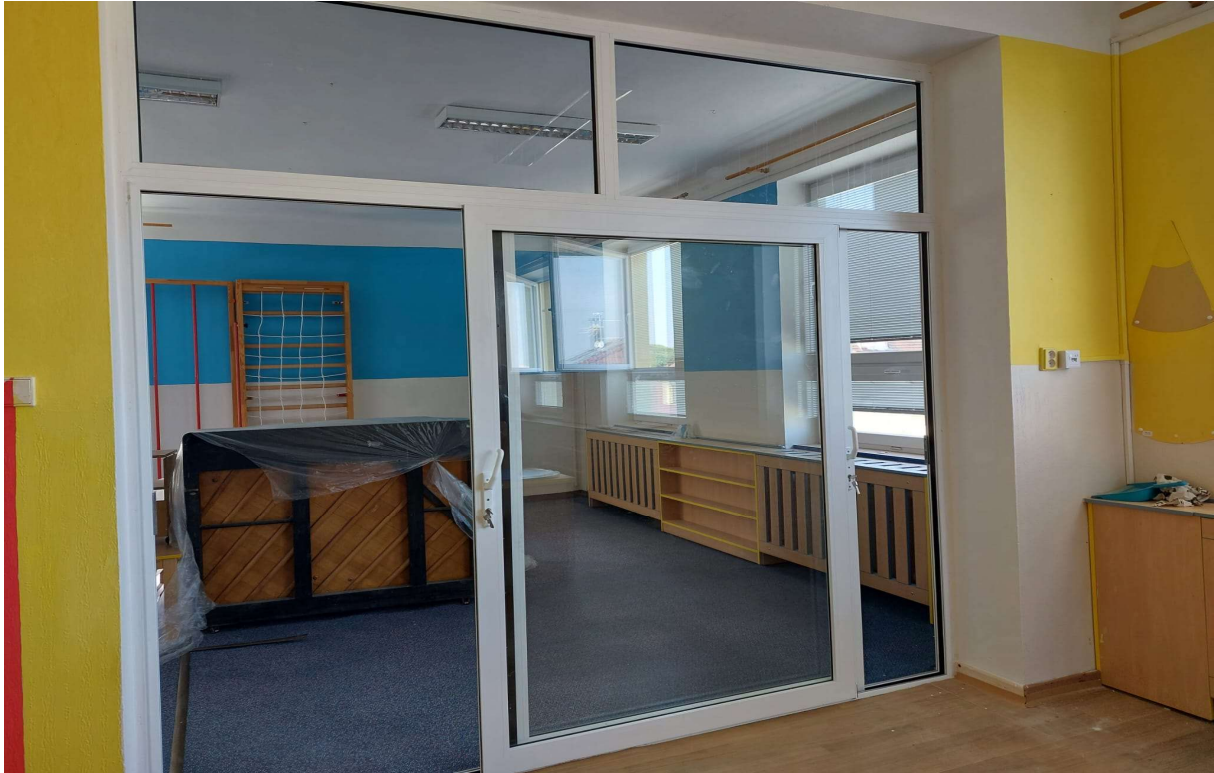
Obrázek 3 Nové posuvné stěny ve třídách