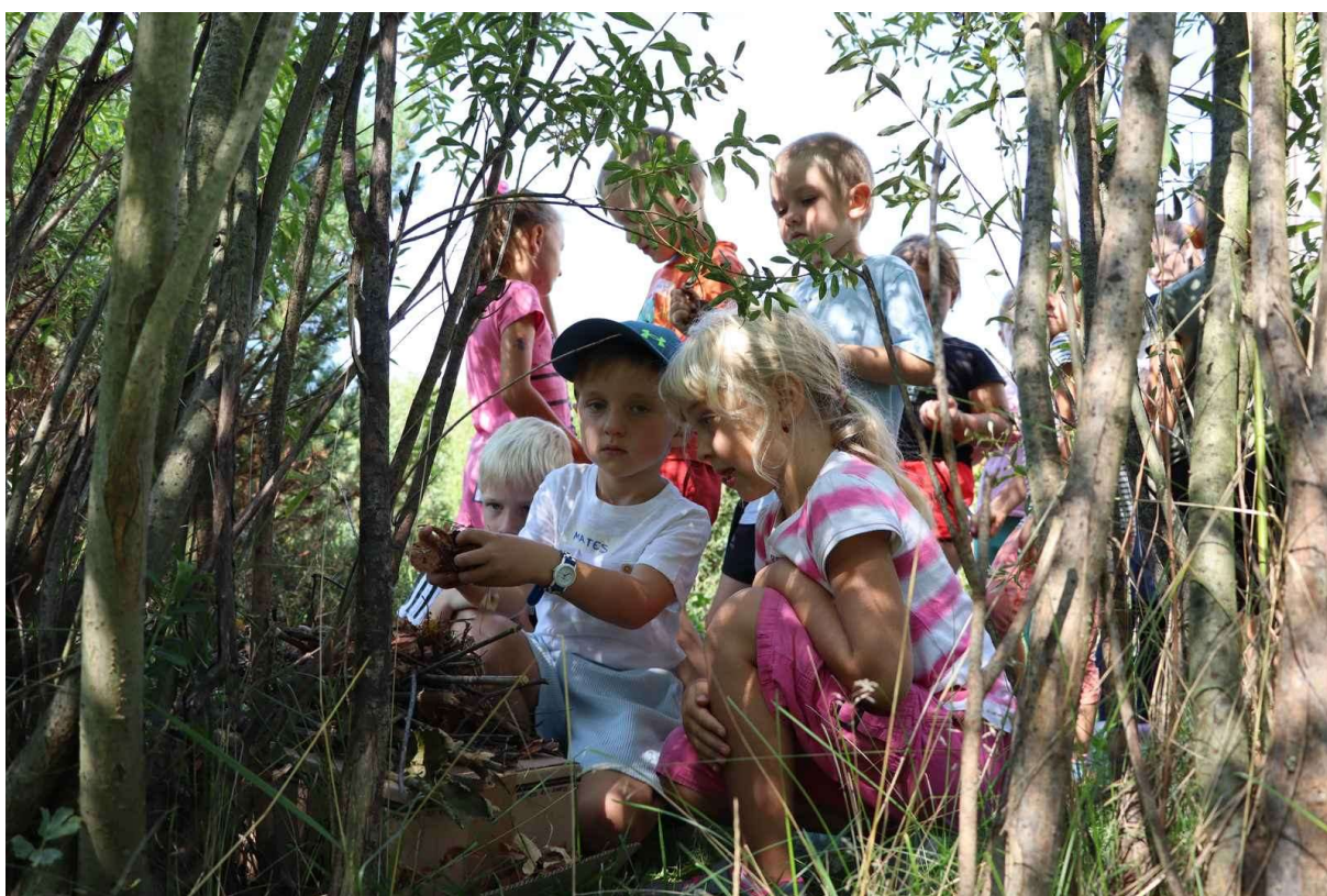
Obrázek 14 Ekologický program na zahradě AMETYST