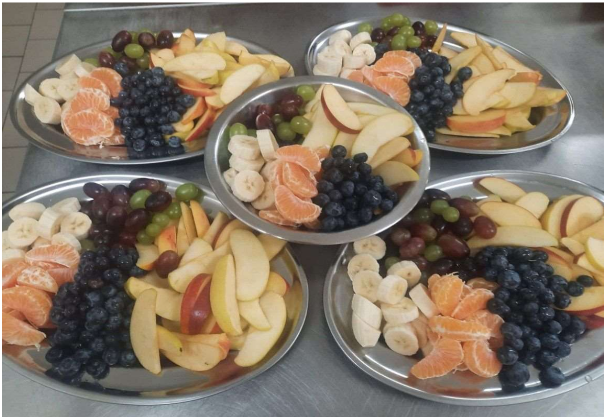
Obrázek 4 Zdravé stravování