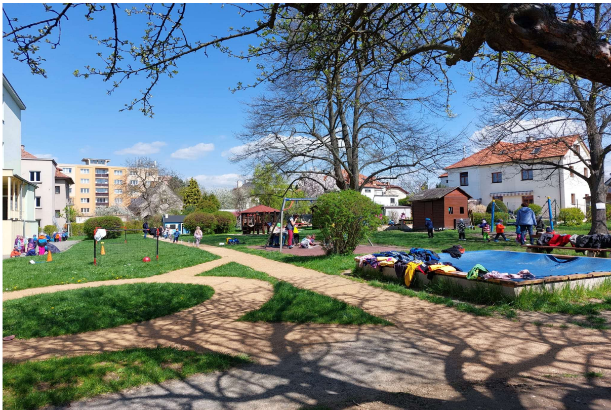
Obrázek 13 Olympiáda na zahradě MŠ