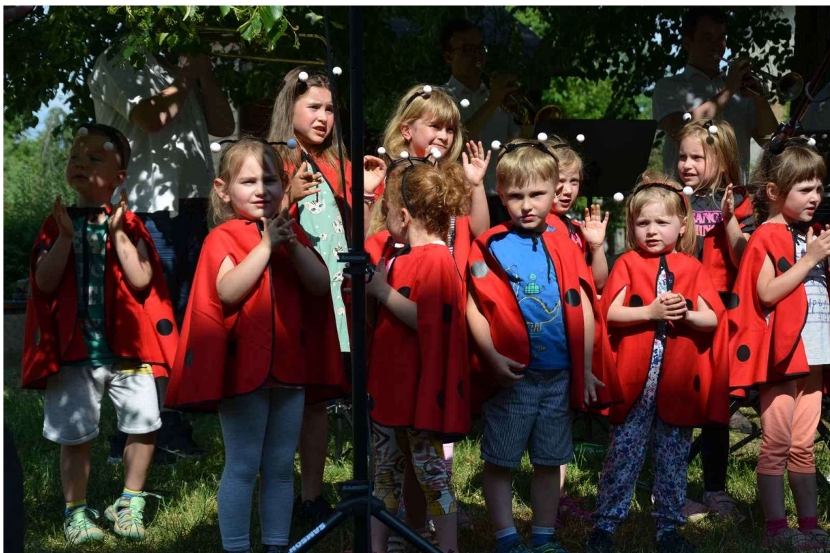
Obrázek 11 Zpívání s Broučci + band