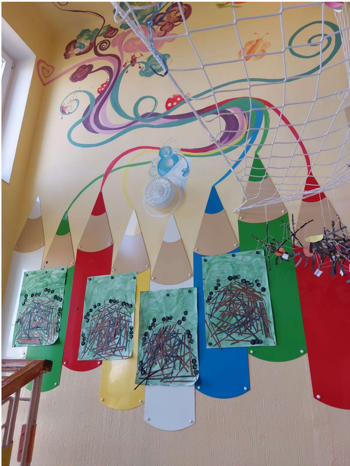
Obrázek 16 Výzdoba školy