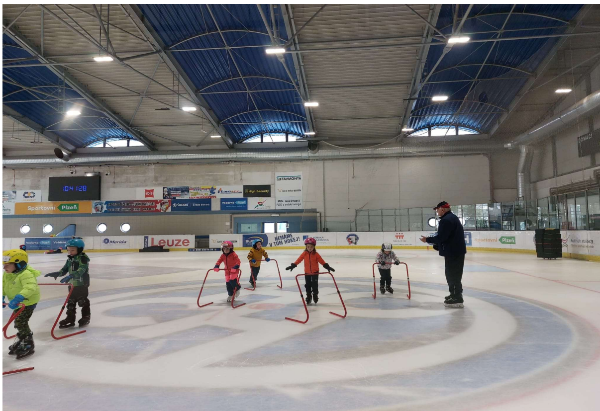
Obrázek 7 Celoroční kurz bruslení