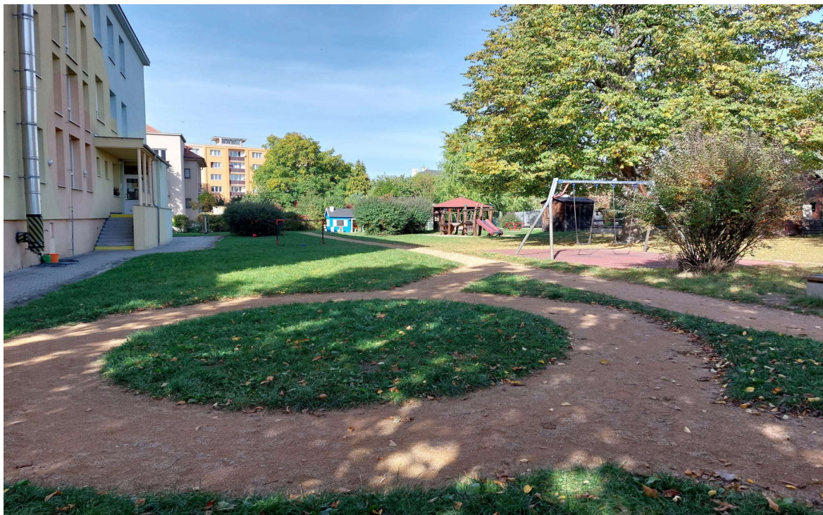
Obrázek 1 Nové cesty pro jízdu na koloběžkách a kolech