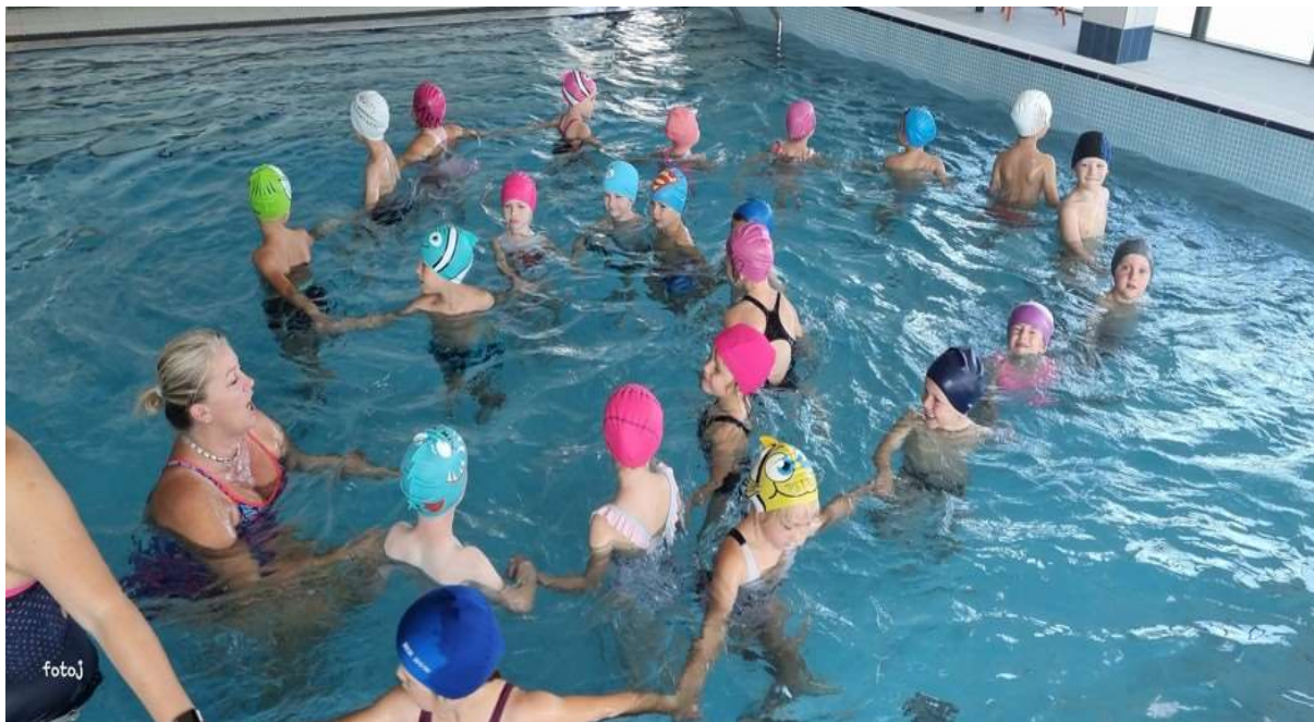
Obrázek 9 Celoroční kurz plavání