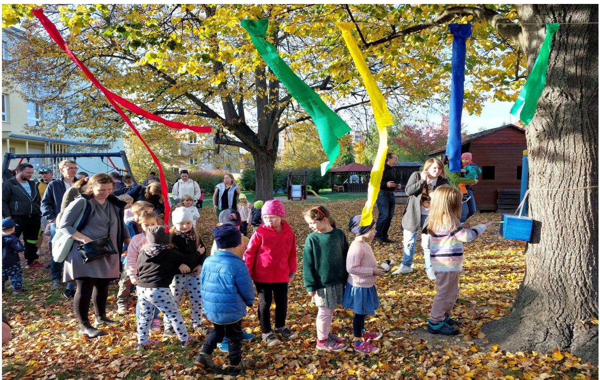
Obrázek 6 Odpoledne s rodiči - Zamykání zahrady