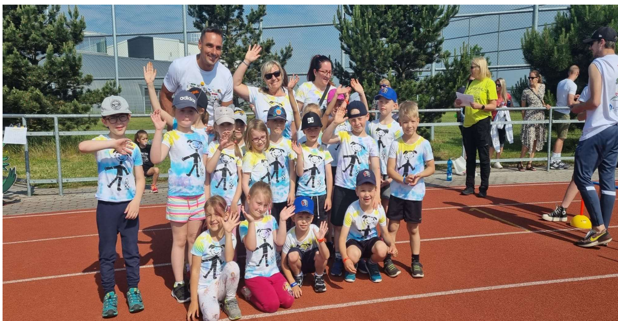
Obrázek 15 Účast na Sportovních hrách MŠ - 2. místo