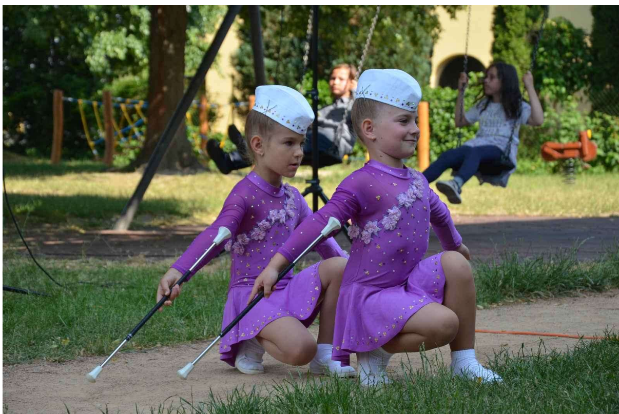
Obrázek 10 Kroužek "Mažoretky"