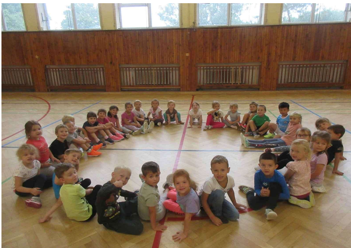
Obrázek 8 Sportování v tělocvičně TJ Hradiště