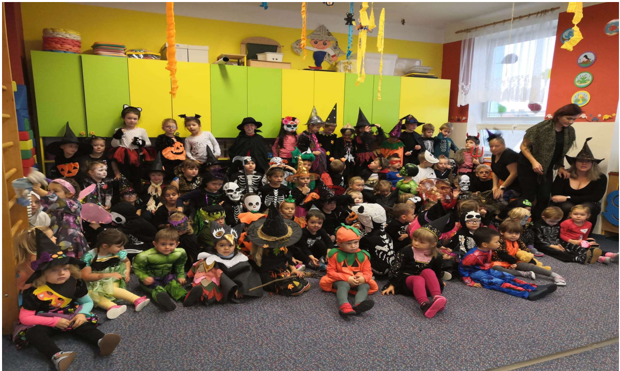
Obrázek 5 Tematické dny - Strašidelný den