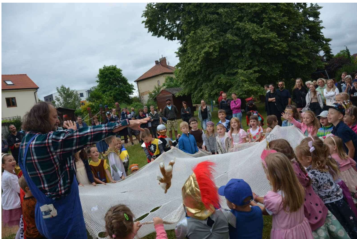
Obrázek 12 Zahradní party s pasováním předškoláků