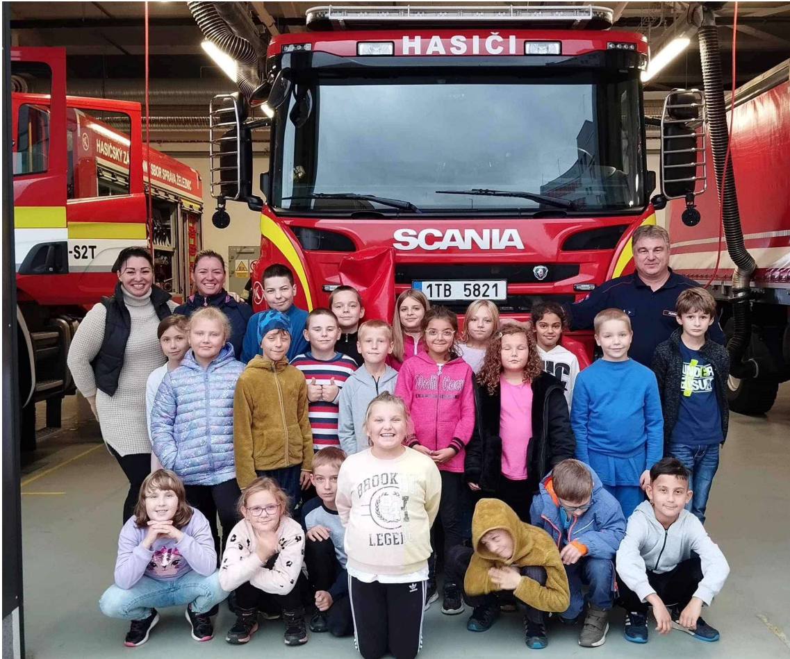
Družina na návštěvě HZS v Ostravě