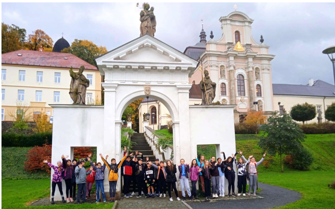
Žáci 6. ročníků v barokním Fulneku