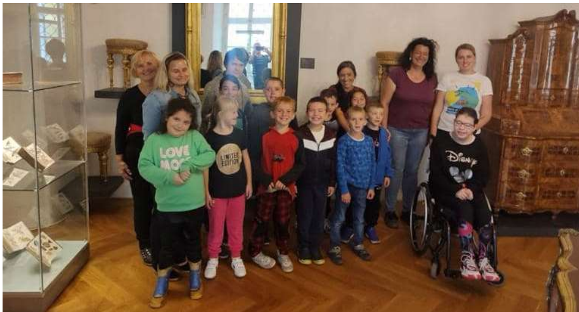
Slunečnice na zámku Nová Horka

Jednotlivé programy pokládáme za názorný dokument, podle toho také s ním pracujeme. Průběžně je evalujeme, dle potřeby obměňujeme a zařazujeme nové informace. Během školního roku jsme se řídili dle ŠVP aktualizovaného v roce 2021. Typickým znakem pro všechny vzdělávací programy je praktické, nevšední vzdělávání spojené s prožitkem a reálným životem. Všechny se také přesně řídí konkrétními požadavky rámcových vzdělávacích programů. Specifikami upravených minimálních výstupů a ŠVP Sedmikráska jsou zásady postupu každého žáka dle svého individuálního tempa a schopností, hodnocení je postaveno na úspěchu jednotlivce, při neúspěchu bývají do procesu zapojeni rodiče tak, abychom jednali ve vzájemné shodě, vyniká rozmanitostí forem výuky a střídáním metod se směřuje ke zjednodušení procesu učení a zvýšení jeho přitažlivosti.