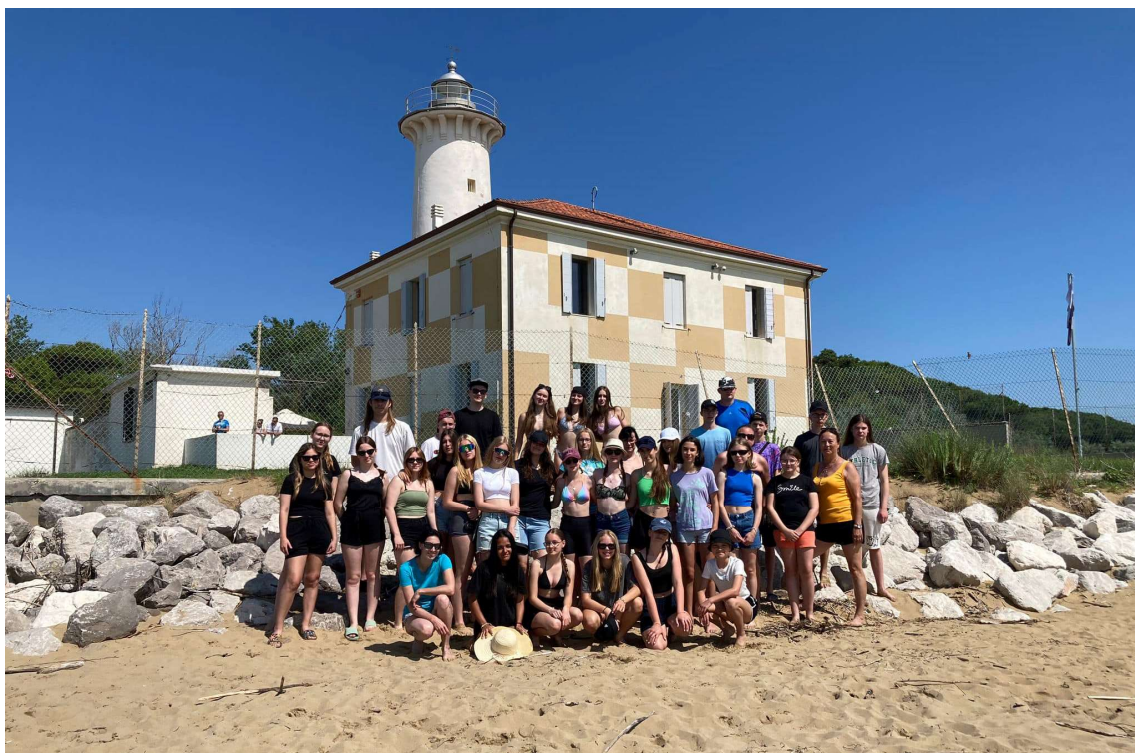
Itálie - Bibione