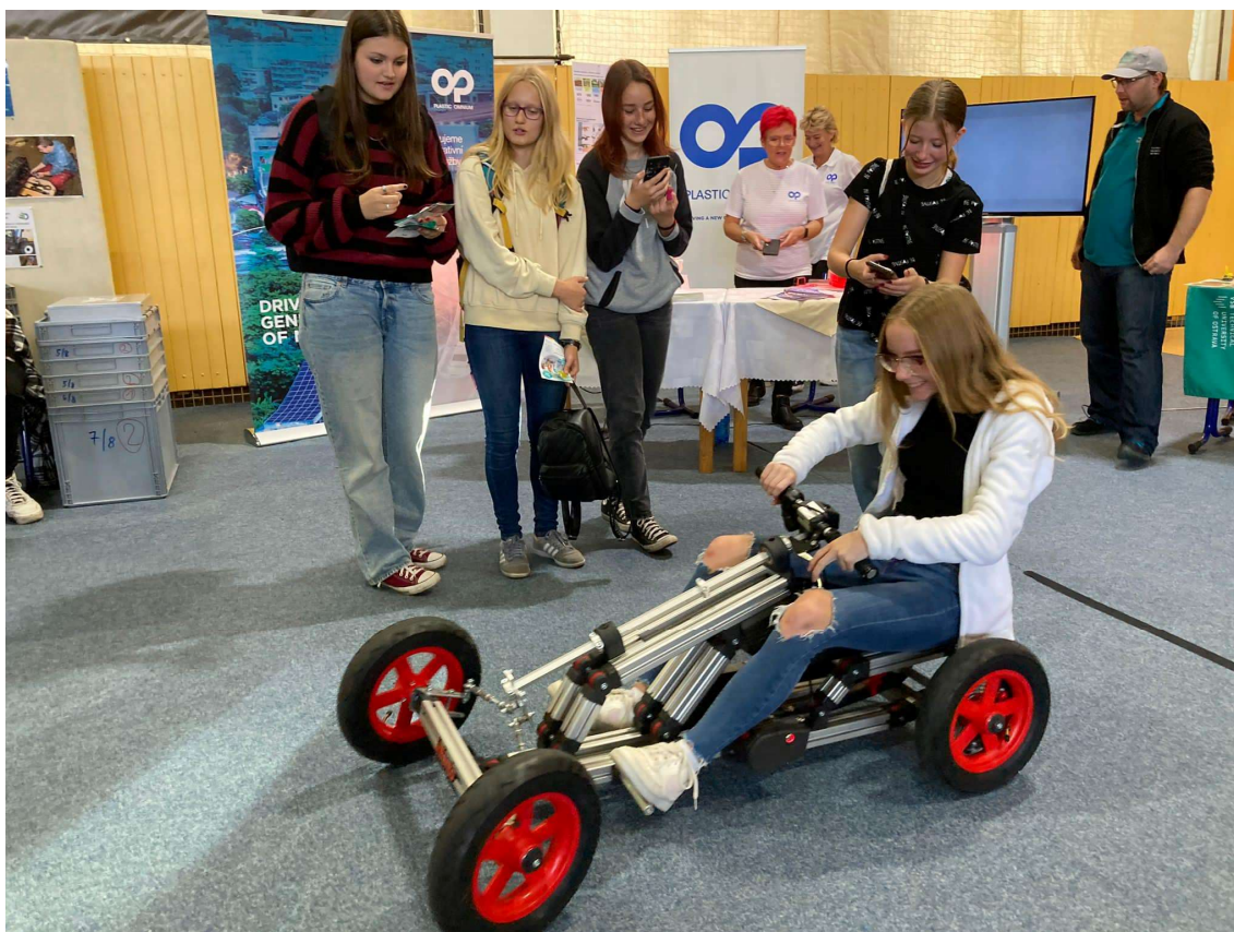
Řemeslo má zlaté dno – 9. ročník při prohlídce profesí a SŠ

V rámci přípravy na volbu povolání jsme realizovali plánované akce – návštěva informačního střediska úřadu práce, exkurze do firem, nábory ve škole a umožnění žákům účastnit se dnů otevřených dveří SŠ.