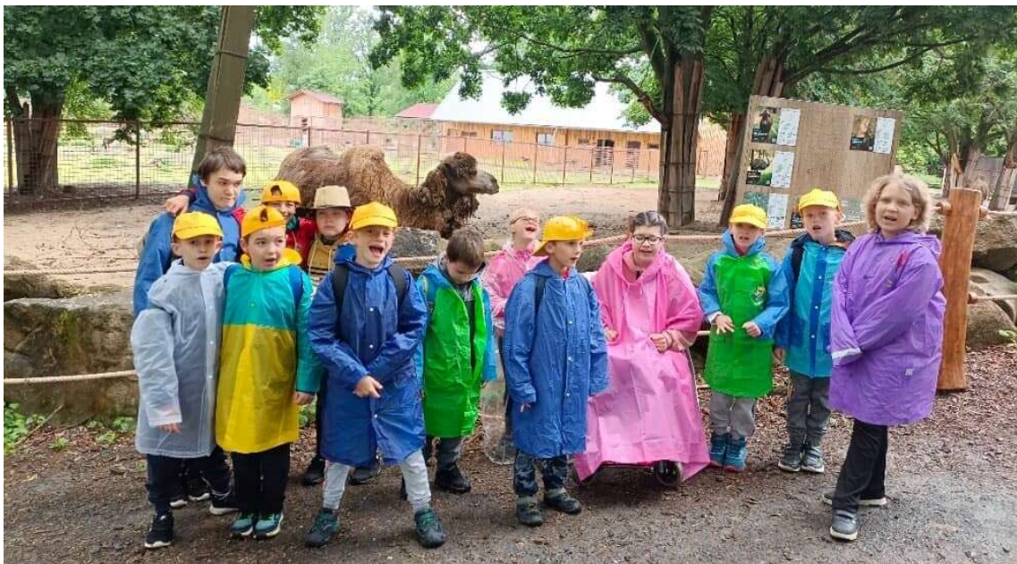
Slunečnice v Zoo