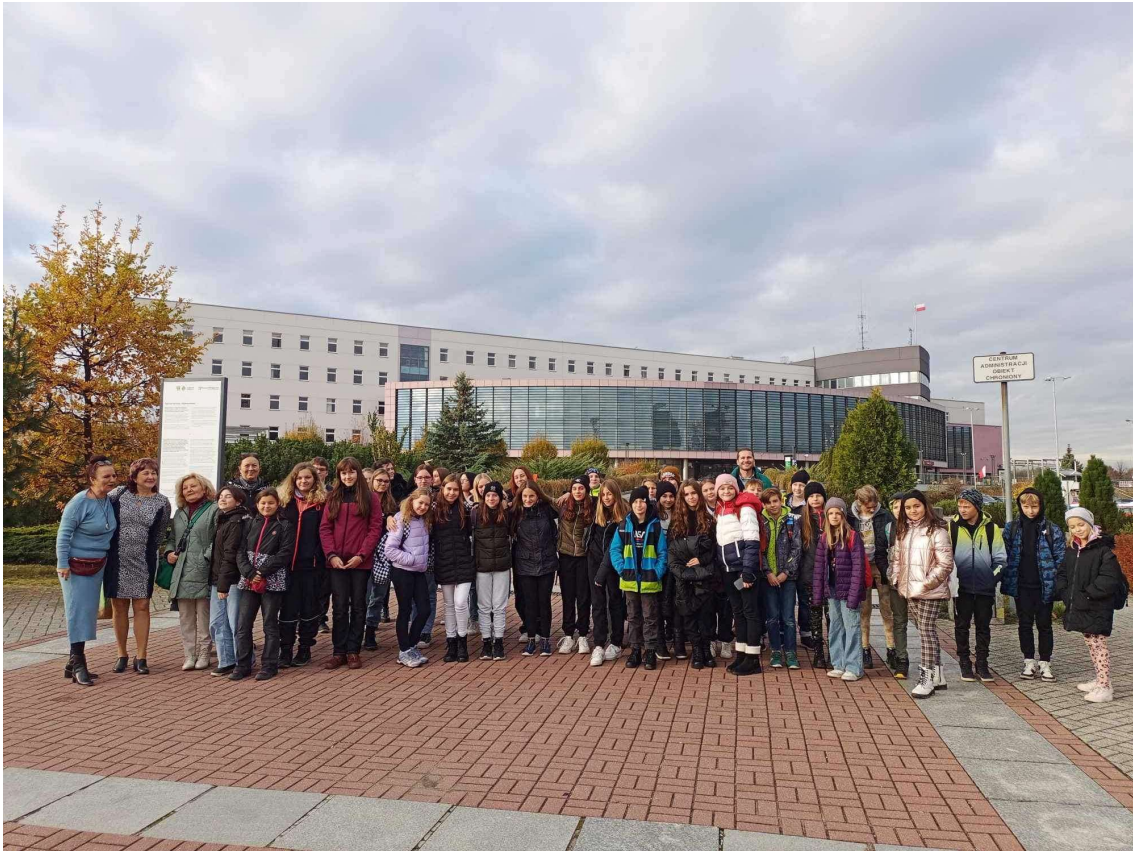
Zástupci školy na návštěvě v partnerském městě Dąbrowa Górnicza