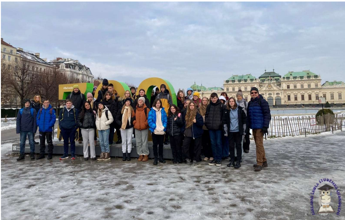
Návštěva Vídně a vánočních trhů