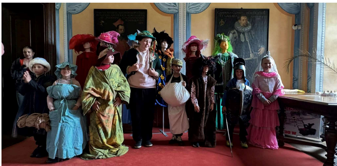
Slunečnice na zámku Kunín