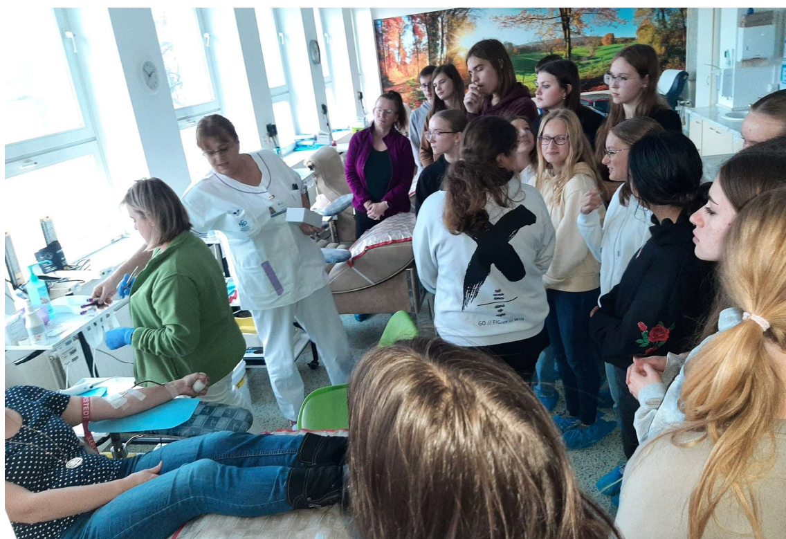
Naši devátáci na návštěvě Krevního centra FNO