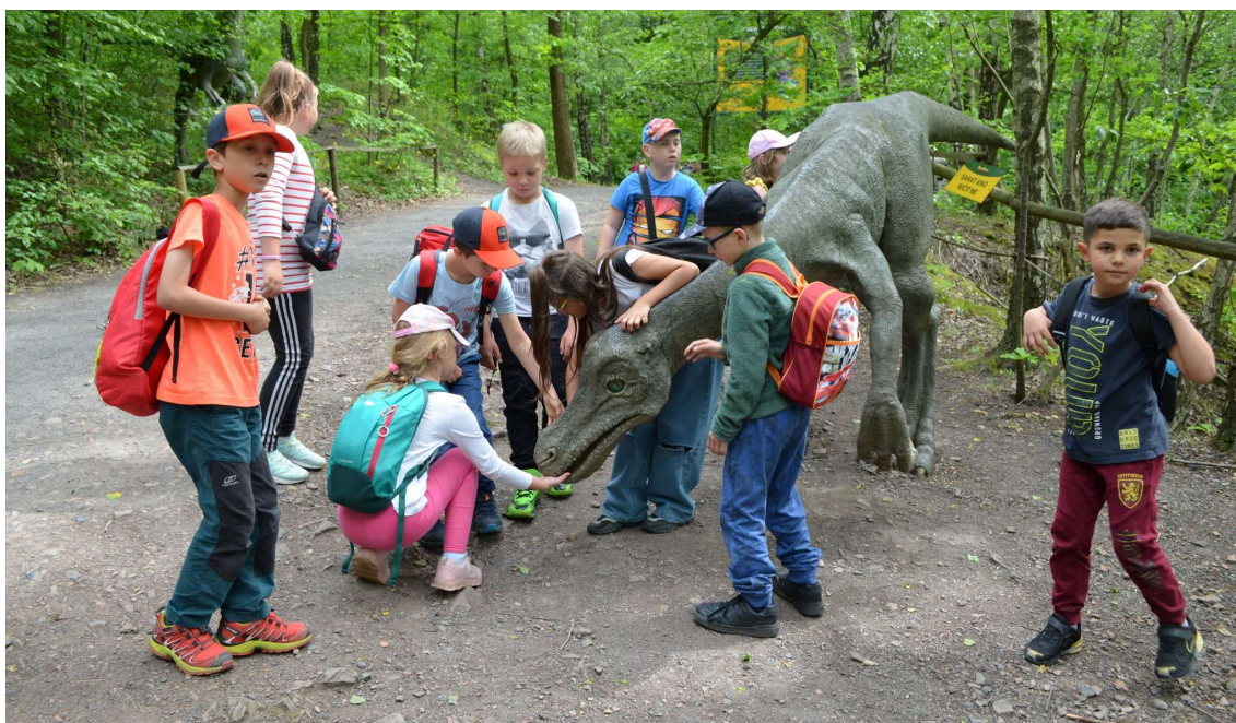
ŠD na výletě v Dinoparku Ostrava

Školní družina se pravidelně prezentuje na Facebooku a webových stránkách školy.