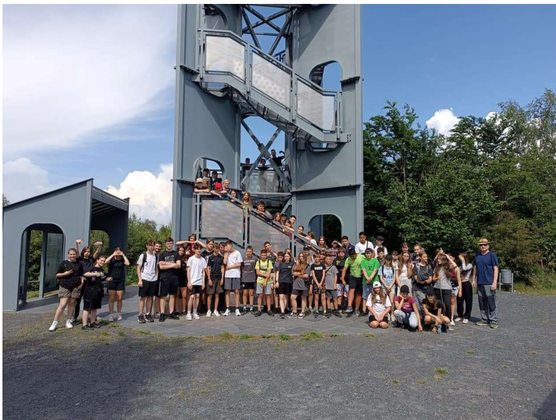
Škola v přírodě 6., 7., a 8. ročníků

Žádný doprovodný program nebylo v tomto roce možné využít. Do projektu jsme přihlášení i pro následující školní rok.