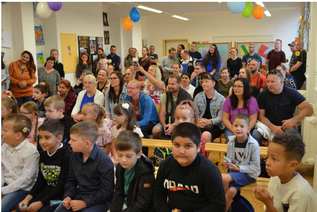
Vítání žáků prvního ročníku

Základní škola Studénka, Sjednocení 650, příspěvková organizace