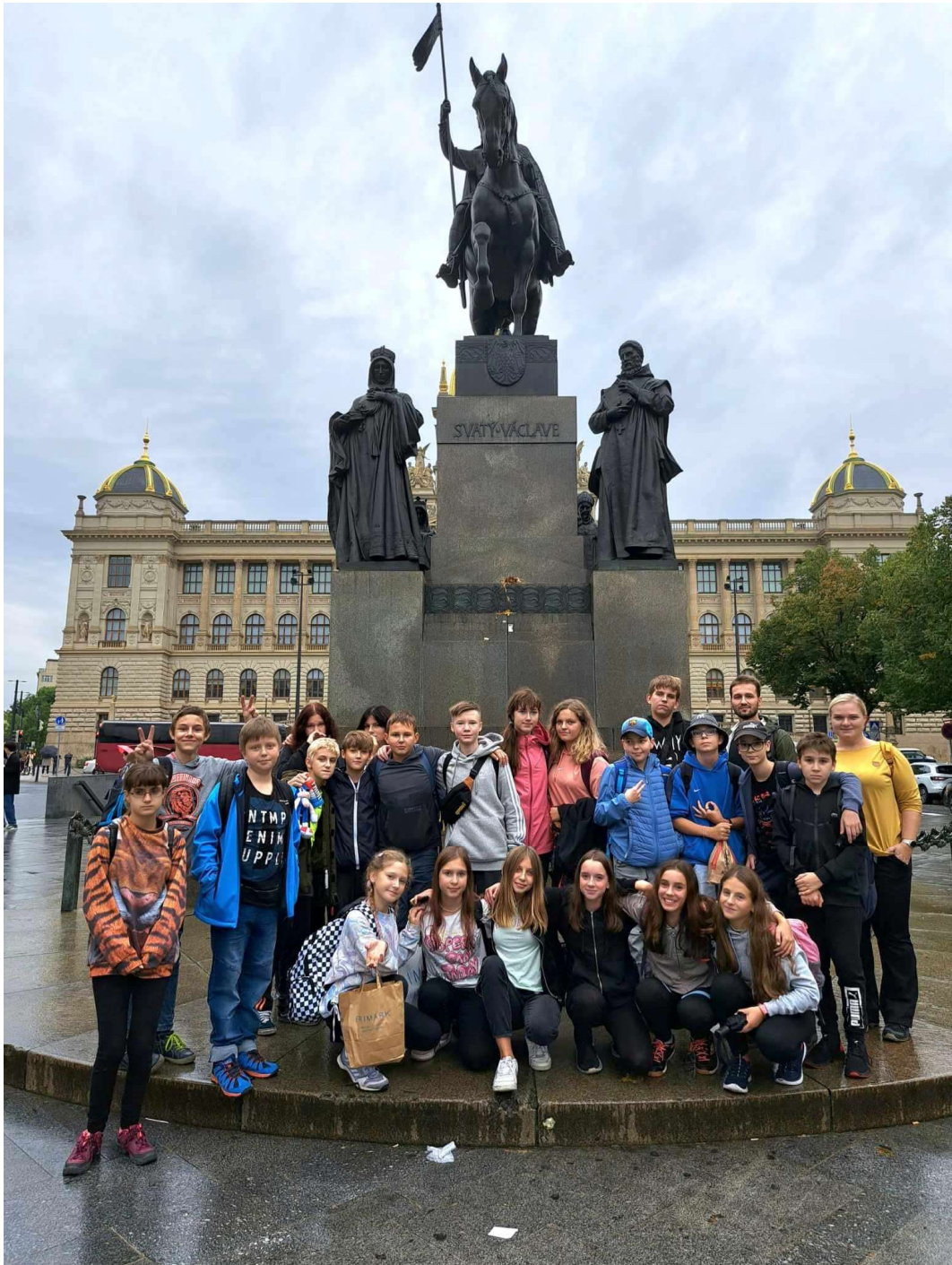
Žáci 7. ročníků na poznávacím výletu v Praze