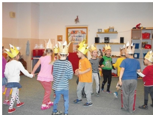
Dramatizace dětí – Tři králové“