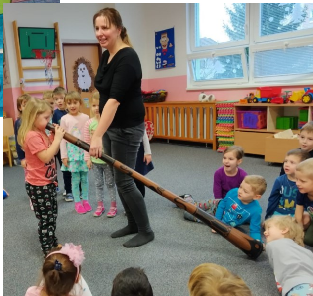
Poznávání cizích kultur – hudba