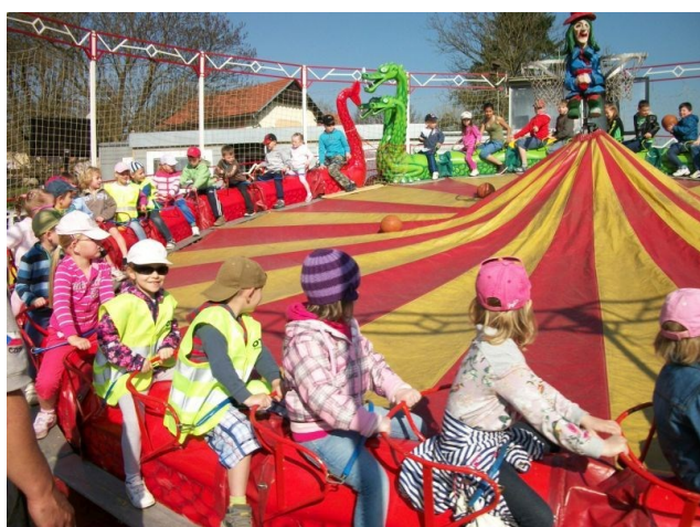
Pouť u Sv. Jiří