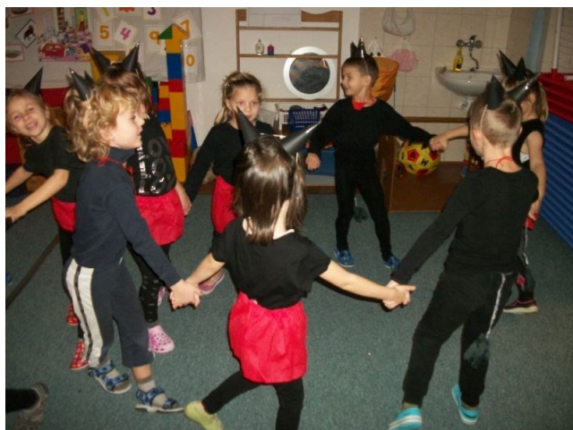
Vánoční besídka „Čerti“