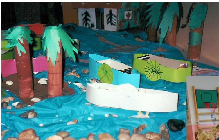
Ukázka společné práce „Moře“ z projektu „Cesta kolem světa“