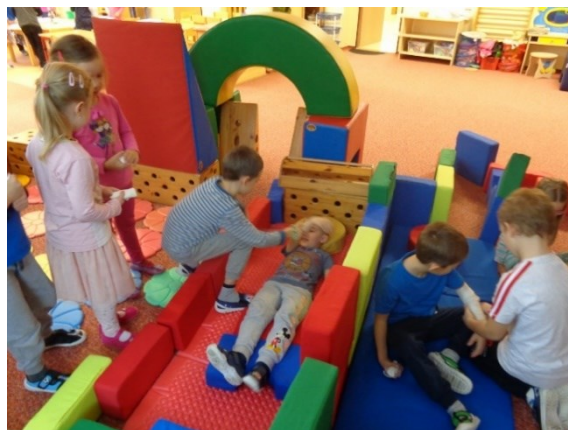
Nemocnice – stavba dětí