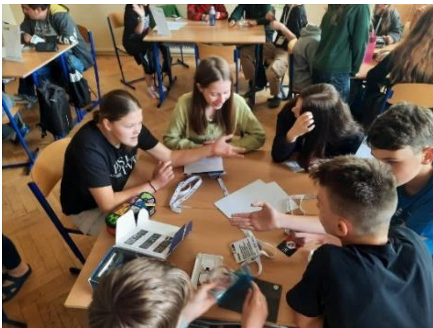
Badatelská chemie v osmé třídě

Novinkou pro letošní školní rok byl v osmé třídě projektový den Naše firma, který připravila společnost NVIAS ve spolupráci s firmou Doosan Škoda Power.