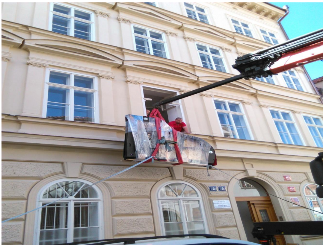
Stěhování klavírů firmou Stahl s.r.o.

Souběžně s uvedenými pracemi probíhaly úpravy interiéru v hlavní budově školy, kde vznikly odborná učebna cizích jazyků, učebna hudební teorie a kabinet. Znovuobnovení provozu domova mládeže si vyžádalo úpravy vnitřních prostor, vymalování chodeb a pořízení nových lůžek včetně lůžkovin. Veškeré práce byly ukončeny dle plánu a v srpnovém přípravném týdnu nastoupili pedagogičtí pracovníci do nově upravených prostor k zahájení nového školního roku.