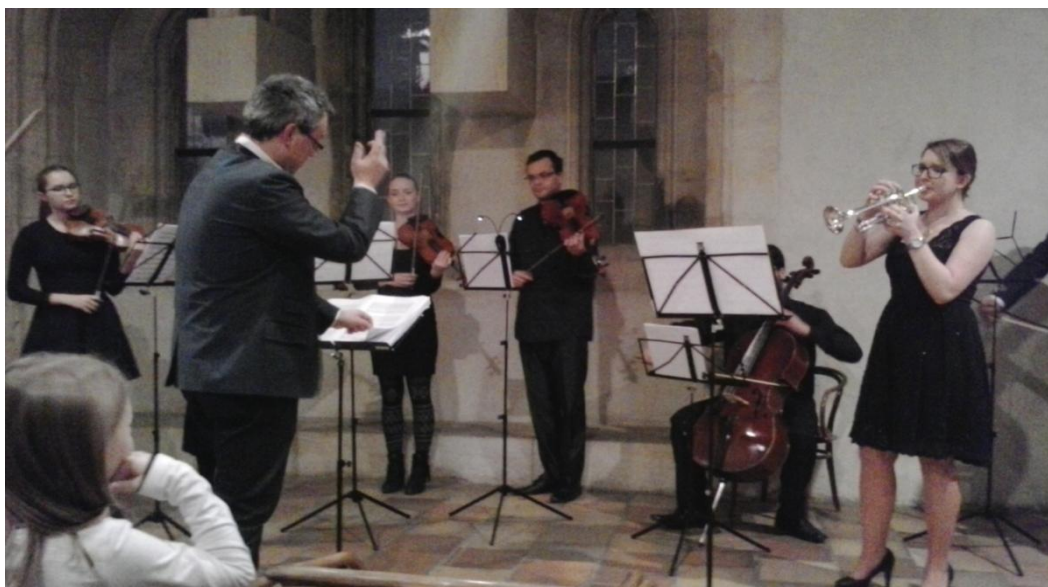
Koncertní síň U Kamenného zvonu