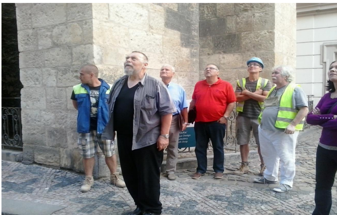
Kontrolní den na stavbě – zástupci firmy KONSIT s.r.o. a členové autorského a stavebního dozoru