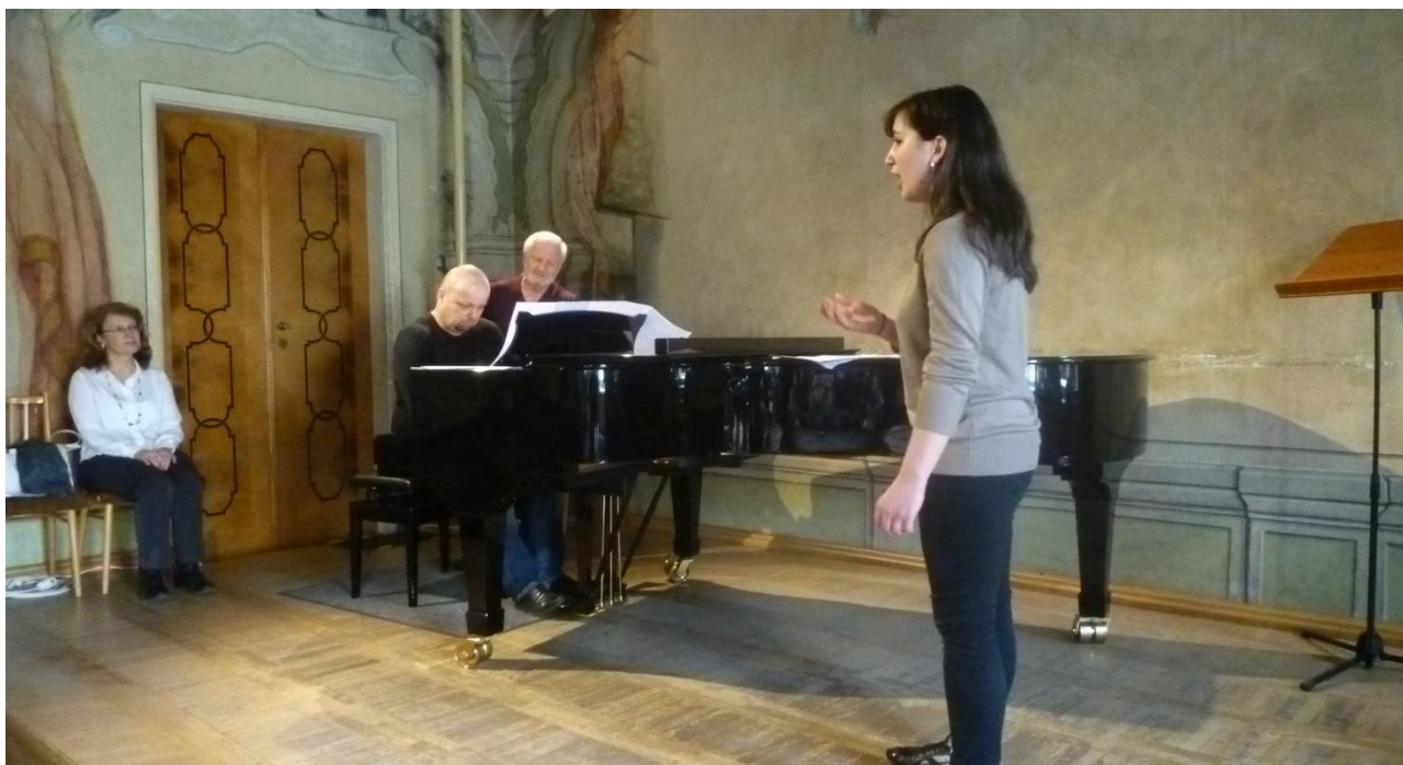
Pěvecké kurzy maestra Antonia Carangela

9. 6. 2017, Odborná společná exkurze žáků a pedagogů oboru Ladění klavírů u firmy „Machat Piana“ v Praze 10