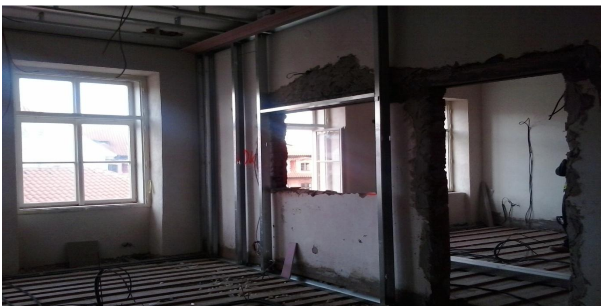
Nahrávací studio před a po rekonstrukci