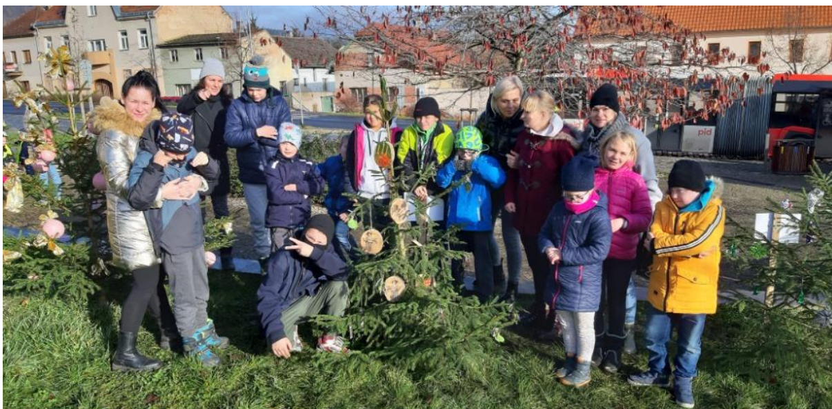
Zdobení vánočního stromku