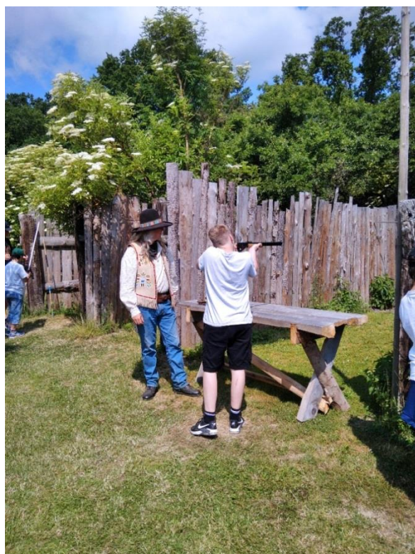
Westernová pevnost Fort Harry