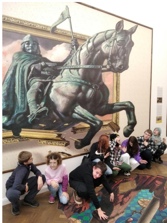
Muzeum iluzivního umění