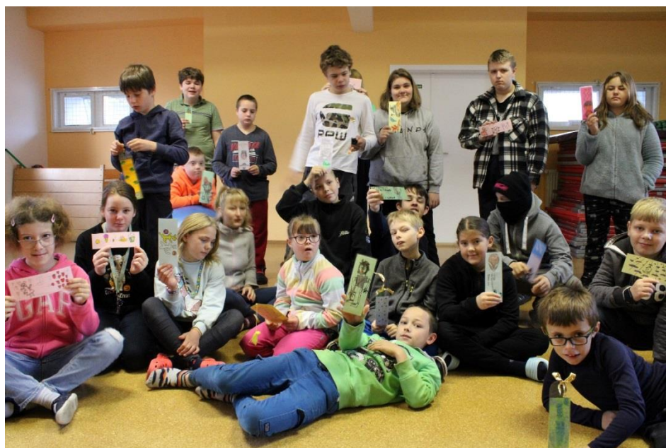
Projekt „Záložka do knihy spojuje školy“