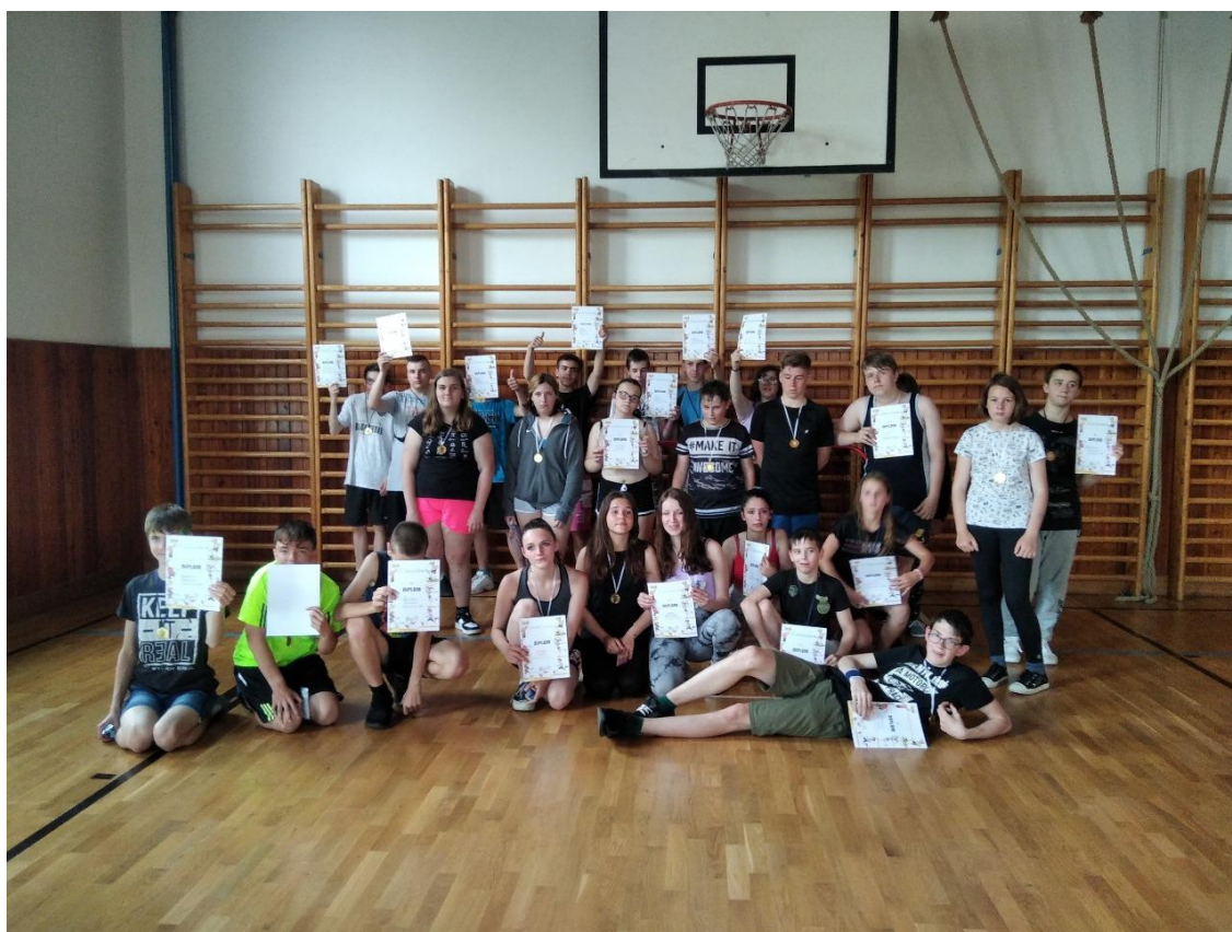
Sportovní den na Dobříši