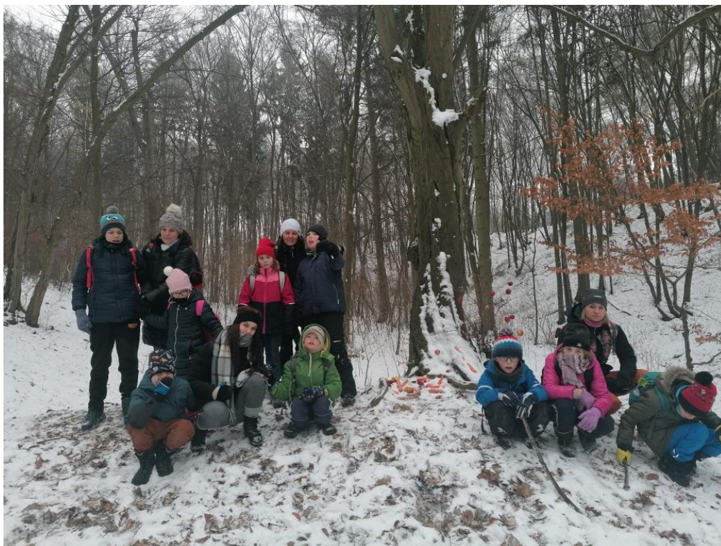
Zdobení vánočního stromku pro zvířátka