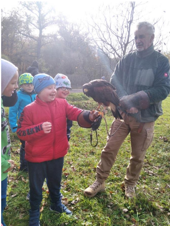
Den s lesníky