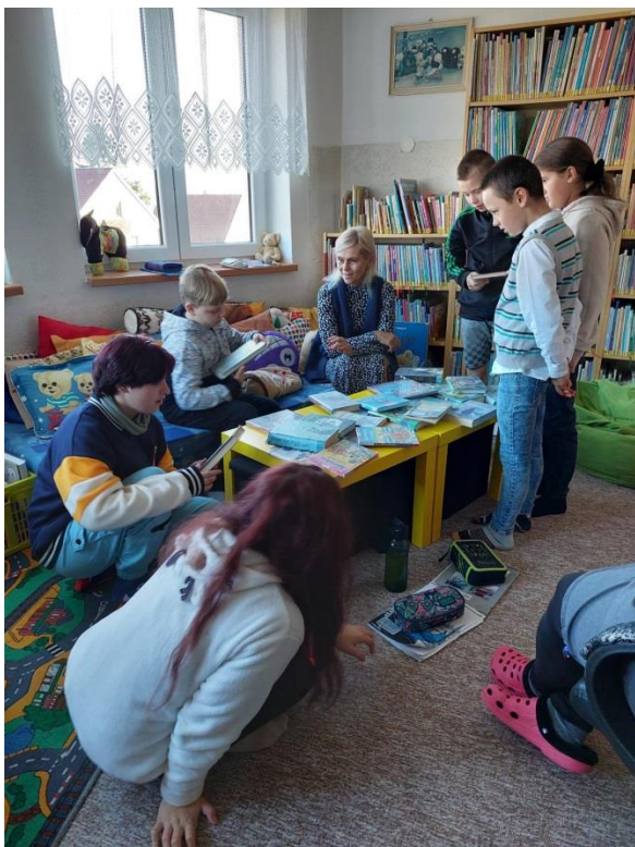
Hodiny českého jazyka v knihovně