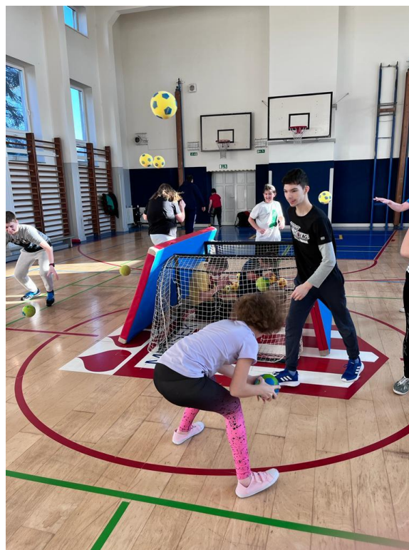
Projekt „Škola v pohybu“