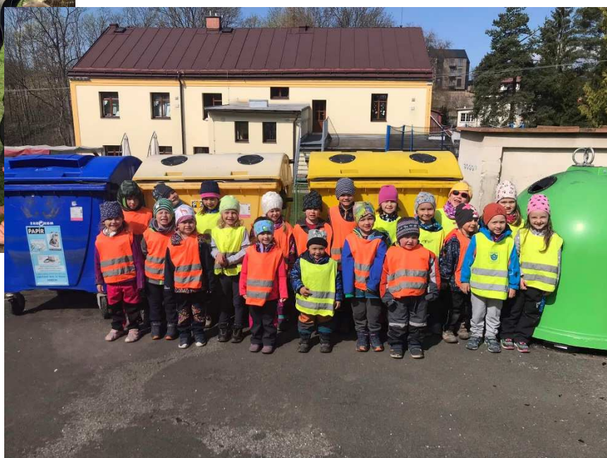
Vypracovala: Barbora Barátová