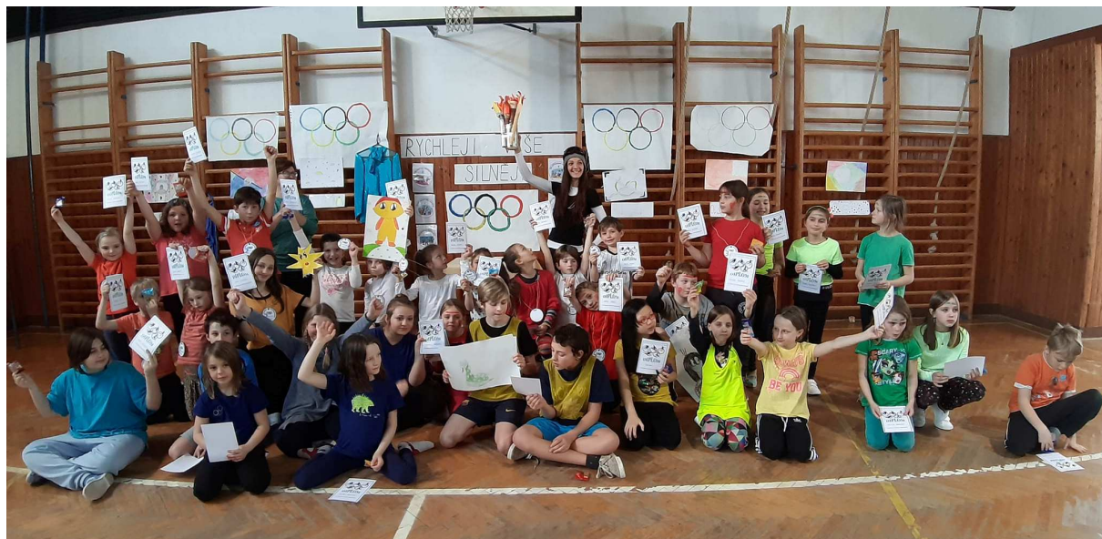
v tělocvičně – včetně slavnostního nástupu a ukončení.

Projekt reagoval na aktuální dění ve sportu – Olympiáda v Číně. Žáci se seznámili s historií olympijských her, s jednotlivými disciplínami a vyvrcholením bylo uspořádání opravdické olympiády