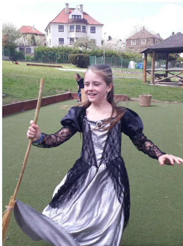
Obr. 10 – Čarodějnice