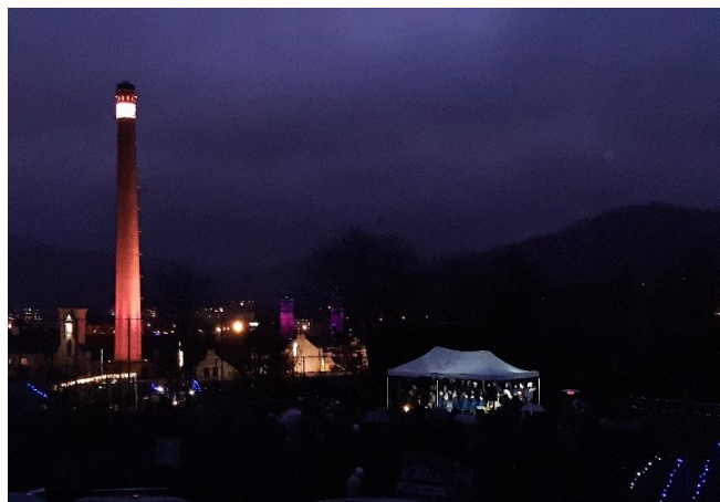
Obr. 16 – Vánoční koncert

Vánoční trhy ještě, bohužel, nešly zrealizovat. Také koncerty školní kapely a školního sboru byly zrušeny. A tak alespoň na otevřeném prostranství školního hřiště jsme si společně zapívali autorské koledy Vánoce nad Děčínem 2021.