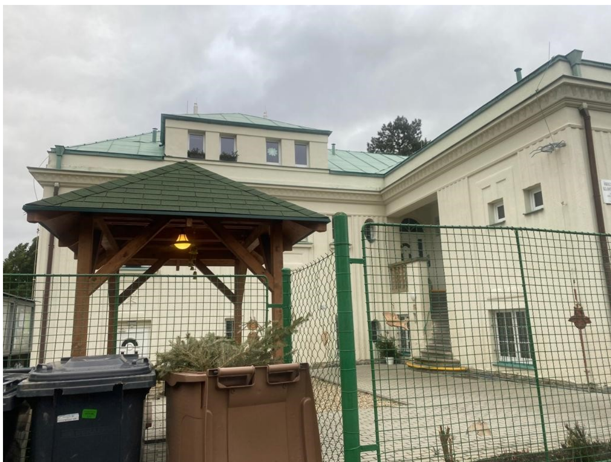
Obr. 3 – Budova ŠD

Školní družina je umístěna v samostatné budově s rozlehlou zahradou mimo objekt školy v ulici Klostermannova (3606 m 2 ). V přízemních prostorách budovy se nachází keramická dílna. V prostorách 1. patra se nacházejí učebny ŠD. Tři oddělení v ŠD Klostermannova jsou plně vybavena novým nábytkem. Školní družina při svých činnostech využívá k pohybovým aktivitám dětí také školní zahrady a školního hřiště. Ve dvou učebnách se v dopoledních hodinách učí také žáci 1.A,B.