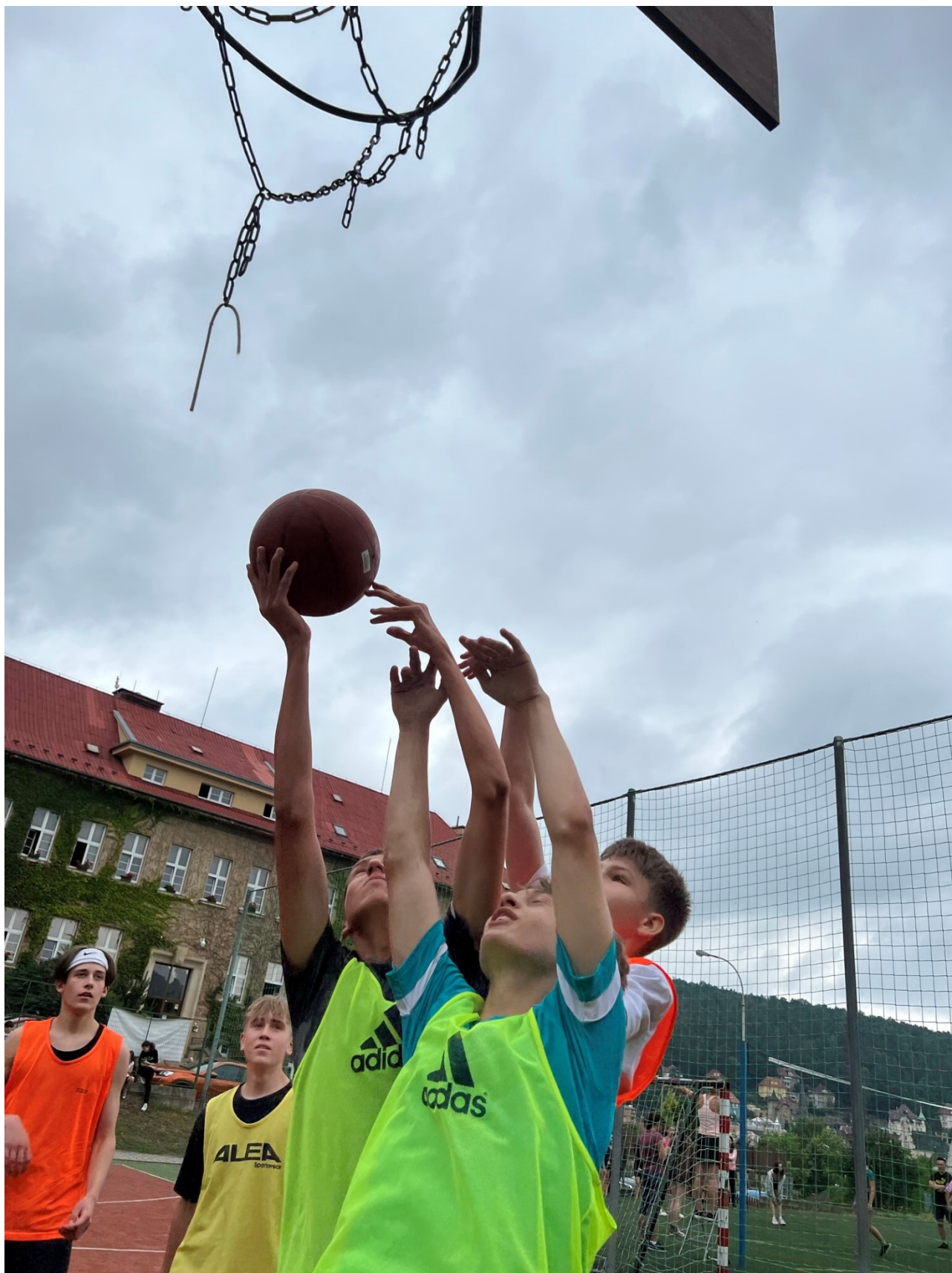
Obr. 19 – Sportovní den