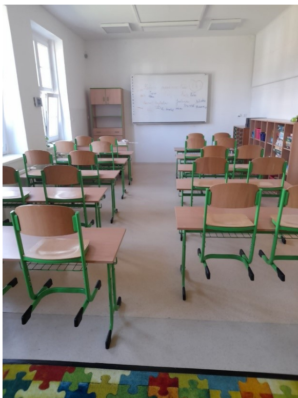
Obr. 4 – Nová učebna v ŠD

V budově ŠD bylo totiž schváleno využívání nově upravených místností oddělení ŠD jako učeben prvních tříd.