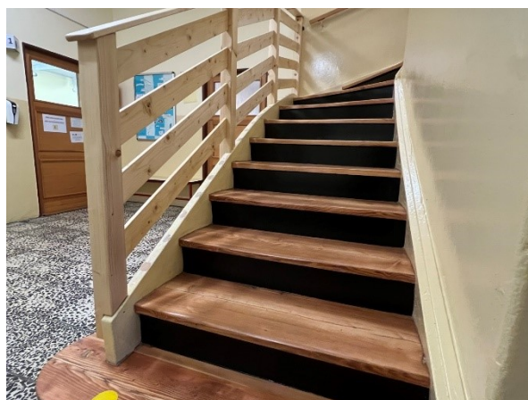
Obr. 5 – Tělocvična po vybroušení a schodiště ve vile