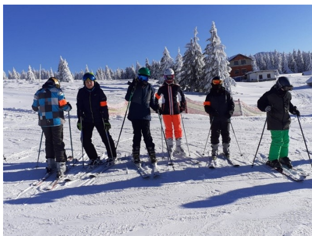
Obr. 14 – LVK