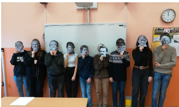
Obr. 15 - Den filosofie, Den hudby

Projektové dny, které se zaměřují na splnění průřezových témat z RVP ZV, probíhaly ve druhém pololetí již ve standardním režimu.