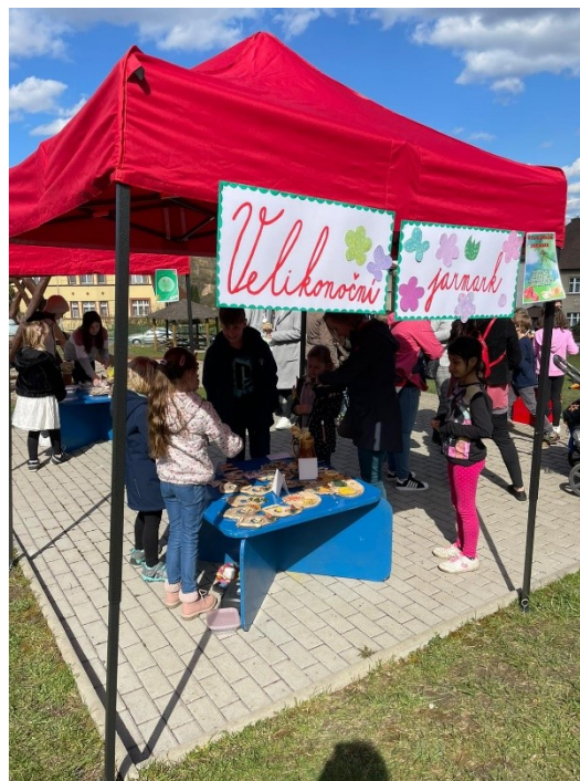
Obr. 9 – Velikonoce