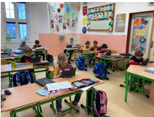
Obr. 7 – Tablety v 1.třídě

Naší snahou je beze zbytku naplňovat vše, co je uvedeno v našem vzdělávacím programu, což se