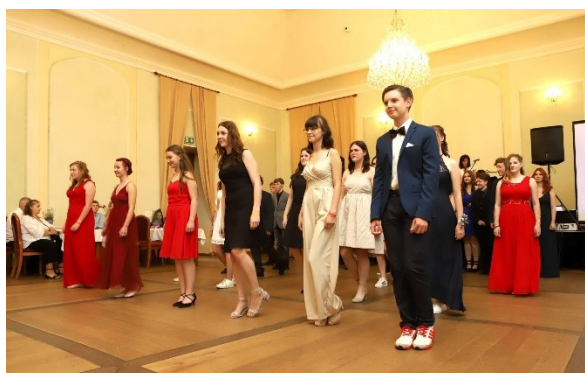
Obr. 17 – Ples

Náročná příprava, nervy, zda se bude moci uskutečnit...ale stálo to za to!!! Zámek Děčín byl svědkem školního plesu 2021/2022.