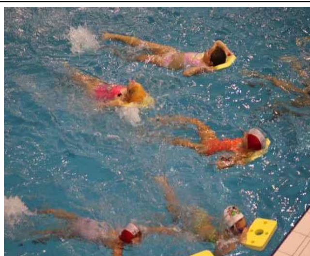
Kurz plavání v AquaCentru Jičín