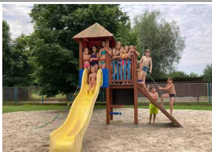
Návštěva koupaliště v Novém Bydžově – II. třída