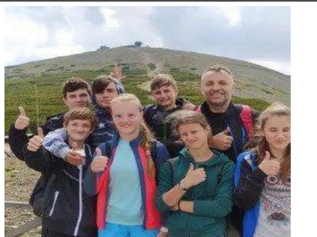
Školní výlet – Výstup na Sněžku – VIII. třída