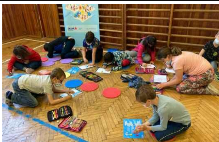
Naučný program FG – Abeceda peněz – Česká spořitelna