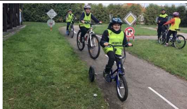
Dopravní výchova – dopravní hřiště NB, 5. roč.