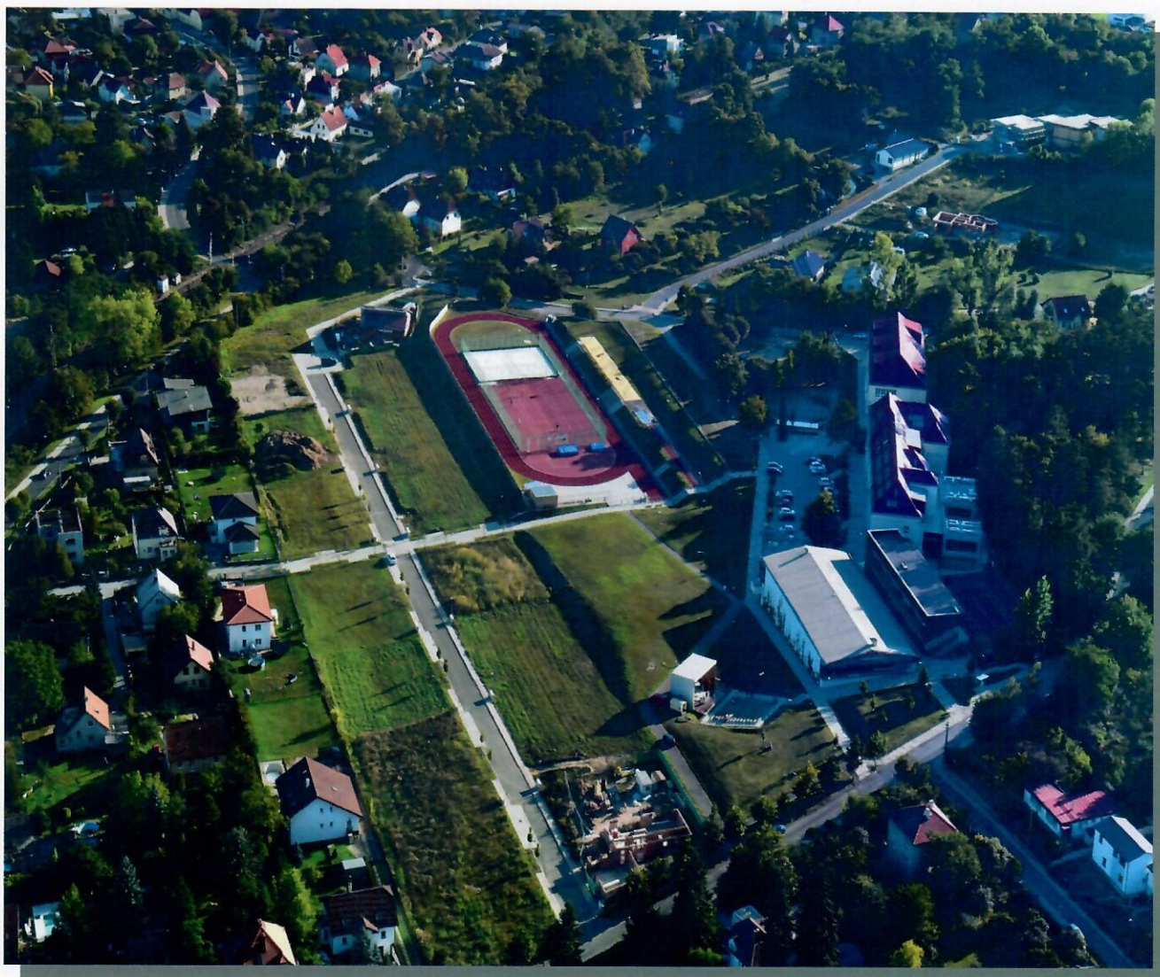
Areál základní školy v Černošicích v červnu 2020