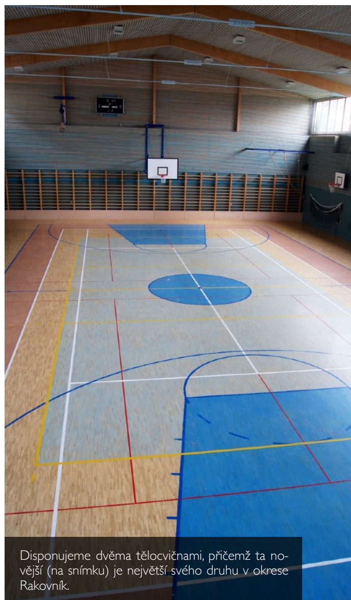
Disponujeme dvěma tělocvičnami, přičemž ta novější (na snímku) je největší svého druhu v okrese Rakovník.

V roce 2003 byla slavnostně otevřena novostavba tělocvičny, která je propojena s šatnovou částí a tím také s učebnovým pavilonem. Škola tak disponuje vynikajícími podmínkami pro rozvoj sportu a současně největší školní tělocvičnou na Rakovnicku.