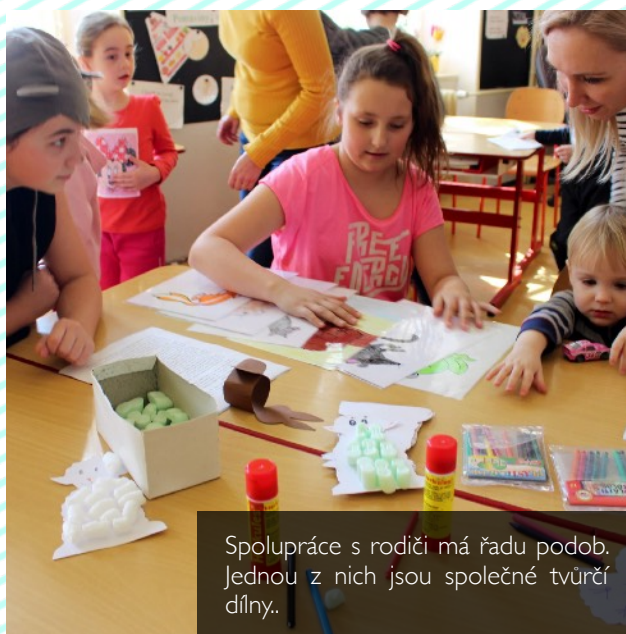
Spolupráce s rodiči má řadu podob. Jednou z nich jsou společné tvůrčí dny.

V září 2018 tak škola otevře dvě první třídy, vzhledem k nedostatku prostoru budou obě umístěny v tzv. Omáčkovně.