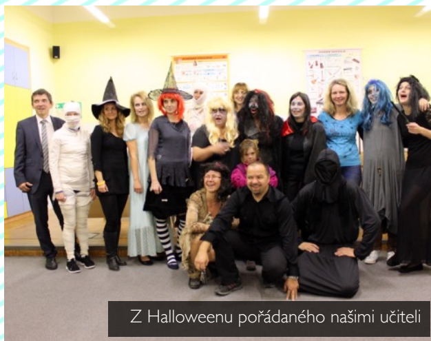
Z Halloweenu pořádaného našimi učiteli

Odchody zaměstnanců a zvyšující se počet žáků jsme řešili přijetím nových pedagogů.