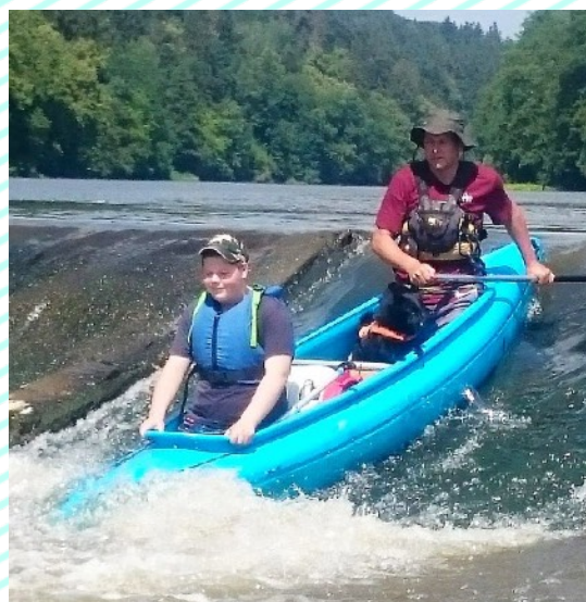
Exkurze a pobytové akce patří tradičně u žáků k nejoblíbenějším. Letos k nim přibyl „vodák“...

Zájmové vzdělávání zajišťuje školní družina. Její kapacita byla po celý školní rok stoprocentně naplněna. Do pěti oddělení ŠD jsme zapsali 150 žáků 1.-5. ročníku.