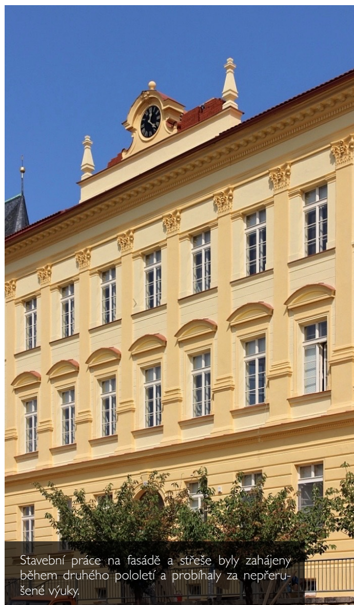
Stavební práce na fasádě a střeše byly zahájeny během druhého pololetí a probíhaly za nepřerušované výuky.

K výuce využíváme 22 učeben. K dispozici máme počítačovou učebnu, učebnu s mobilními zařízeními, odbornou učebnu přírodopisu, cvičnou kuchyňku a objekt školních dílen s moderním vybavením. Pro výuku všech předmětů využíváme učebny s interaktivními tabulemi. Všechny učebny jsou vybaveny stolními počítači s připojením na internet, kromě toho jsme investovali nemalé prostředky do realizace školní wifi sítě.